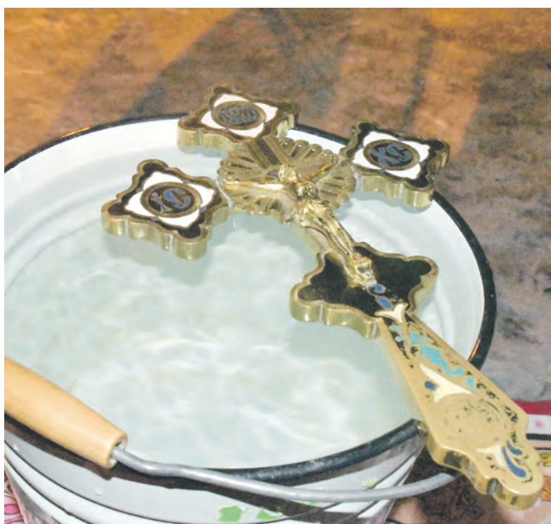
Крещенская вода обладает особой целебной силой.