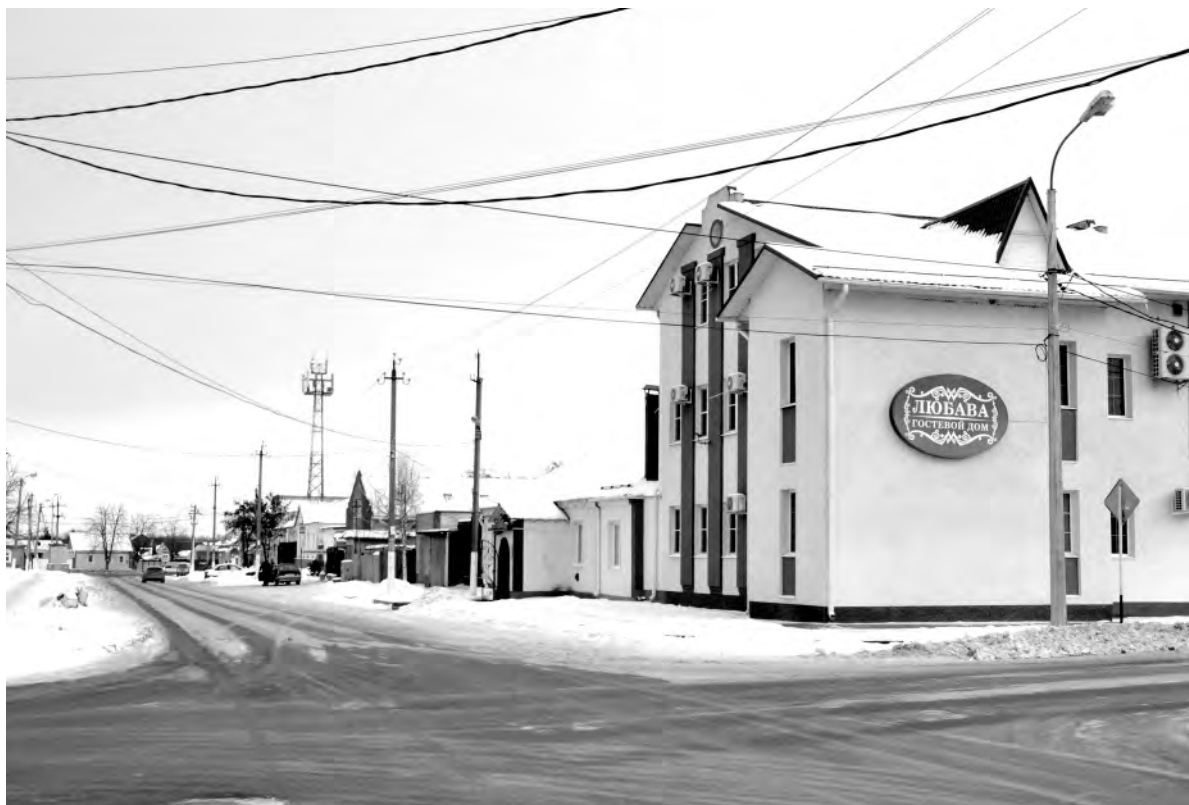
Это же место в наши дни.