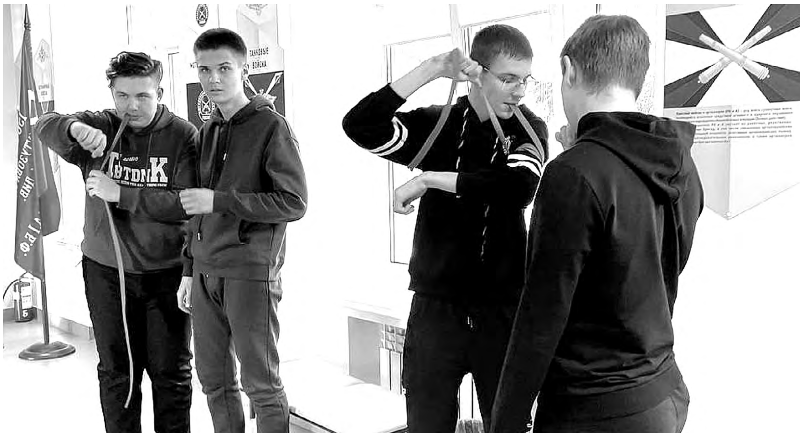
Студенты Алексеевского агротехникума осваивают навыки тактической медицины.