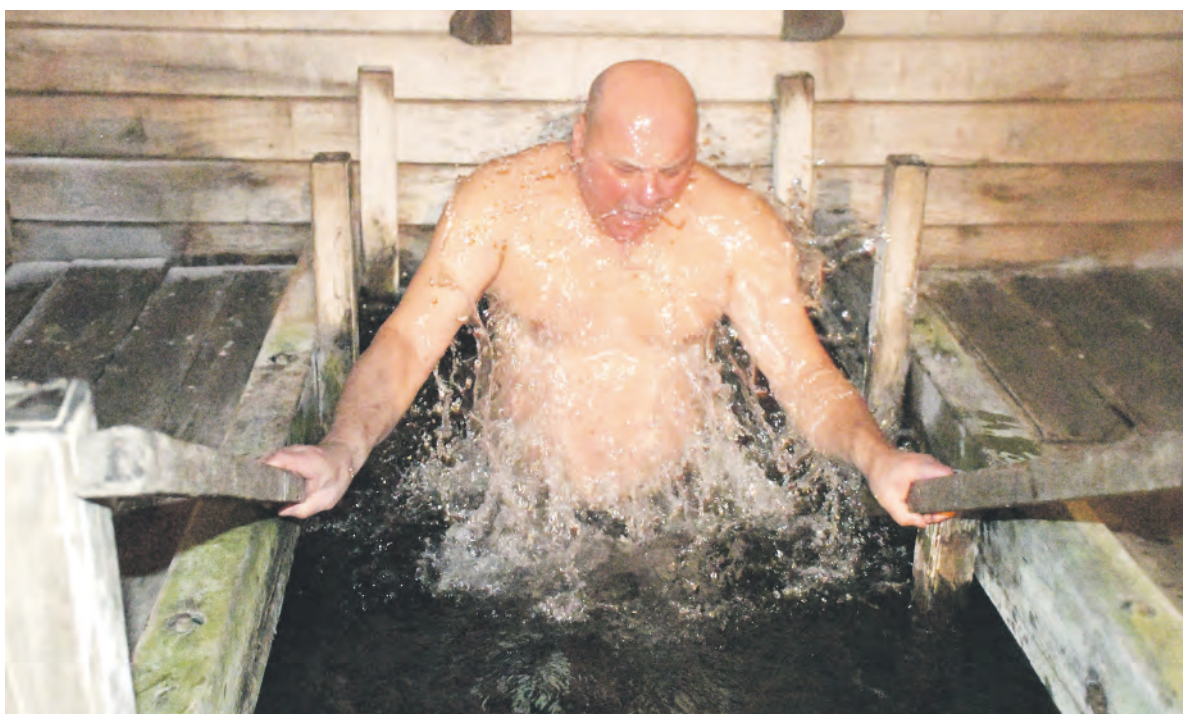
В ледяной воде родника «Рублений» согревает вера.

Заря Учредители: министерство общественных коммуникаций Белгородской области; администрация Алексеевского городского округа, администрация Красненского района Белгородской области, Совет депутатов Алексеевского городского округа Белгородской области, муниципальной совет муниципального района «Красненский район», АНО «Редакция газеты «Заря».