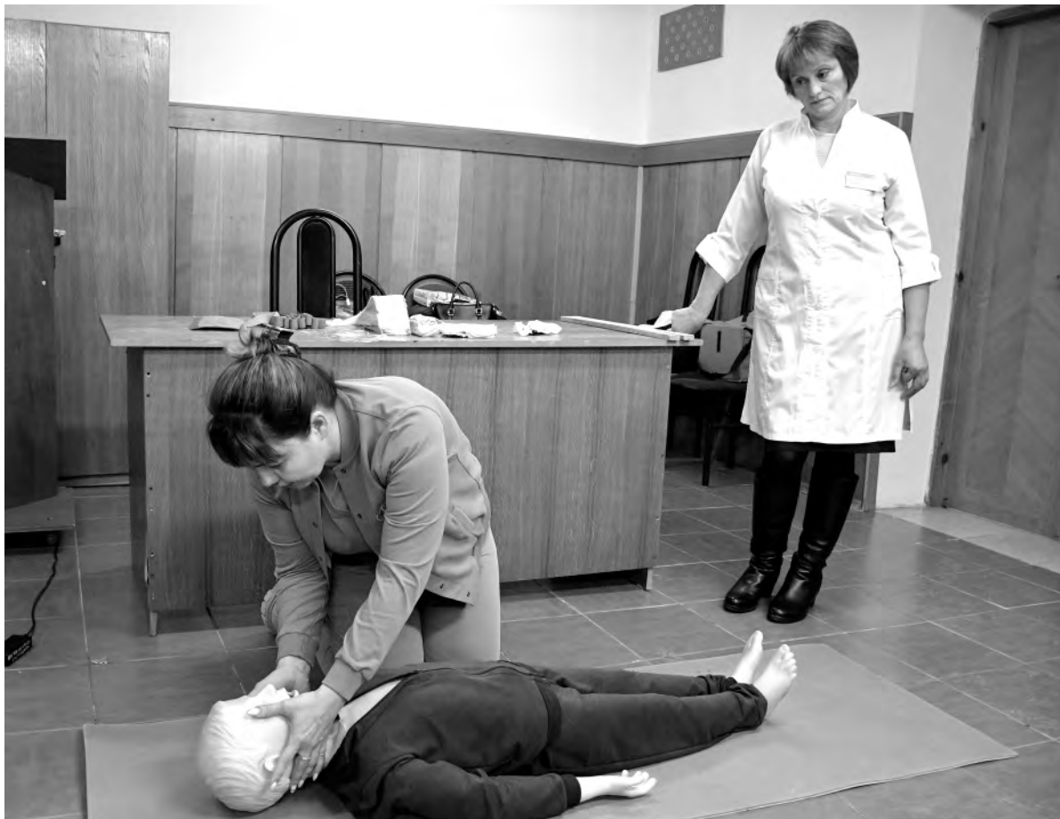
Базовые навыки оказания первой медицинской помощи могут спасти чью-то жизнь.