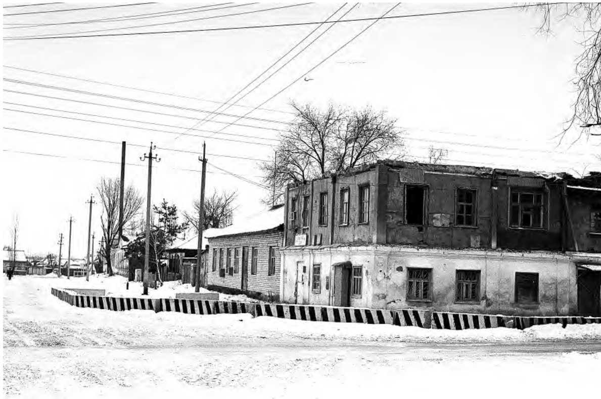
Ул. Степана Разина. 1990-е годы.