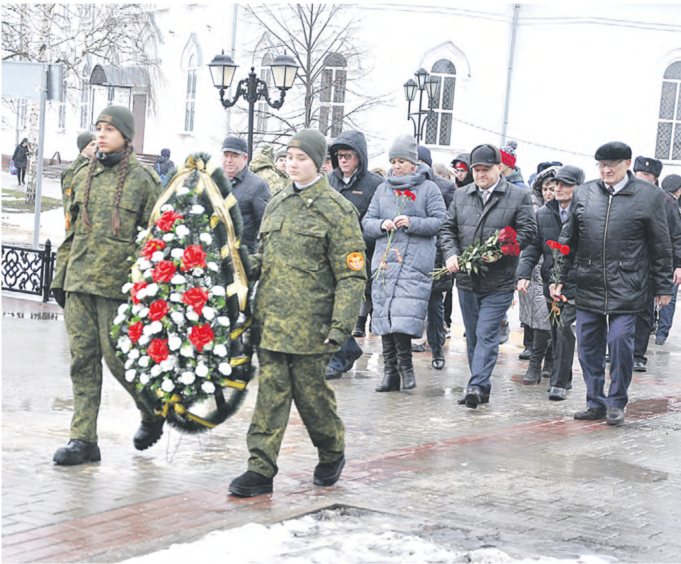
Алексеевцы идут на возложение цветов к братской могиле.