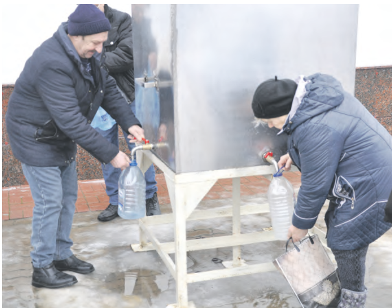
Алексеевцы набирают крещенскую воду.