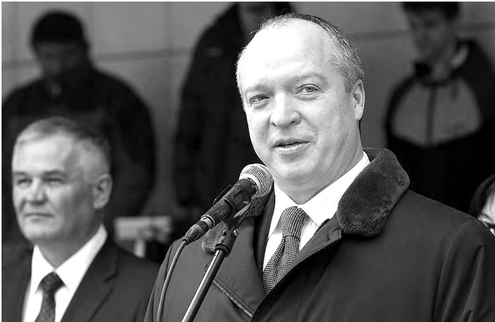
Депутат Государственной Думы Андрей Скоч всегда протягивает руку помощи людям в трудной жизненной ситуации.