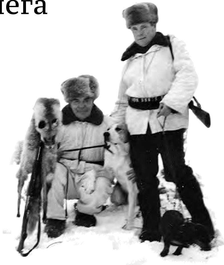
Друзья-охотники с добычей.