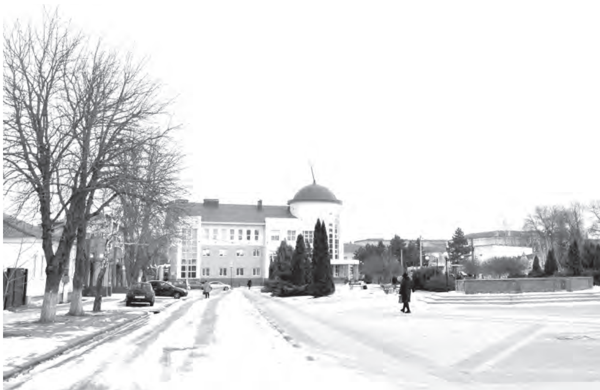
Это же место в наши дни.