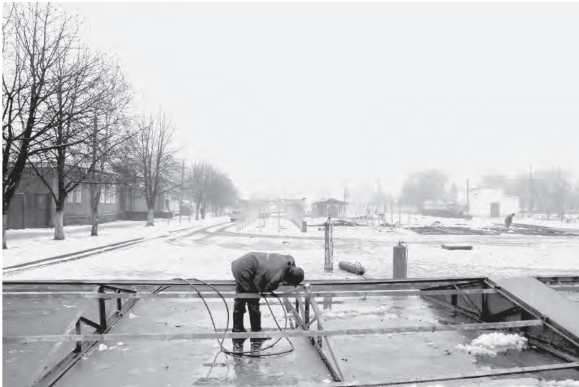
Никольская площадь (III Интернационала). 2000-е годы.