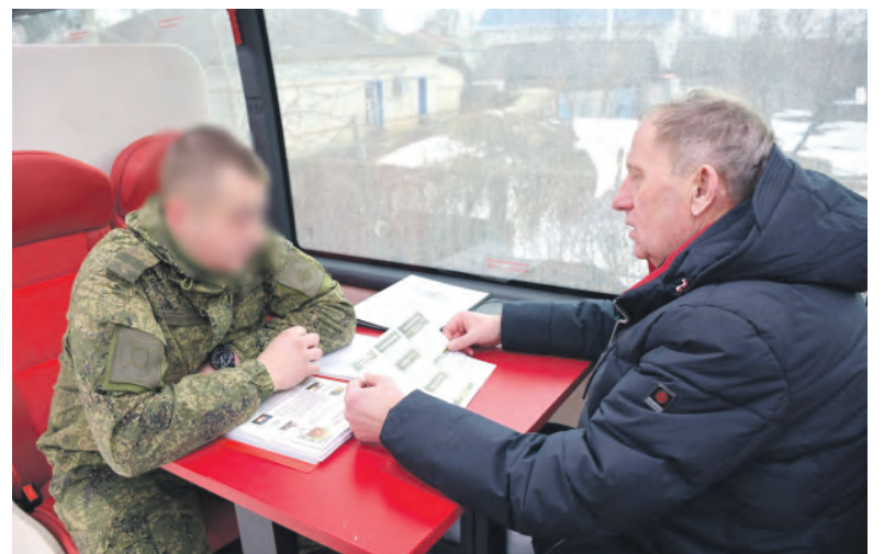
«Военкомат на колёсах» посетили десятки красненцев.

Заря Учредители: министерство общественных коммуникаций Белгородской области; администрация Алексеевского городского округа, администрация Красненского района Белгородской области, Совет депутатов Алексеевского городского округа Белгородской области, муниципальной совет муниципального района «Красненский район», АНО «Редакция газеты «Заря».