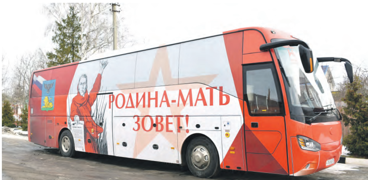
Такой приметный автобус курсировал по нашим муниципалитетам в течение двух недель.