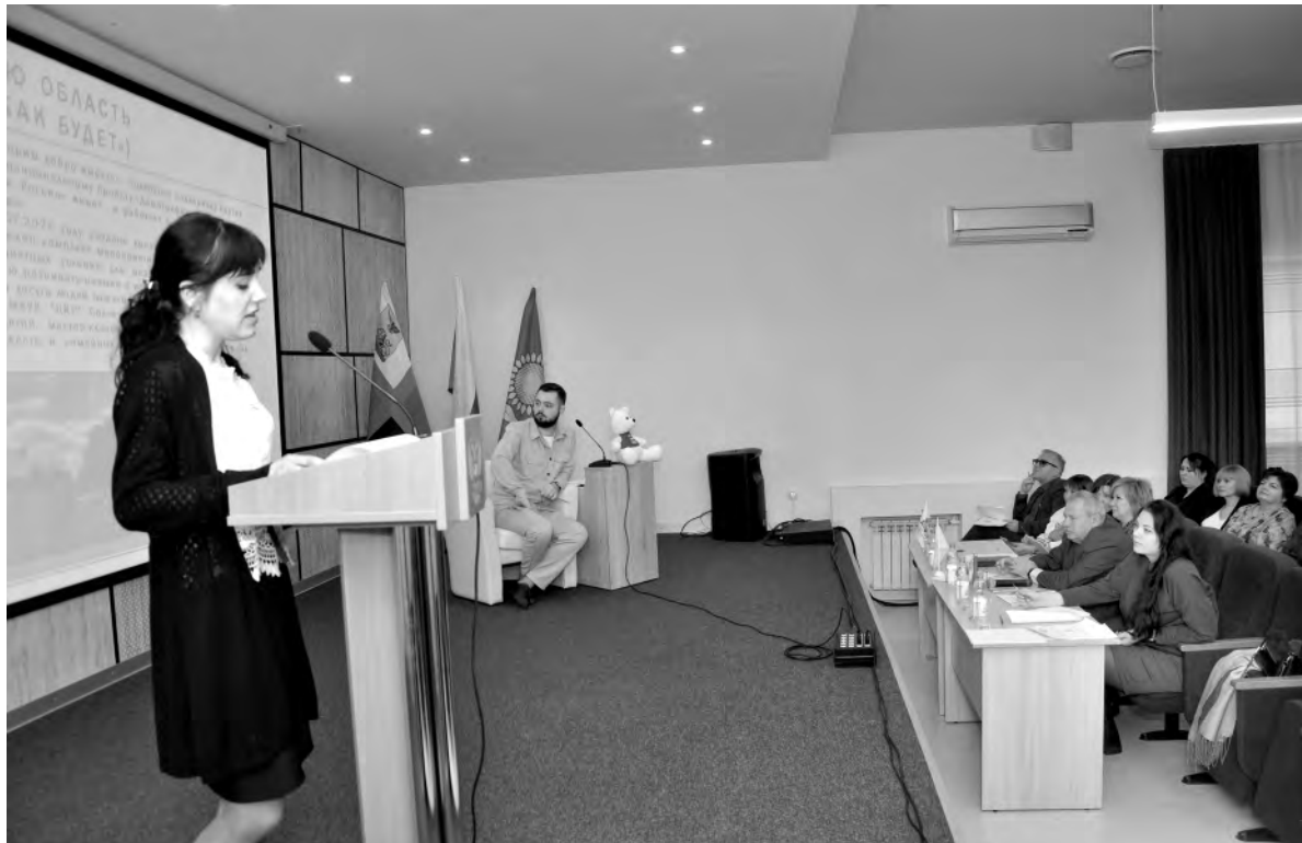
Идёт защита очередного проекта в малом зале Центра культурного развития «Солнечный».

Авторы идей, занявших пять первых мест, вскоре отправятся на региональный этап. В нашем случае победителями стали проекты: «Создание культурного пространства летней парковой площадки «Арт-Усадьба Николая