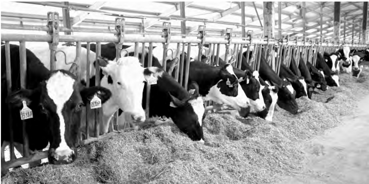
Залог хорошей продуктивности на ферме ЗАО «Молоко Белогорья» агрохолдинга «Авида» — изобилие кормов и правильный уход за коровами.