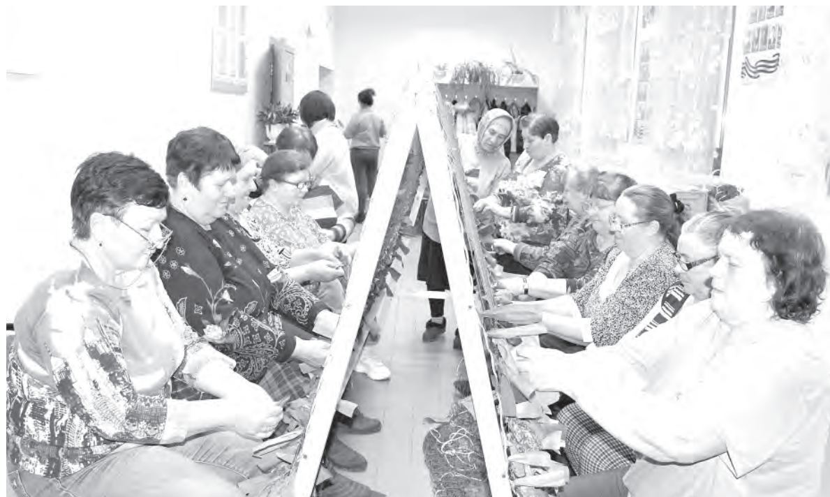
Богословские мастерицы дружно плетут маскировочные сети.