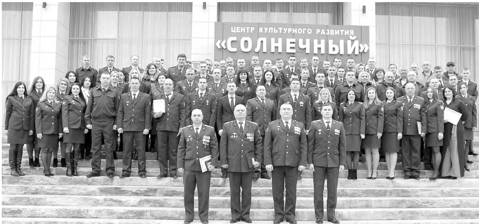
Юбилеры уголовно-исполнительной системы Алексеевского городского округа.