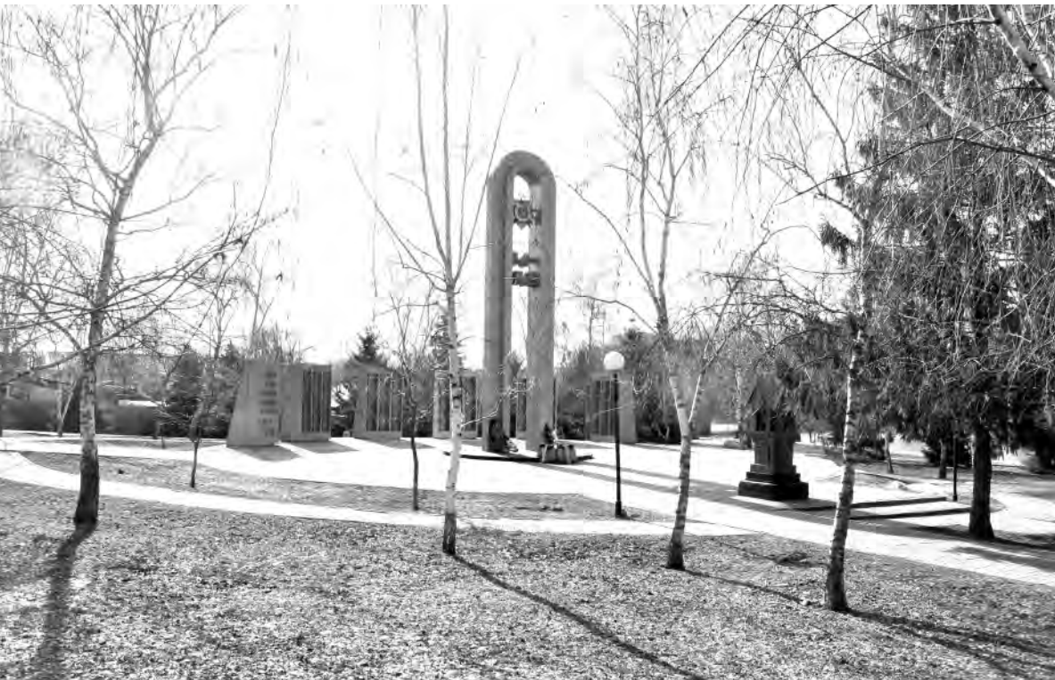
Это же место в наши дни.