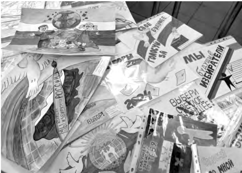
Конкурсные работы рисунков к выборам Президента.