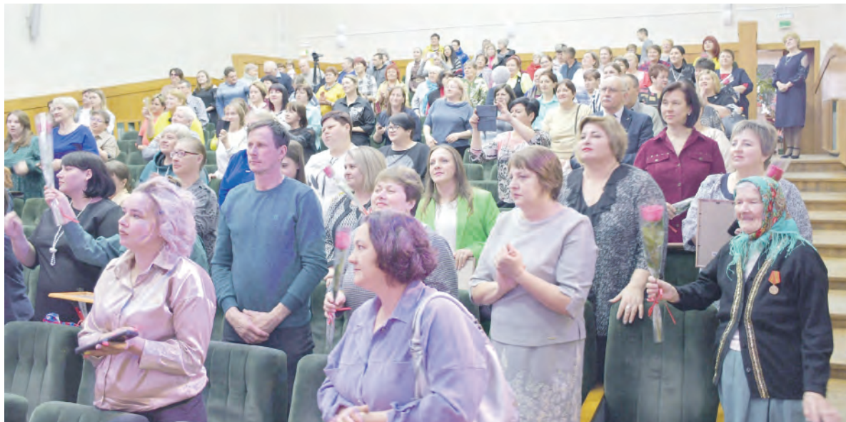
На протяжении концертной программы красненские культработники поддерживали коллег, выступавших на сцене.