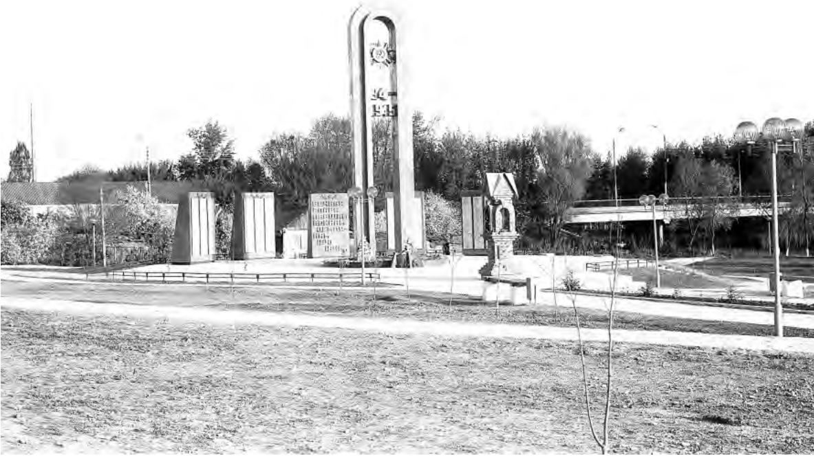
Мемориал Солдатской Славы на набережной. 1990-е годы.