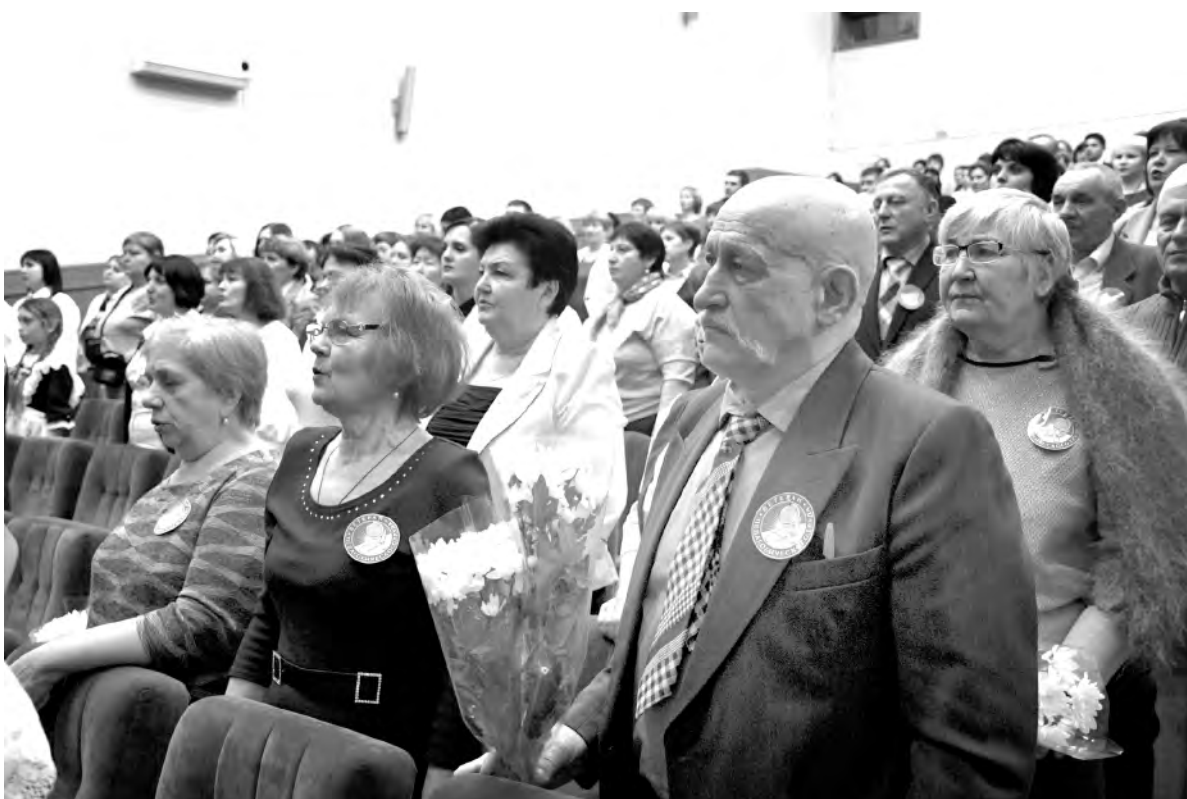
Почётные места в зрительном зале заняли ветераны педагогического труда.