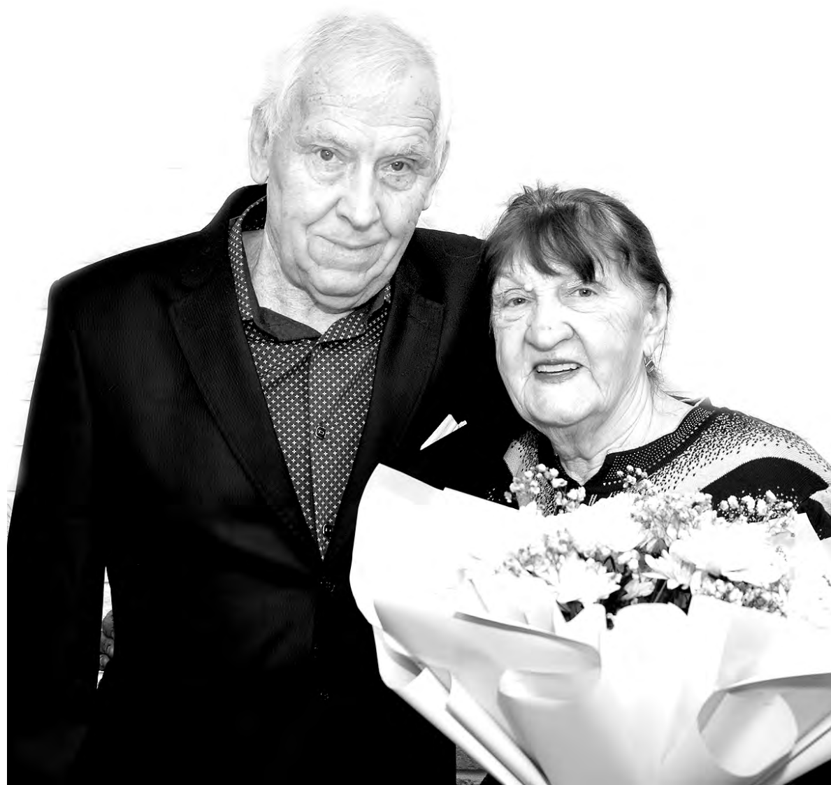
Вот оно чудо — рубеж совместной жизни в 55 лет преодолен, а счастье в доме таится по-прежнему!