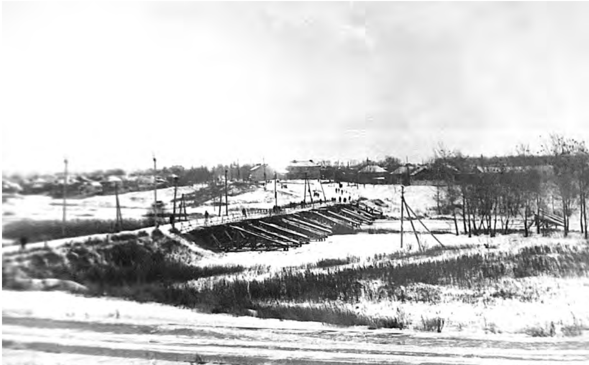
Николаевский мост в районе девятиэтажек. 1970-е годы.