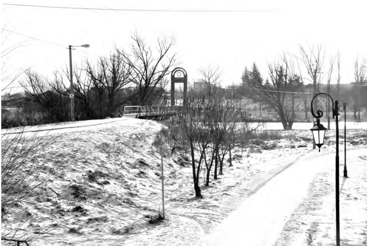
Это же место в наши дни.