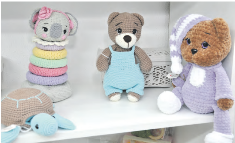
Эти игрушки для самых маленьких. Они не простые — с секретом. Помогают развивать мелкую моторику.