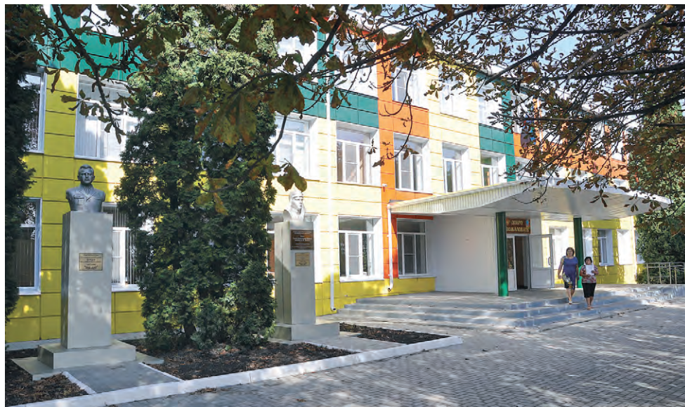
Внешний вид обновлённой школы.