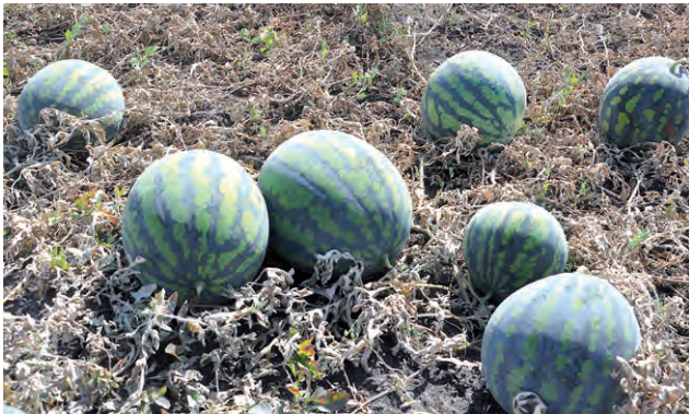
На сладкую ягоду нынче урожай.

Самый большой в мире арбуз был выращен в США фермером Крисом Кентом. Крупный арбуз, выращенный им, весил больше 158 килограмм. Этот рекорд занял соответствующее место в книге известного всем нам Гиннесса.