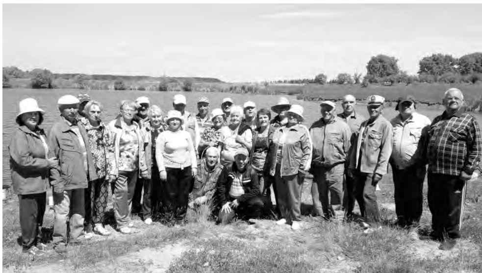
Соревнования по рыбной ловле подняли его участникам настроение.

Фотографии на память, заряд здоровья, удоволь-