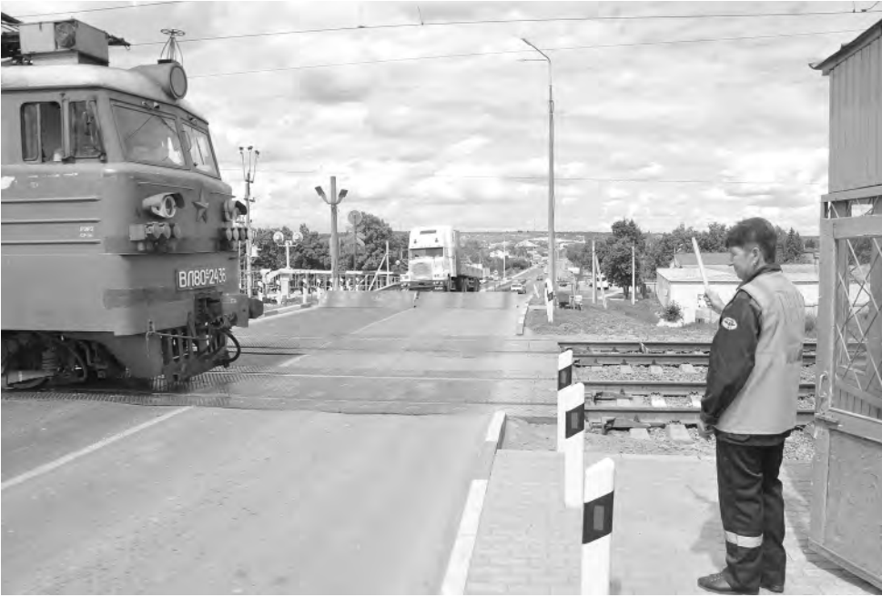
На переезде нужно быть вдвойне внимательным.

В международный день привлечения внимания к железнодорожному переезду Алексеевский район посетил заместитель начальника юго-восточной дирекции инфраструктуры — начальник Белгородского отделения Алек-