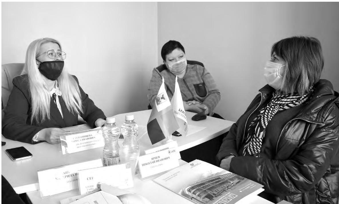
Участников мероприятия познакомили с работой интернет-сервисов Белгородэнергосбыта.