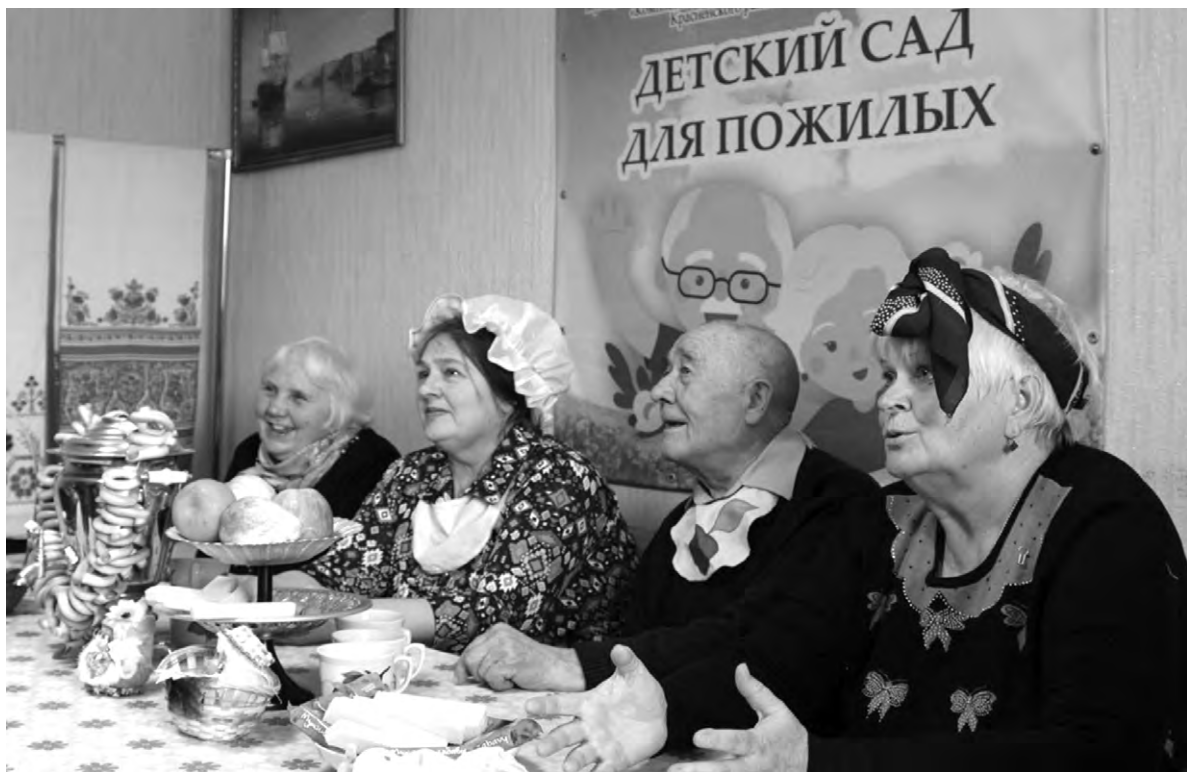
В «Детском саду для пожилых» пенсионеры проводят время интересно и с пользой.