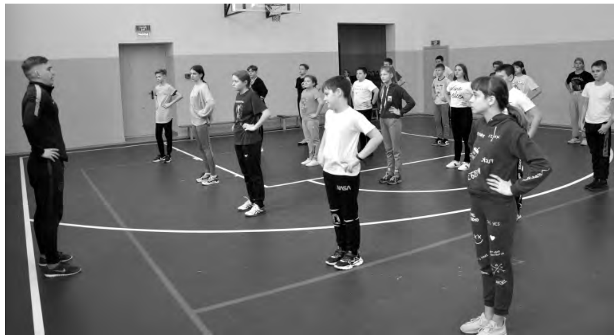
Заниматься физкультурой в обновлённом зале — одно удовольствие.

Ремонт учебного заведения был произведён в рамках реализации областной программы капитальных вложений и обошёлся в 108 миллионов рублей.