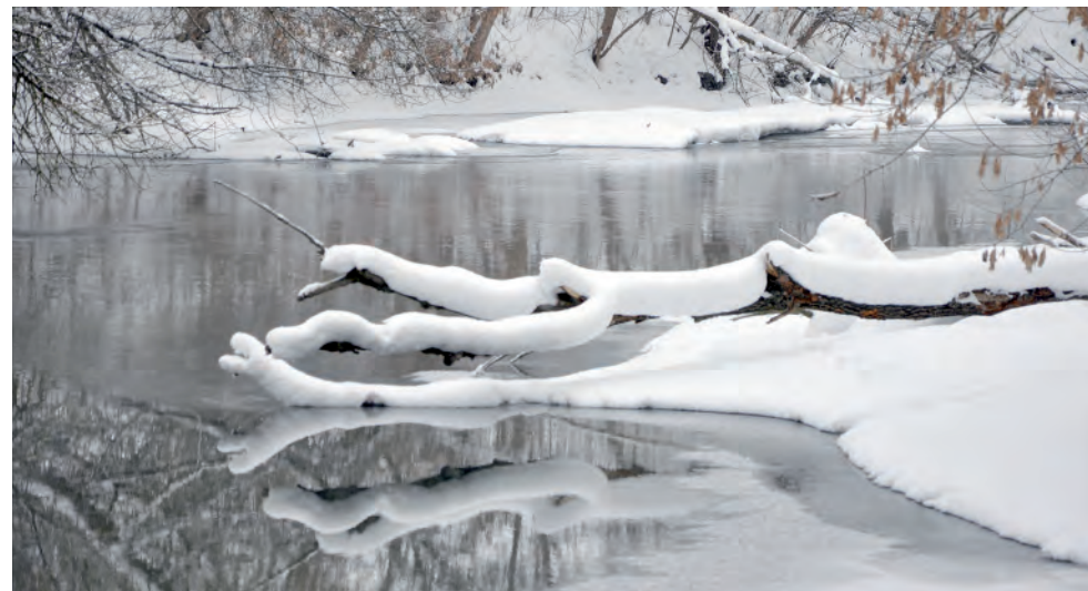
Река прекрасна и зимой.

Заря Учредители: департамент внутренней политики Белгородской области; администрация Алексеевского городского округа, администрация Красненского района Белгородской области, Совет депутатов Алексеевского городского округа Белгородской области, муниципальной совет муниципального района «Красненский район», АНО «Редакция газеты «Заря».