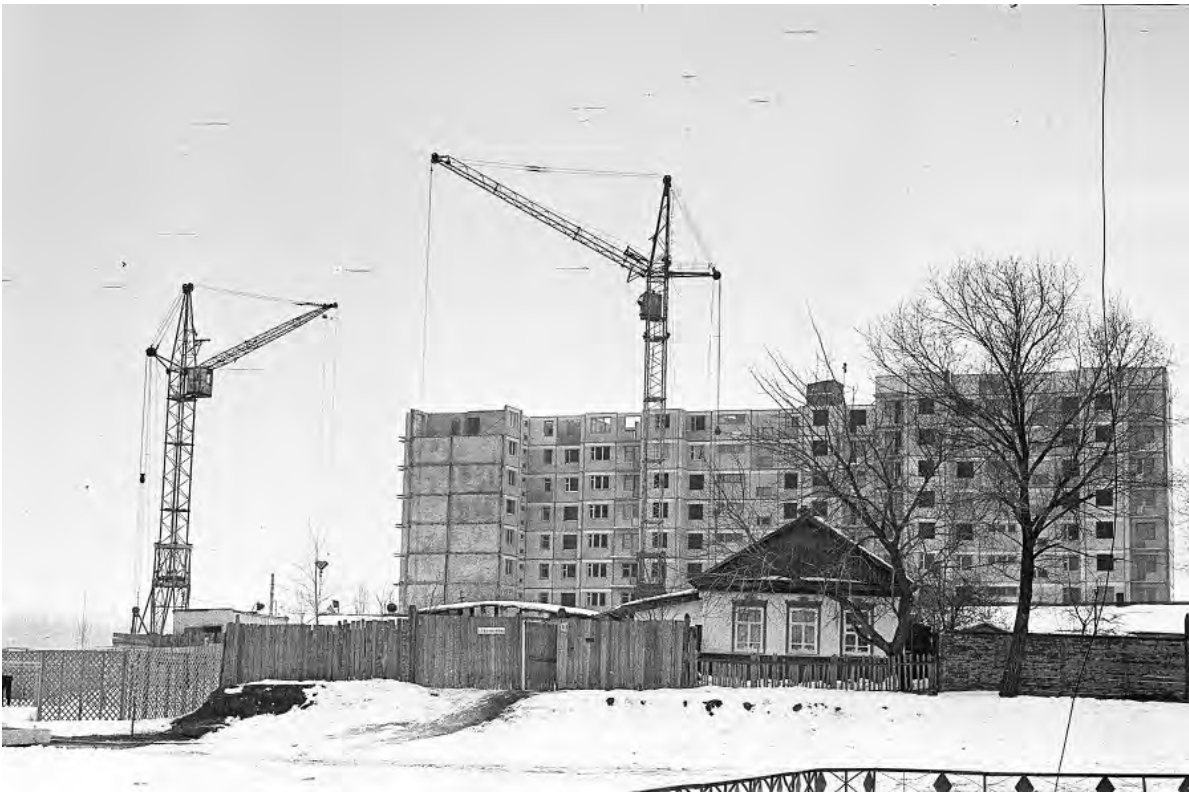
Переулок Головачёва в 1980-е гг.