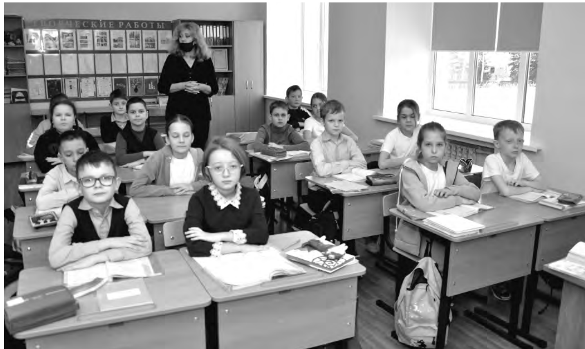
Ученики начальных классов рады вернуться в родные кабинеты.

Обновлённые коридоры и классные комнаты стали просторнее, привлекательнее и светлее.