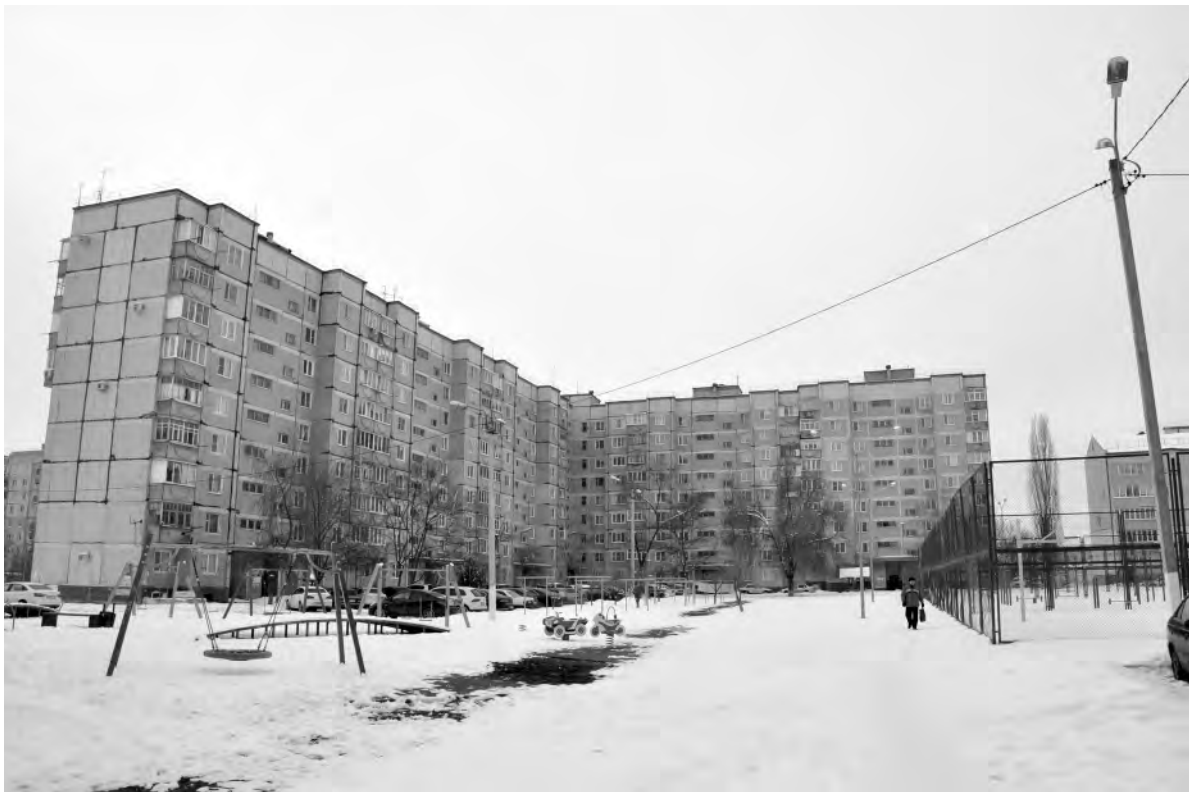
Это же место в настоящее время.