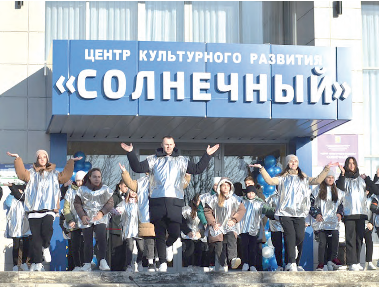
Танец на свежем воздухе в день открытия «Солнечного» после капитального ремонта.