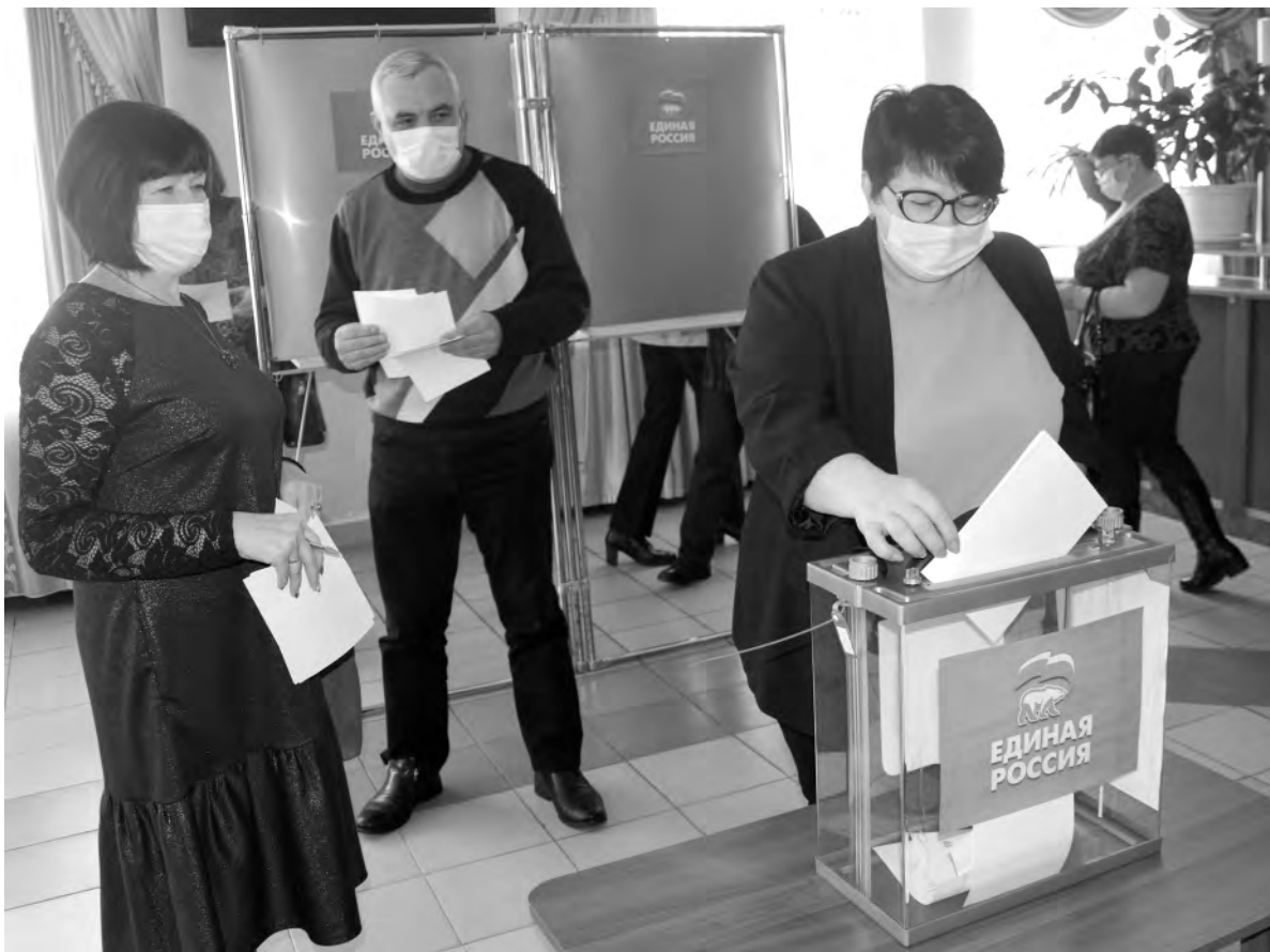
Момент тайного голосования.