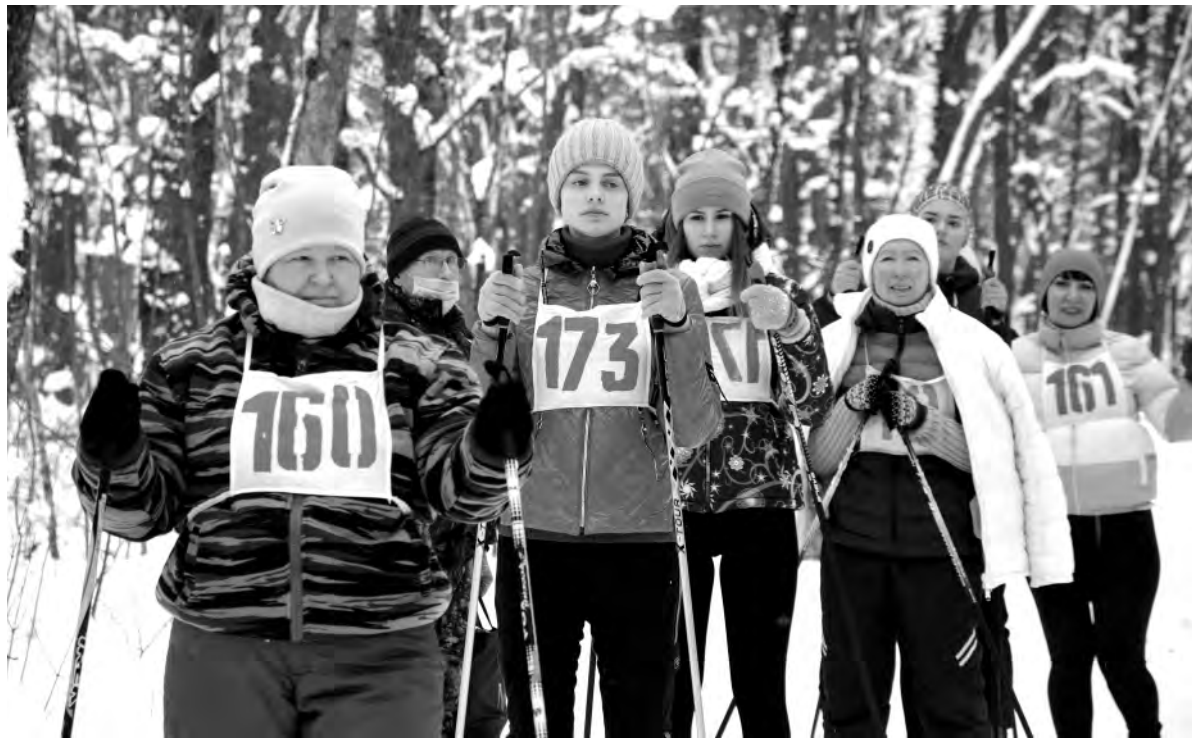
На дистанцию вышли представительницы сельских поселений и организаций района.

Спортсменам предстояло преодолеть дистанции в 1000 и 2000 метров. Первыми масс-старт начали школьники 5-6 классов. Через несколько минут секундомер судей фиксирует первые результаты бегунов. Для многих ребят такие соревнования уже знакомы, а кто-то