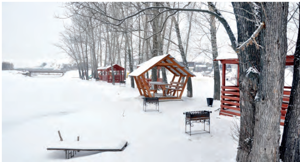
Набережная вдоль Тихой Сосны в ожидании тепла.

Татьяна ДЕВИЦЫНА.