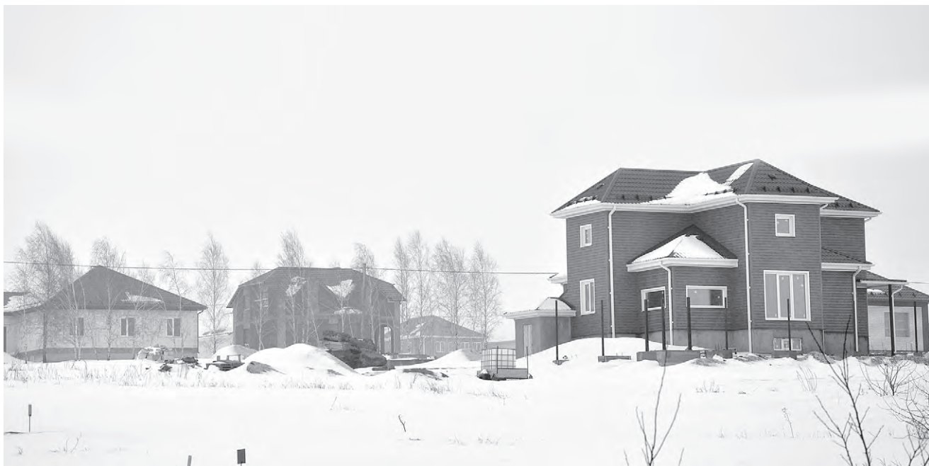
Так выглядят новостройки в микрорайоне «Крылатский».