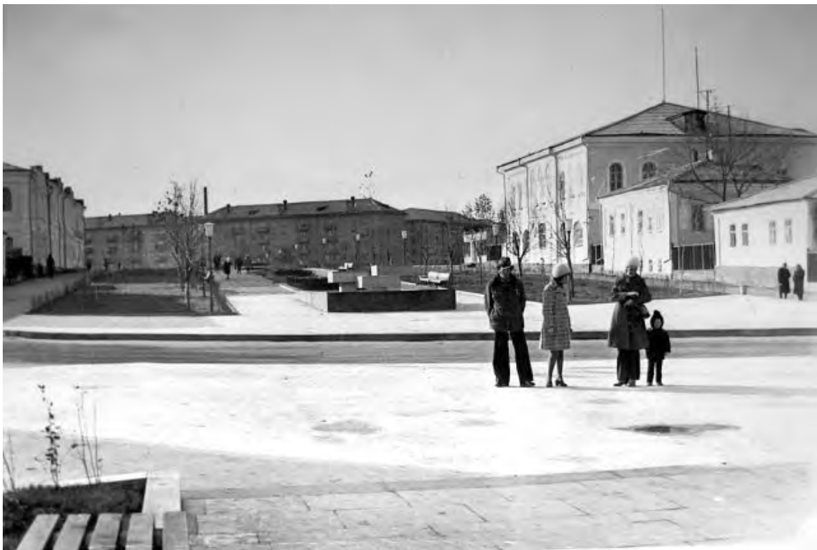
Пересечение улиц Гагарина и Карла Маркса (ныне Мостовой). Конец 1970-х гг.