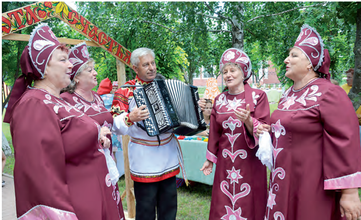
Фестиваль украсило выступление вокального ансамбля «Судьба» Иловского Центра культурного развития.

различных самоваров. Самому старому экспонату, жаровому тульскому, без малого 200 лет. Желающих сфотографироваться на память с бытовым раритетом было много.