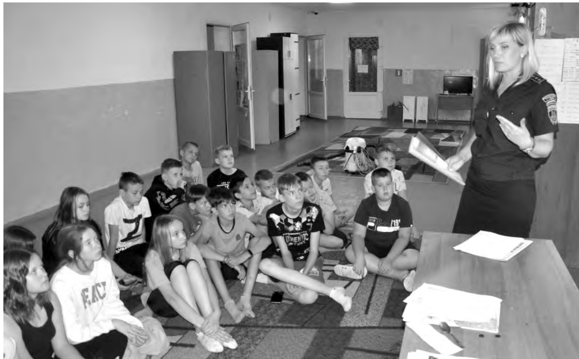
Экологический урок в летнем лагере «Солнышко».

Вячеслав ГЛАДКОВ, губернатор Белгородской области.