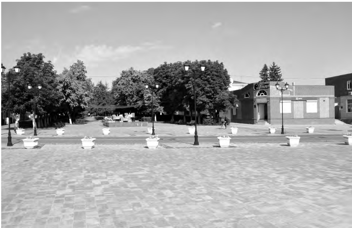
Это же место в настоящее время.