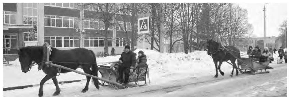
По русской традиции. (с. Красное).