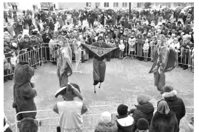
Ходулисты привлекали к себе повышенный интерес алеевцев.