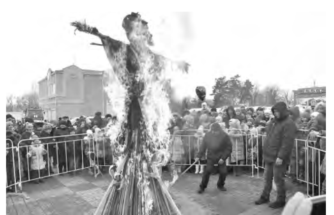
Гори, зима! Наступай, весна! — сжигание чучела на центральной площади города.