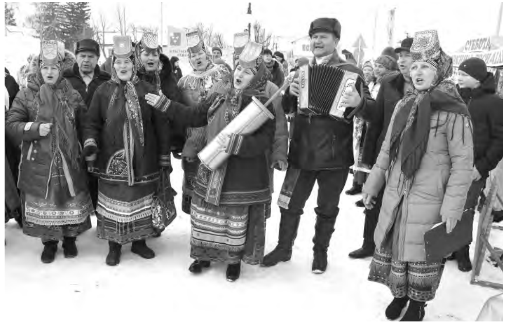
Душа поёт и веселится. (с. Красное).