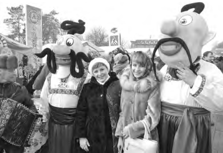
Любой желающий мог сделать фото на память со сказочными персонажами на празднике в городе на Тихой Сосне.