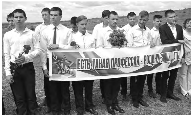
Патриотически настроенные студенты Алексеевского агротехнического техникума на церемонии открытия мемориальной доски.