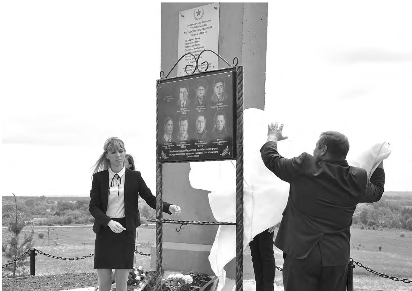
Портреты марьевских бойцов-истребителей дополнили мемориальный комплекс.