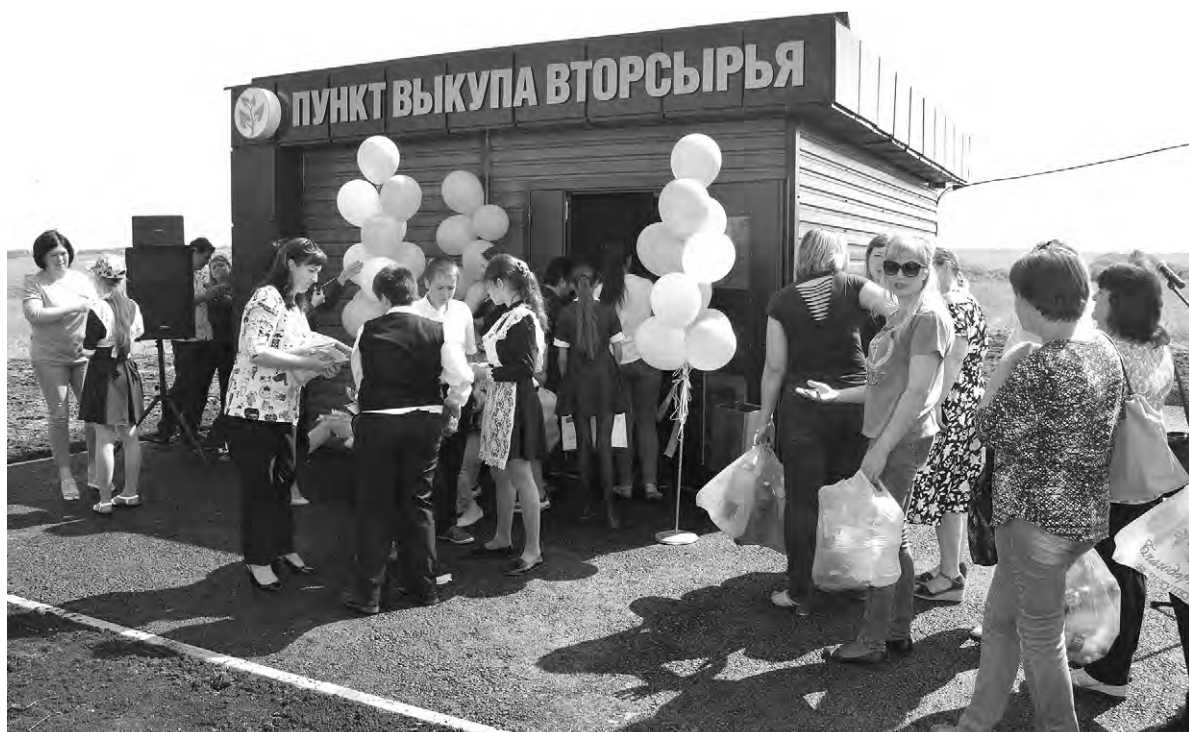
Желающих сдать вторсырьё в тот день набралось немало.