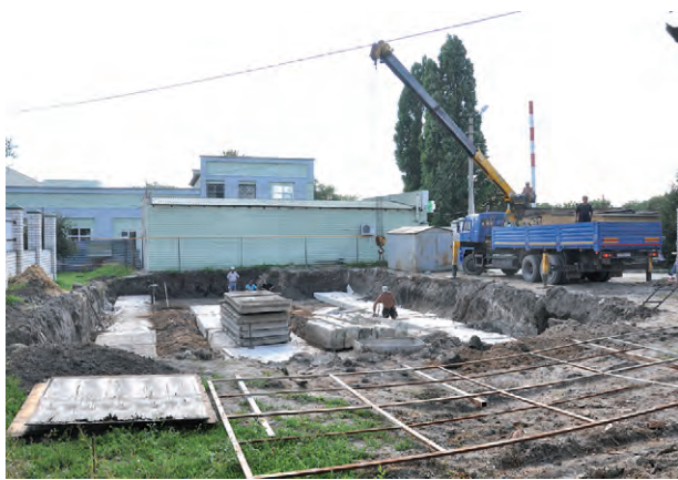
Соб. инф.

Строительство объекта поможет снизить нагрузку на медучреждение, создать более комфортные условия для посетителей и наверняка украсит эту часть города. Оно ведётся за счёт собственных средств, а ввод в эксплуатацию намечен к 1 сентября 2020 года.