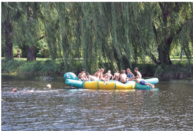
Большой матрас-черепаха вместили много детей.