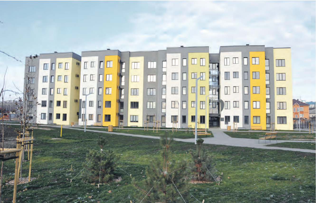
В доме, построенном в рамках областного проекта, находится 78 квартир для молодых алексеевцев.