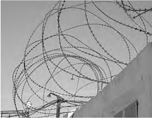
Убежать отсюда практически невозможно.

ны из металла, обшиты деревом и являются собой цельную конструкцию. Следует заметить, что всё, чем укомплектована эта «жилплощадь», крепко приковано к полу.