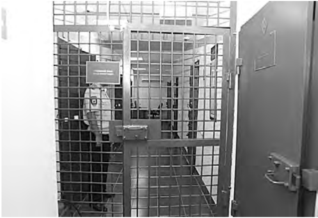
В изоляторе всюду надёжные запоры.

Временное жильё для «спецконтингента» снабжено минимальным запасом удобств. Для каждого человека отведено индивидуальное спальное место. Сверху светит лампочка, окно — под самым потолком. На стене — вешалка для личных вещей. В углу находится туалет, который отгорожен невысокой заслонкой, напротив — умывальник, стол для приёма пищи и лавочка в виде буквы «П». Последние сдела-