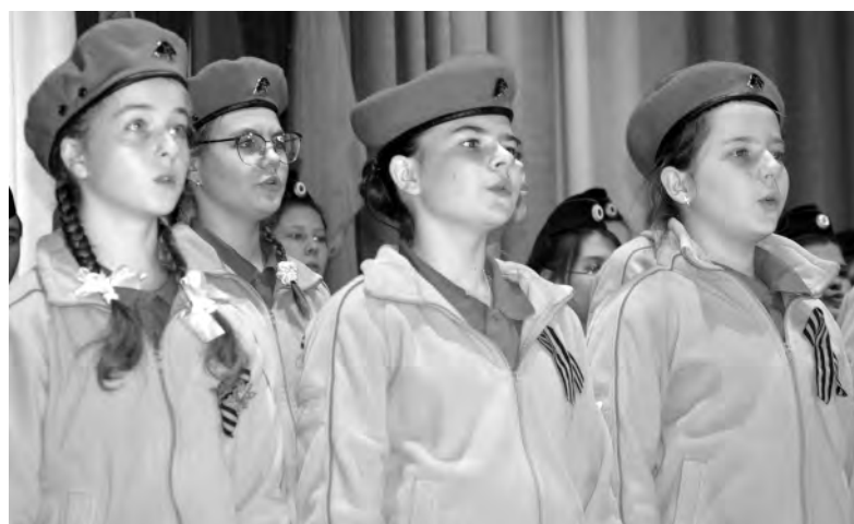
Юнармейцы Красненской средней школы — новое поколение патриотов.