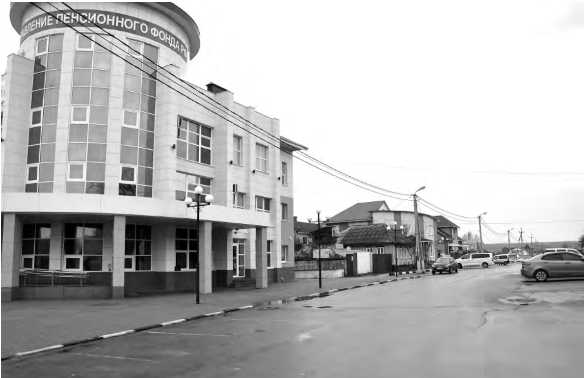
Это же место сейчас.