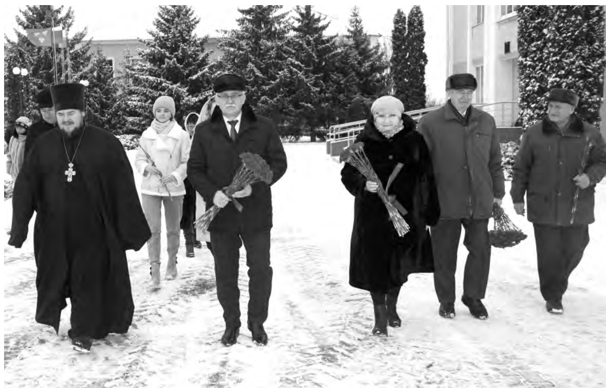
День Героев Отечества в Красном начался с возложения цветов к братскому захоронению.