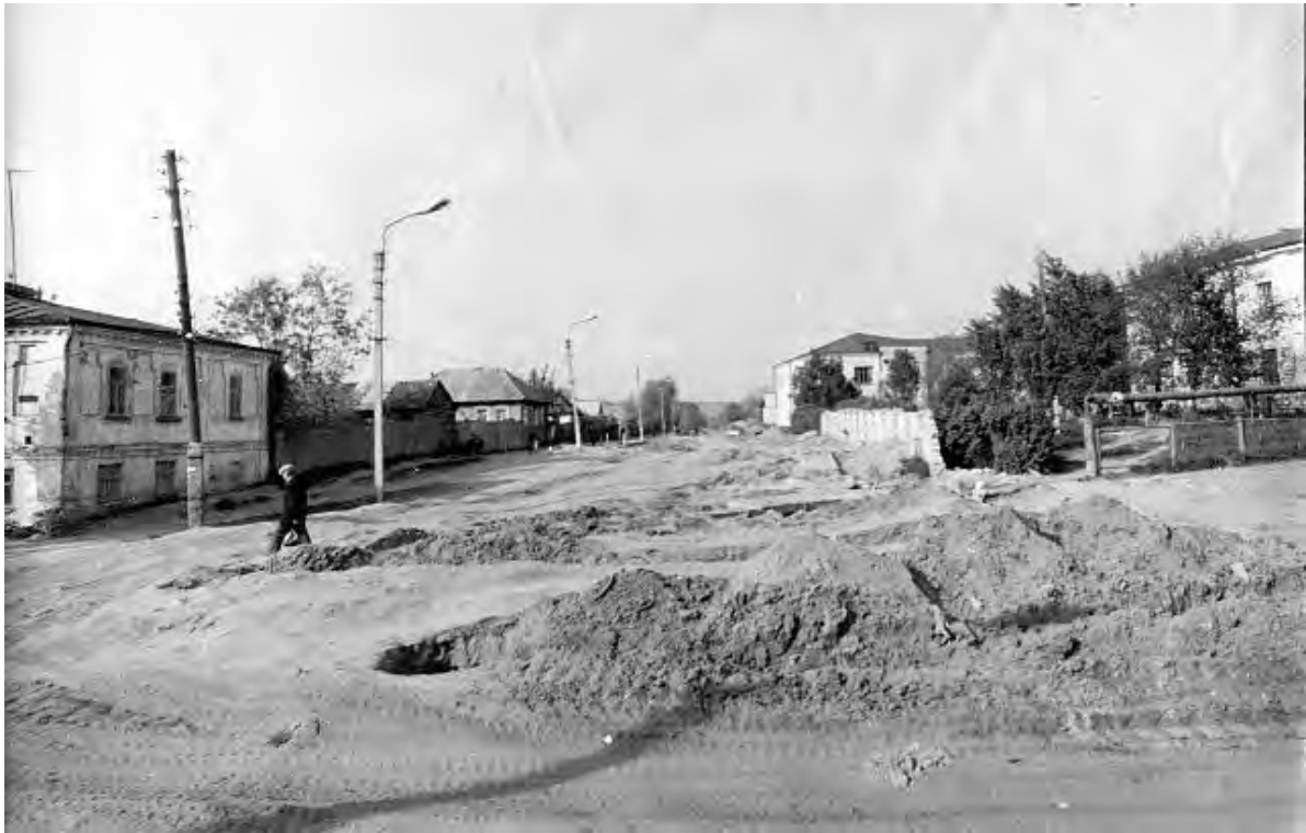
Ул. Никольская (Плеханова). 1980-е годы.