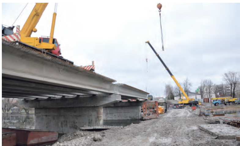
Основа моста — опоры, ригели и балки.