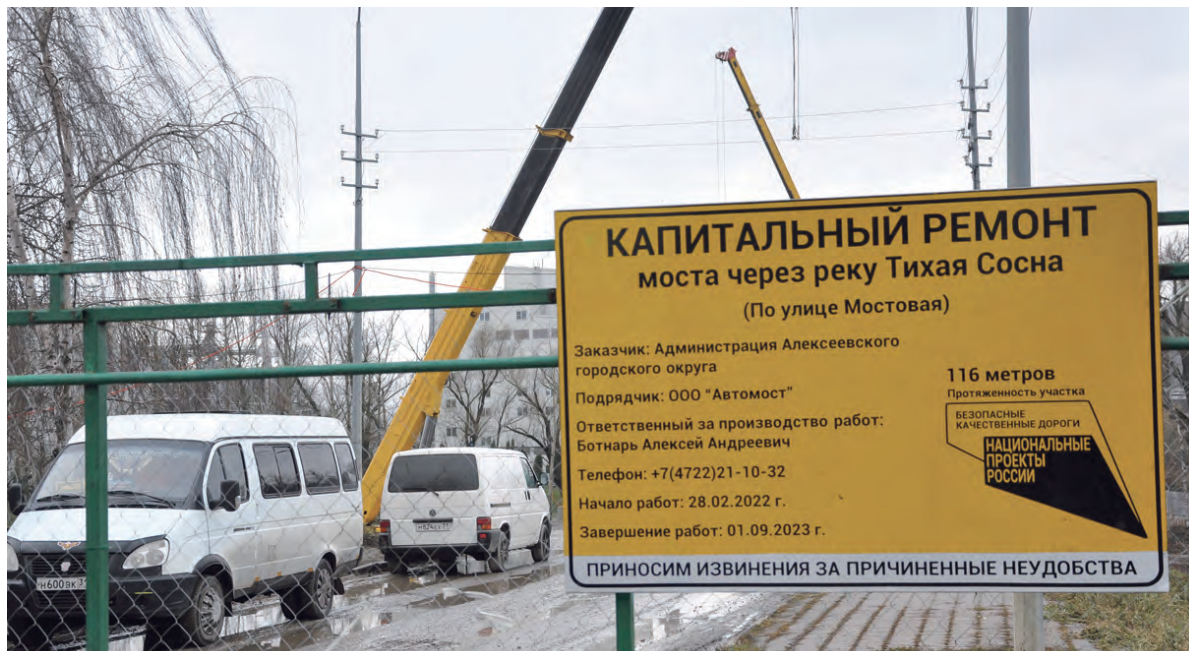
На стенде — всё об условиях ремонта.