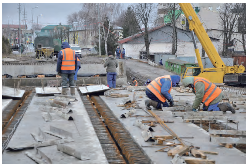
Монтажники за работой.