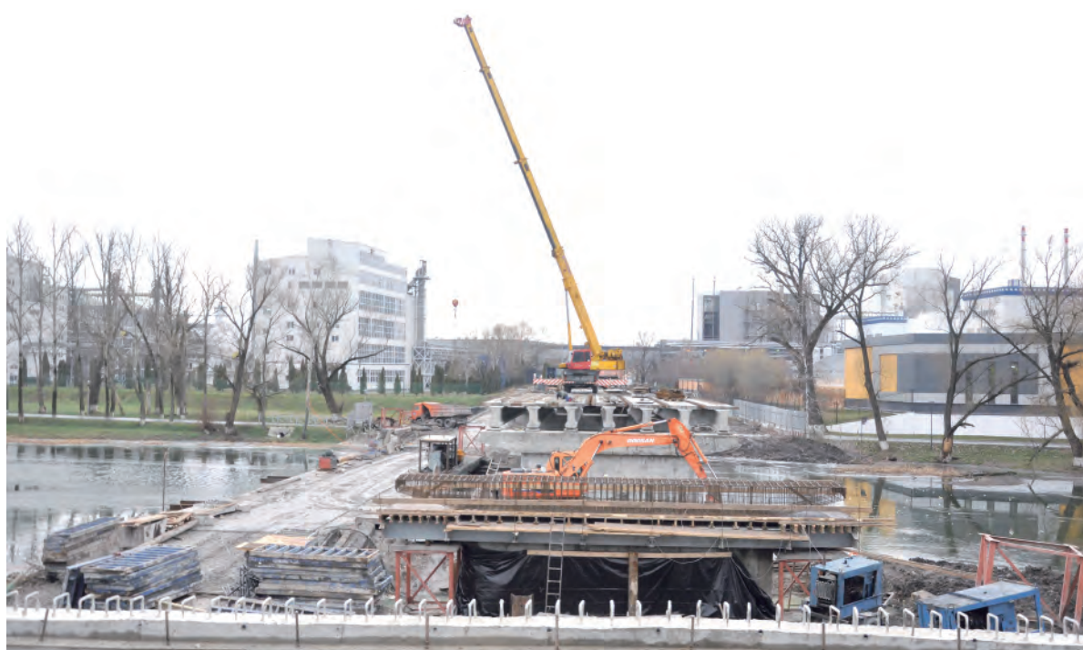
Вид на участок, где будут уложены балки четвёртого пролёта.

Заря Учредители: министерство общественных коммуникаций Белгородской области; администрация Алексеевского городского округа, администрация Красненского района Белгородской области, Совет депутатов Алексеевского городского округа Белгородской области, муниципальной совет муниципального района «Красненский район», АНО «Редакция газеты «Заря».