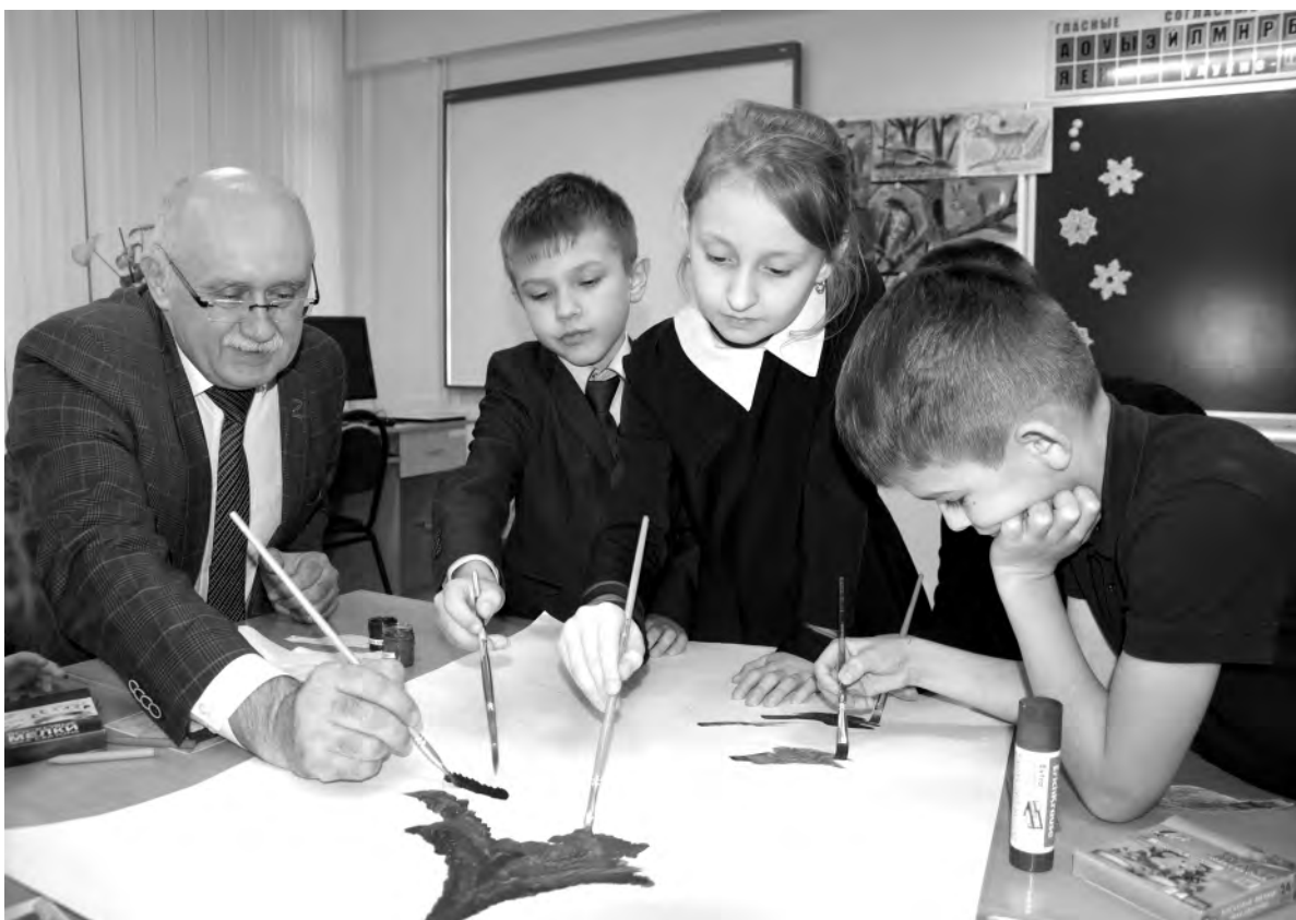
Приятные минуты в окружении детей.