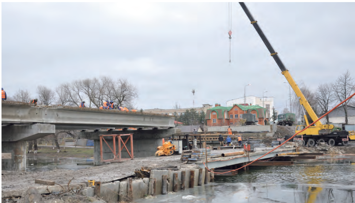
Временный технологический мост (на первом плане) будет убран перед сдачей моста в эксплуатацию.

Центральный железобетонный мост через Тихую Сосну, вместо часто разрушаемого полководцем деревянного, был построен в 1967 году. Его соорудил Киевский мостостроительный поезд № 500. Инициативу проявил и большую помощь в возведении переправы оказал видный политический и государственный деятель, уроженец Алексеевки Андрей Павлович Кириленко.