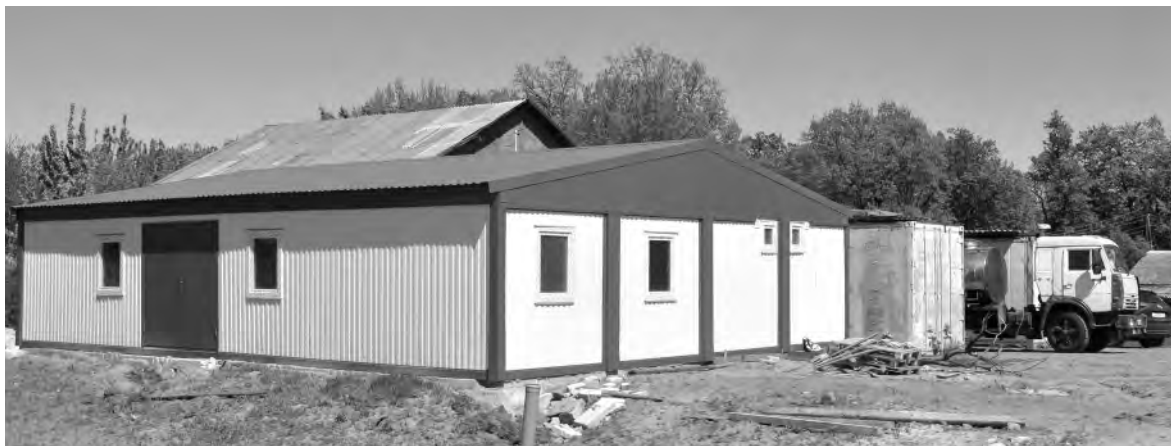
Скоро в цехе по выработке сыра установят оборудование.