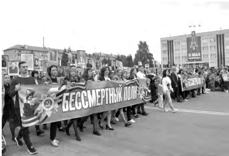
Тысячи алексеевцев встали в строй «Бессмертного полка».