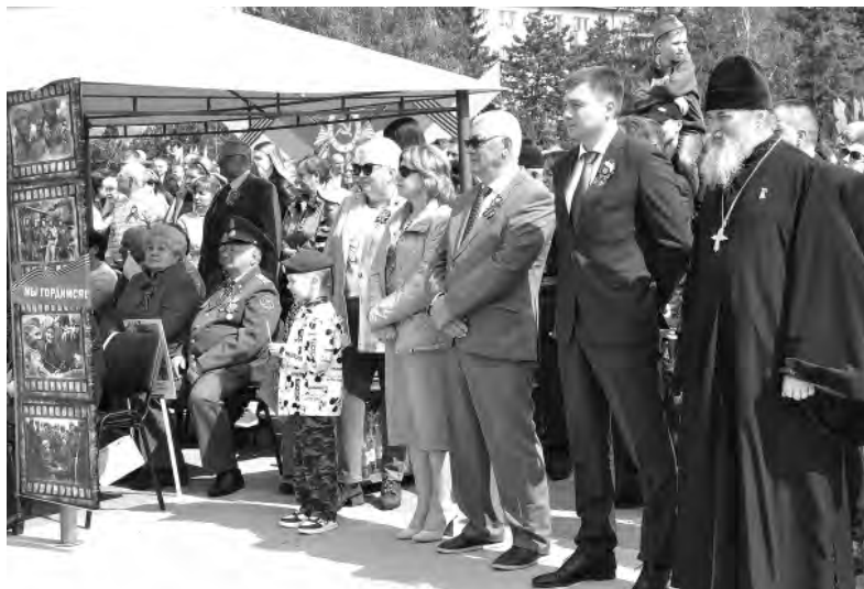
Официальные лица, приглашённые и многочисленные зрители стали свидетелями яркой культурной программы на главной площади Алексеевки.