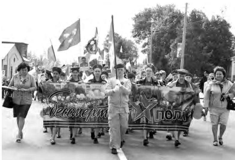
В акции «Бессмертный полк» приняли участие 1200 красненцев.