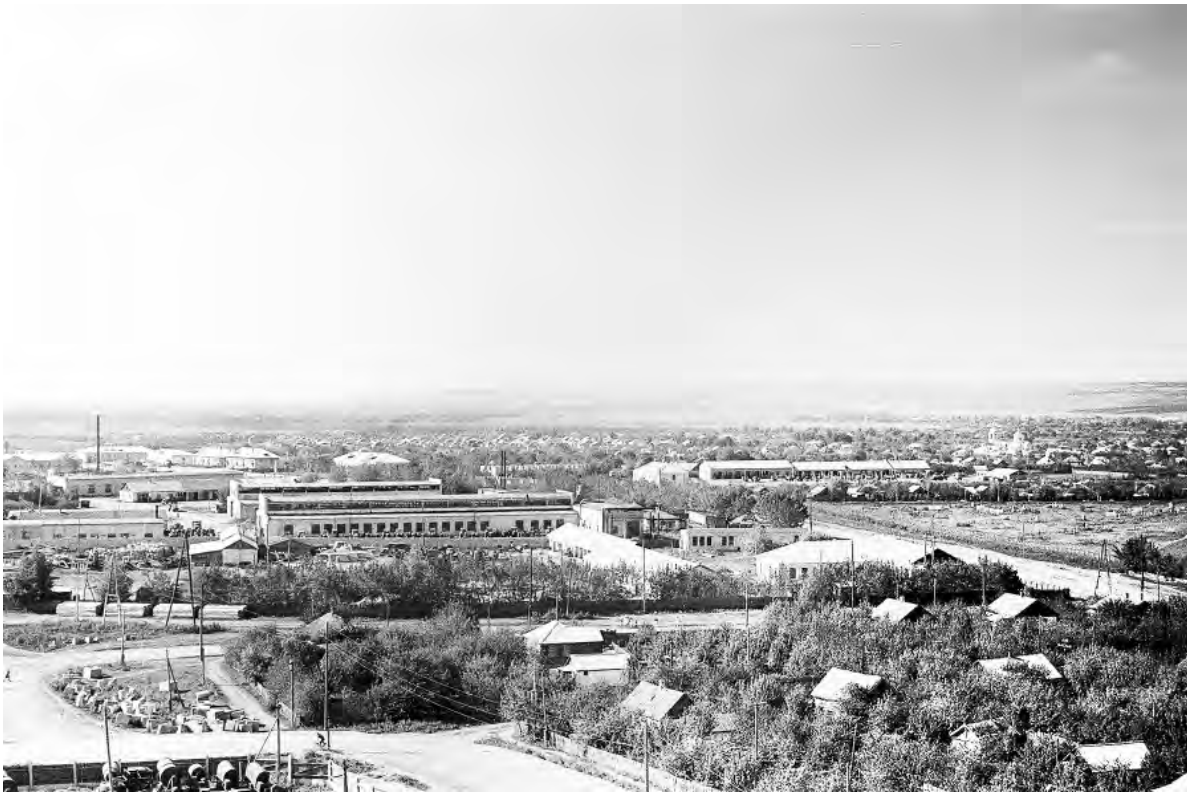
Вид с высоты здания «Элеватора». 1970-е гг.