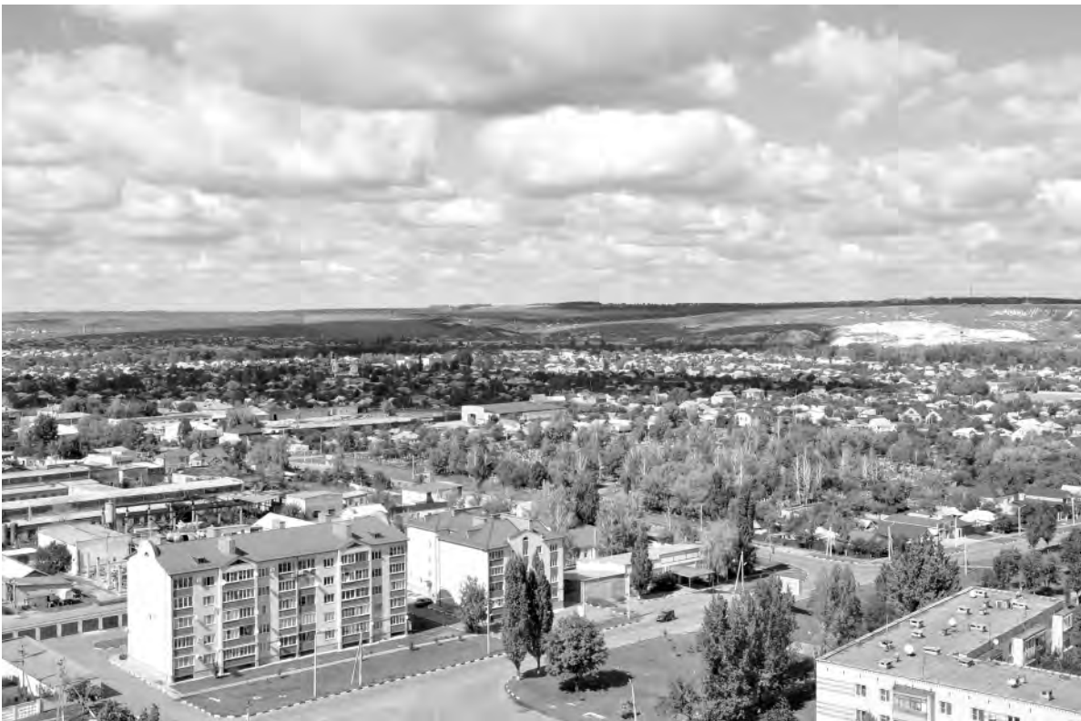
Это же место. 2016-й год.