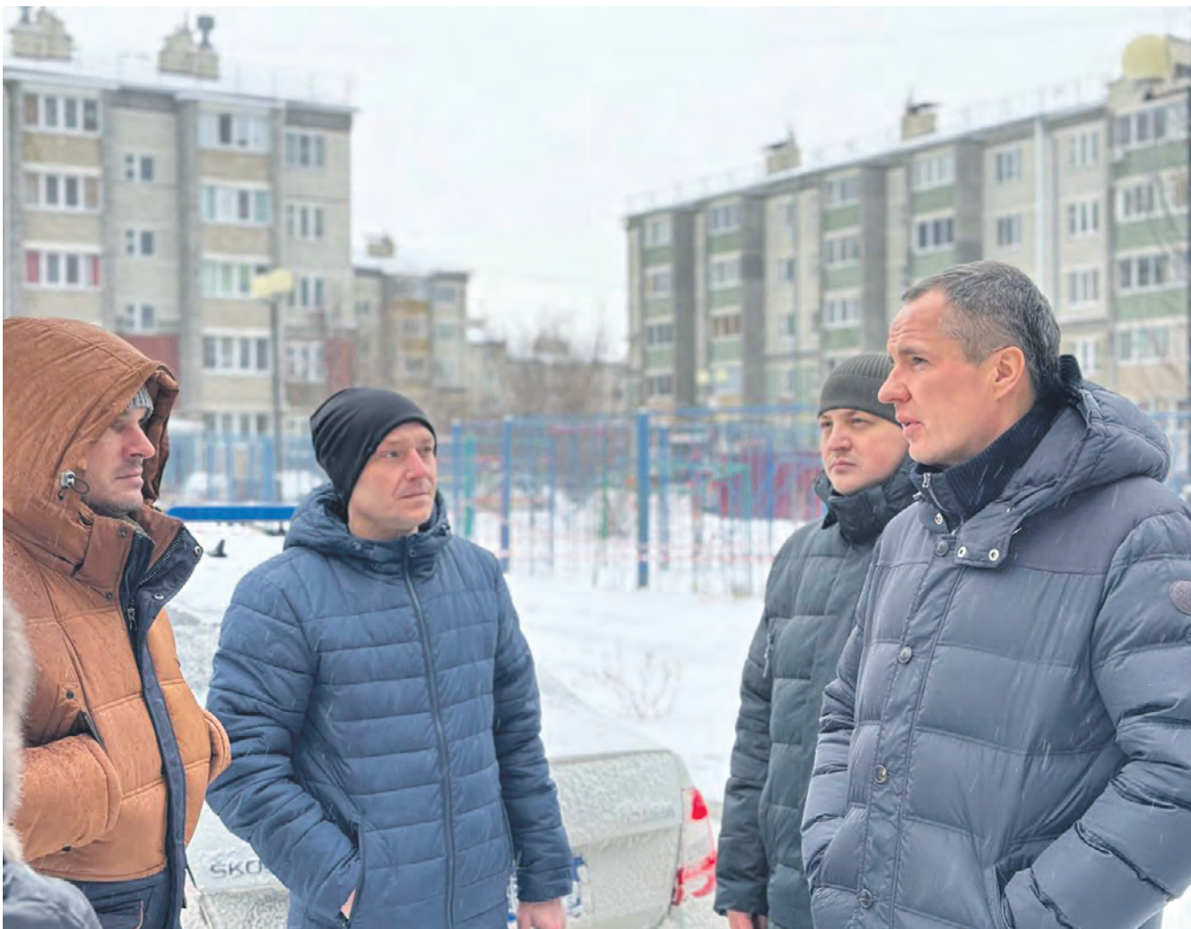
Губернатор Вячеслав Гладков проверяет ход восстановительных работ в Белгороде.