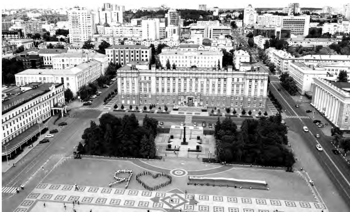
Соборная площадь столицы Белогорья сейчас.

Творческую жизнь театр начал 7 ноября спектаклем «Сильные духом» по книге Д. Медведева «Это было под Ровно». В постановке участвовали актёры, приехавшие из разных городов страны. Имя М. С. Щепкина театру присвоено в 1956 году.