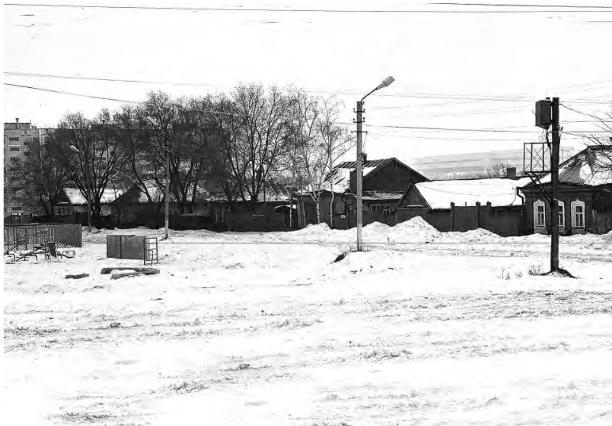
Переулок Головачёва, 1990-е годы.