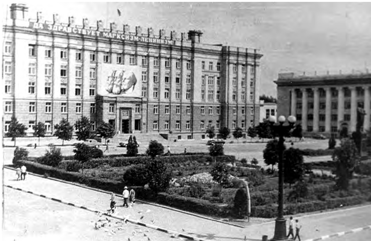
Центральная площадь Белгорода. 1950-е годы.

25 сентября принято постановление об открытии в Белгороде областного драматического театра. Он разместился в здании бывшего кинотеатра «Орион».