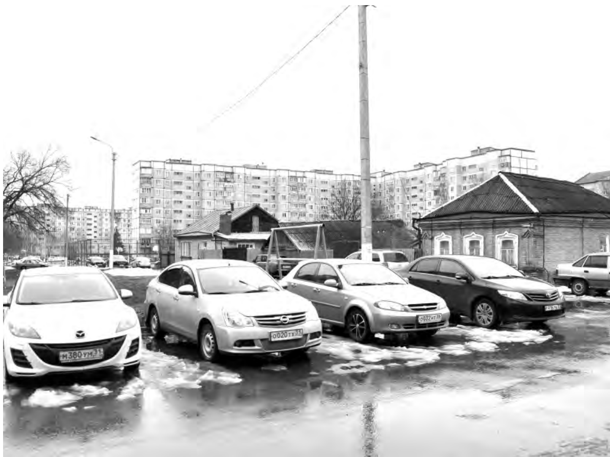
Это же место сейчас.