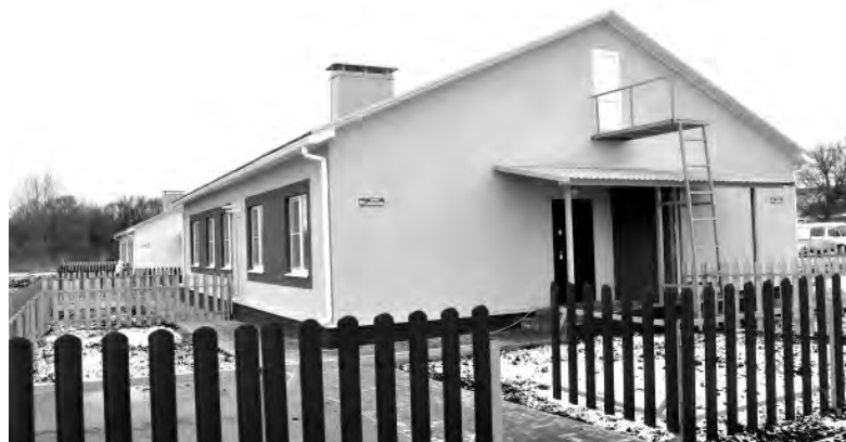
Один из домов на улице Нижней.

Анна СПЕСИВЦЕВА.