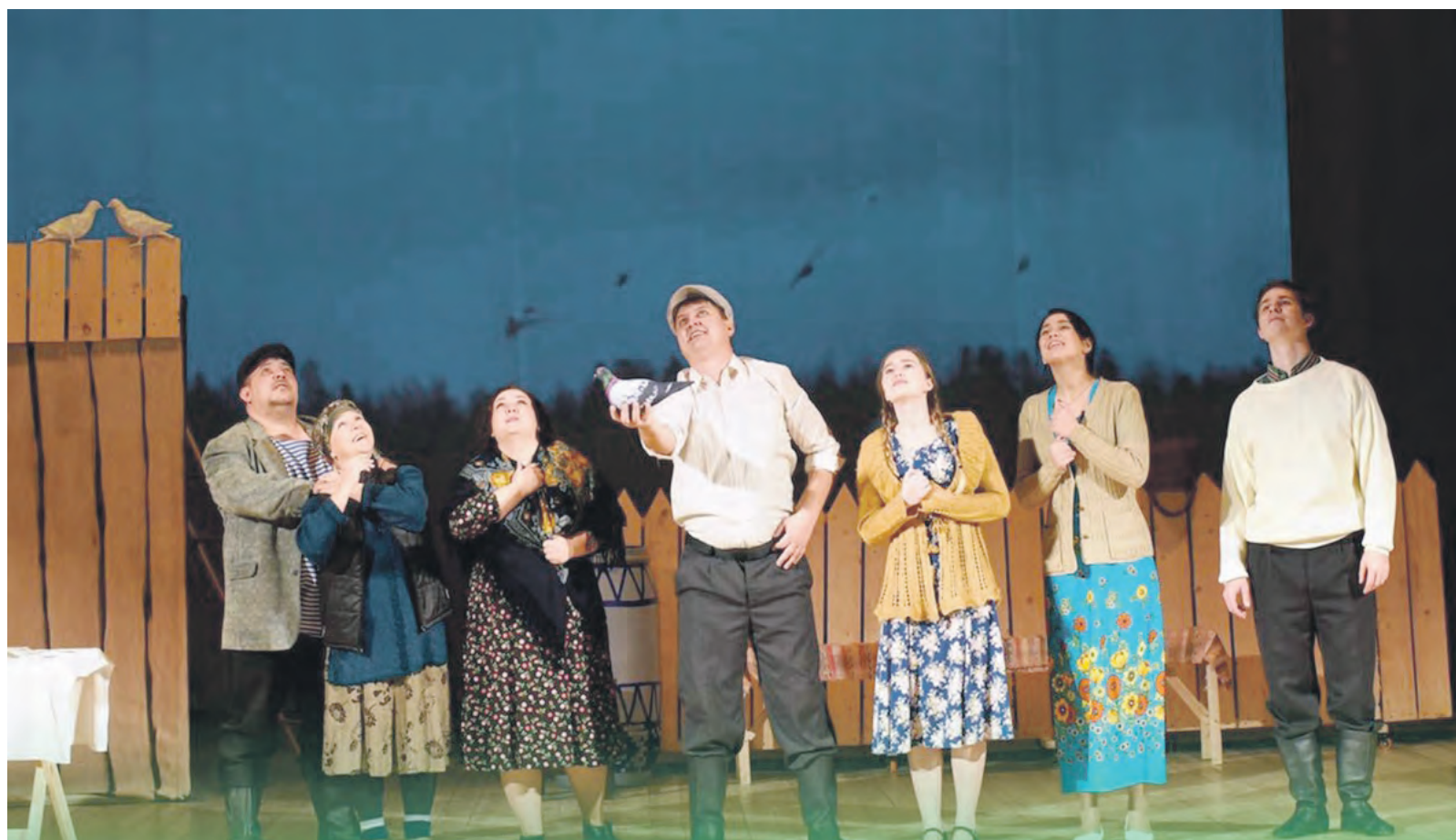
Фрагмент народной комедии «Любовь и голуби».