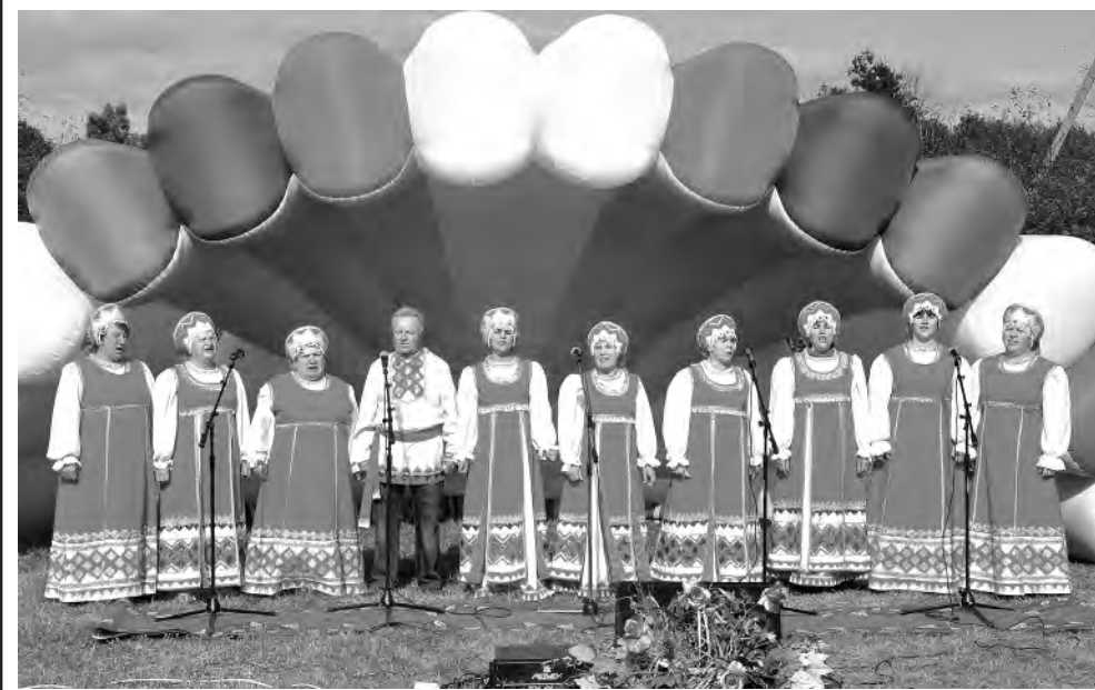
Выступает ансамбль Жуковского дома культуры.