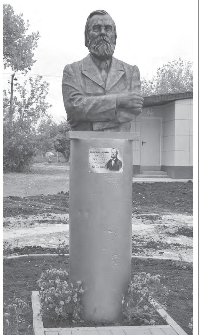
Бюст Костомарова в Юрасовке.

Установка бюста Костомарову была приурочена к 200-летию со дня его рождения. В Юрасовке он появился на свет, здесь прошли его детские годы, русско-украинское приращение повлияло на выбор исследований историка, которые одинаково близки двум