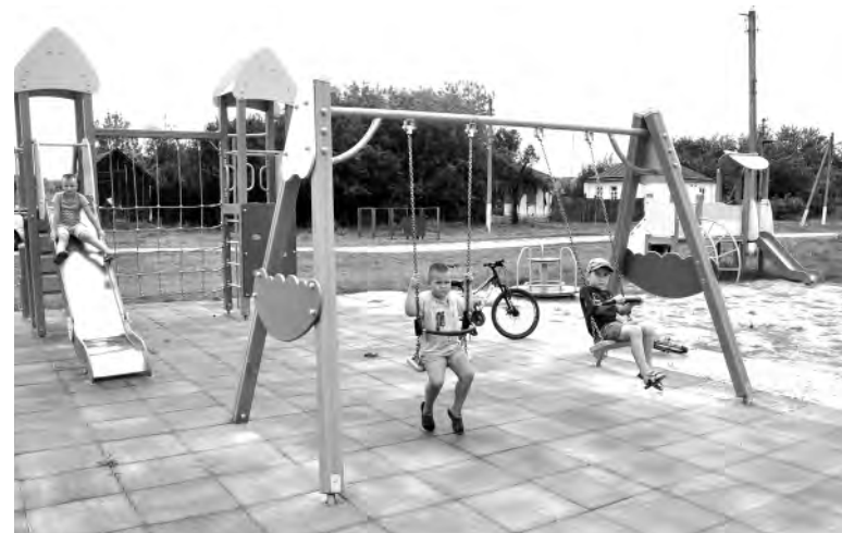
На этой площадке не бывает пусто.

Здесь не страшно взлетать «до неба» на качелях или мчаться с горки, ведь всё оборудование надёжно, а площадка оснащена травмобезопасным покрытием. Оно отвечает стандартам качества, изготовлено из экологических тканей. Даже в жару неприятного запаха не будет. Покрытие термостойкое, причём как летом, так и зимой.