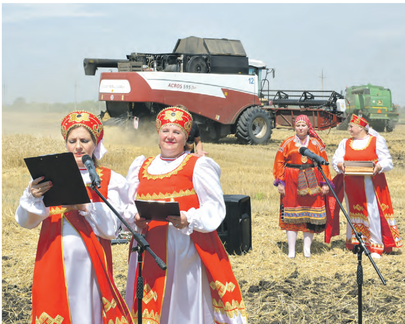
Уборка нового урожая в Красненском районе началась с праздника первого снопа и напутствия её участникам.