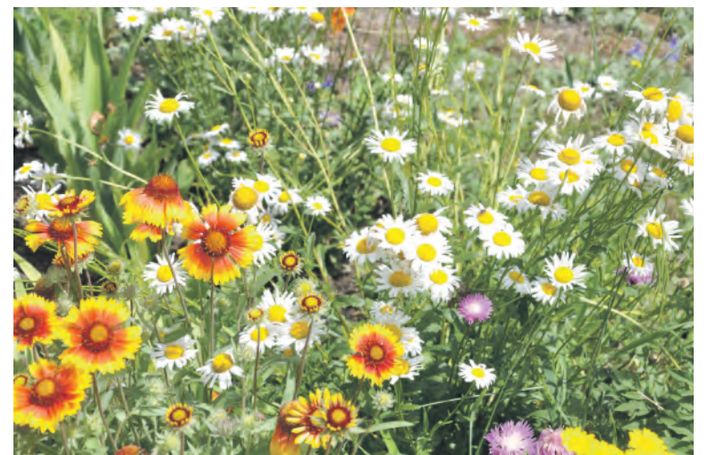
Полевые цветы — отрада для глаз.

Любовь ИВАНЕНКО. с. Калитва.