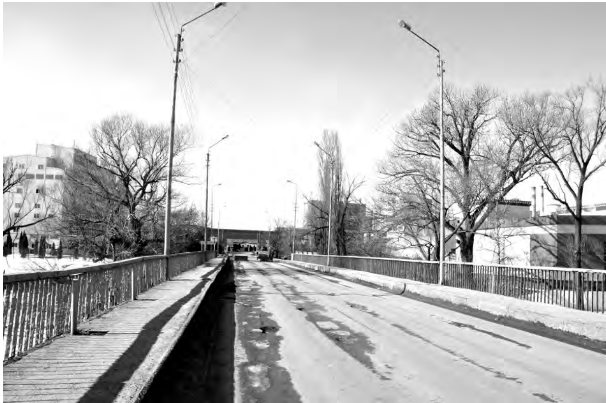
Центральный мост по улице Мостовая (К. Маркса). 2022-й год.