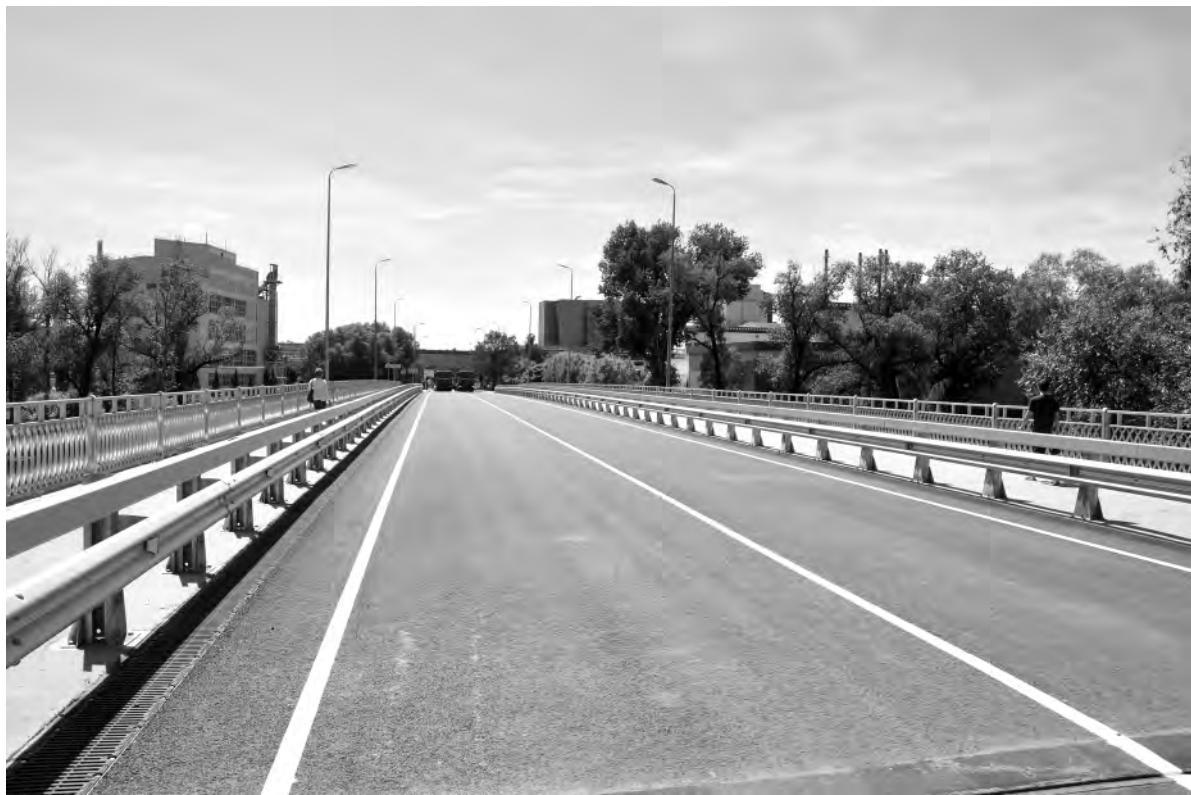
Это же место сейчас.