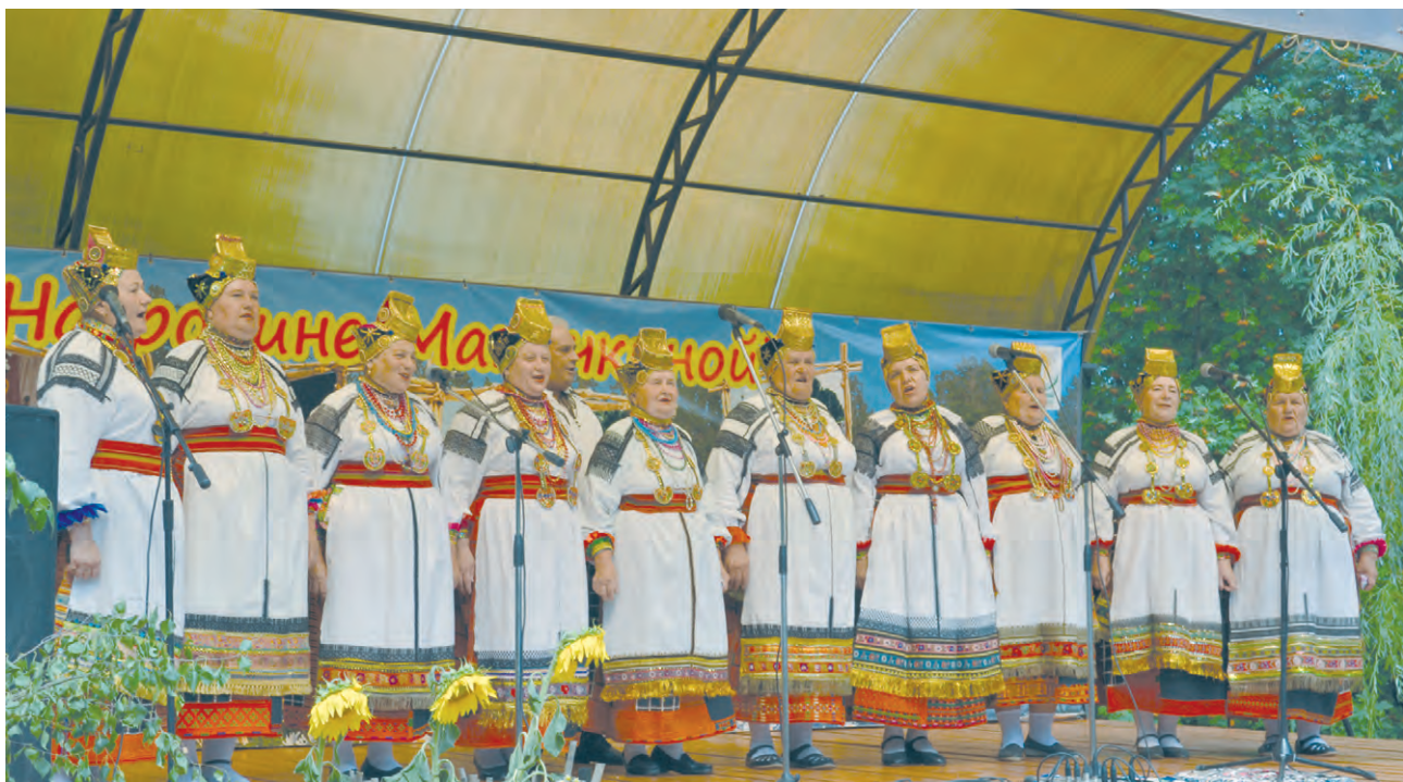
Фестивальный концерт открывает Подсердненский фольклорный ансамбль.