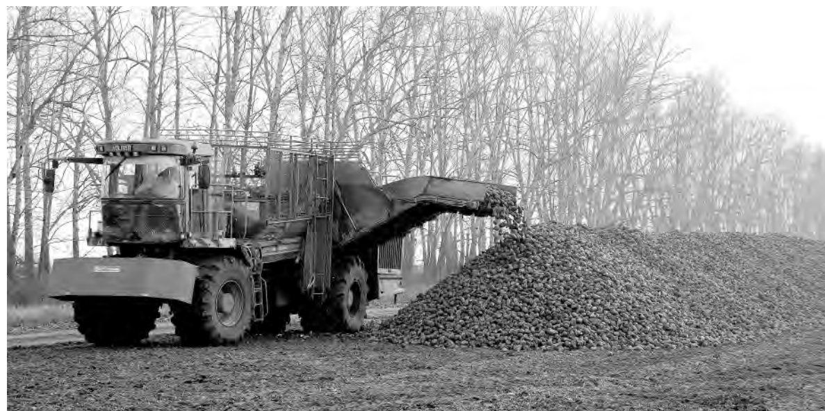
Тонны сахарной культуры до переработки легли в ровные кагаты.