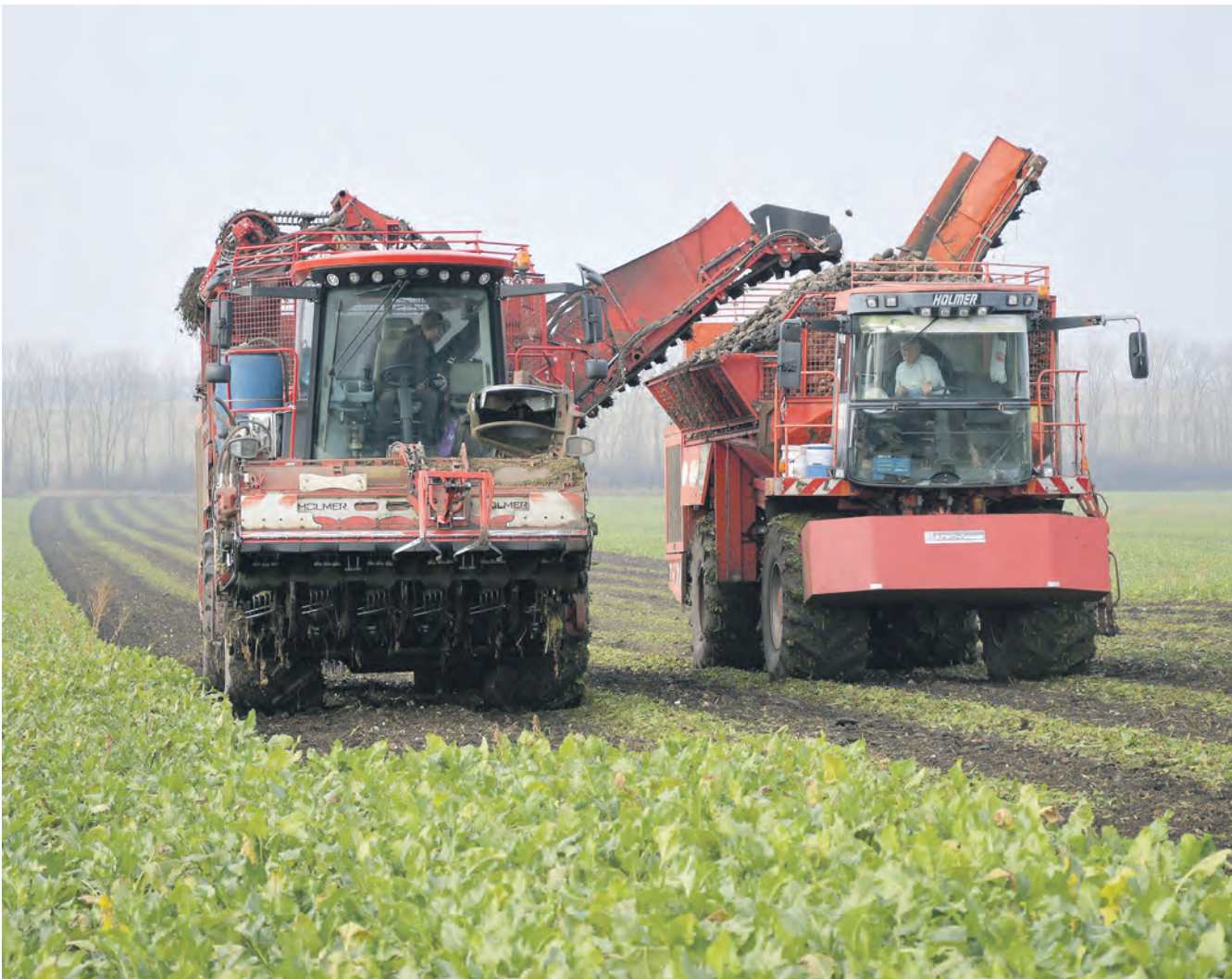
Алексеевские аграрии в целом довольны результатами уборки свёклы.