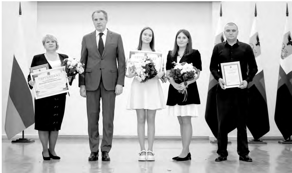
Торжественный момент награждения школьницы, её родителей и педагога.