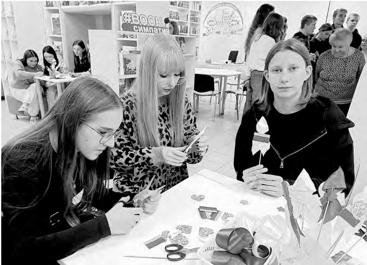
Алексеевские студенты с удовольствием посетили увлекательные мастер-классы, которые прошли в «Ночь искусств».

Путешествие в мир восточной сказки совершили посетители Афанасьевского Дома культуры. Сотрудники учреждения организовали для собравшихся видеорепортаж, который стал окном в солнечный Узбекистан. Здесь можно было попробовать на вкус традиционную узбекскую лепёшку и примерить национальный костюм этого государства.