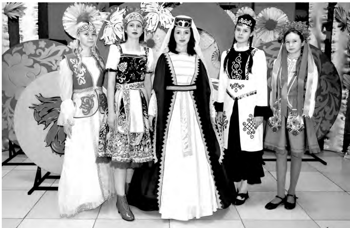
Национальные костюмы к празднику были пошиты участницами кружка кройки и шитья «Марьюшка» (руководитель Наталья Дручинина) Новоуколовского Центра культурного развития.

Подготовила Татьяна КРАСНОВА.