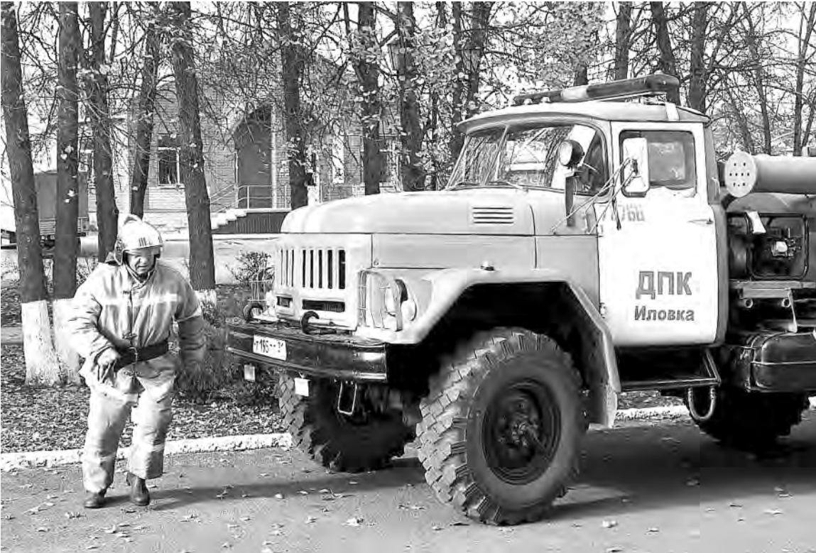
Момент тренировки при объявлении возможной ракетной опасности.