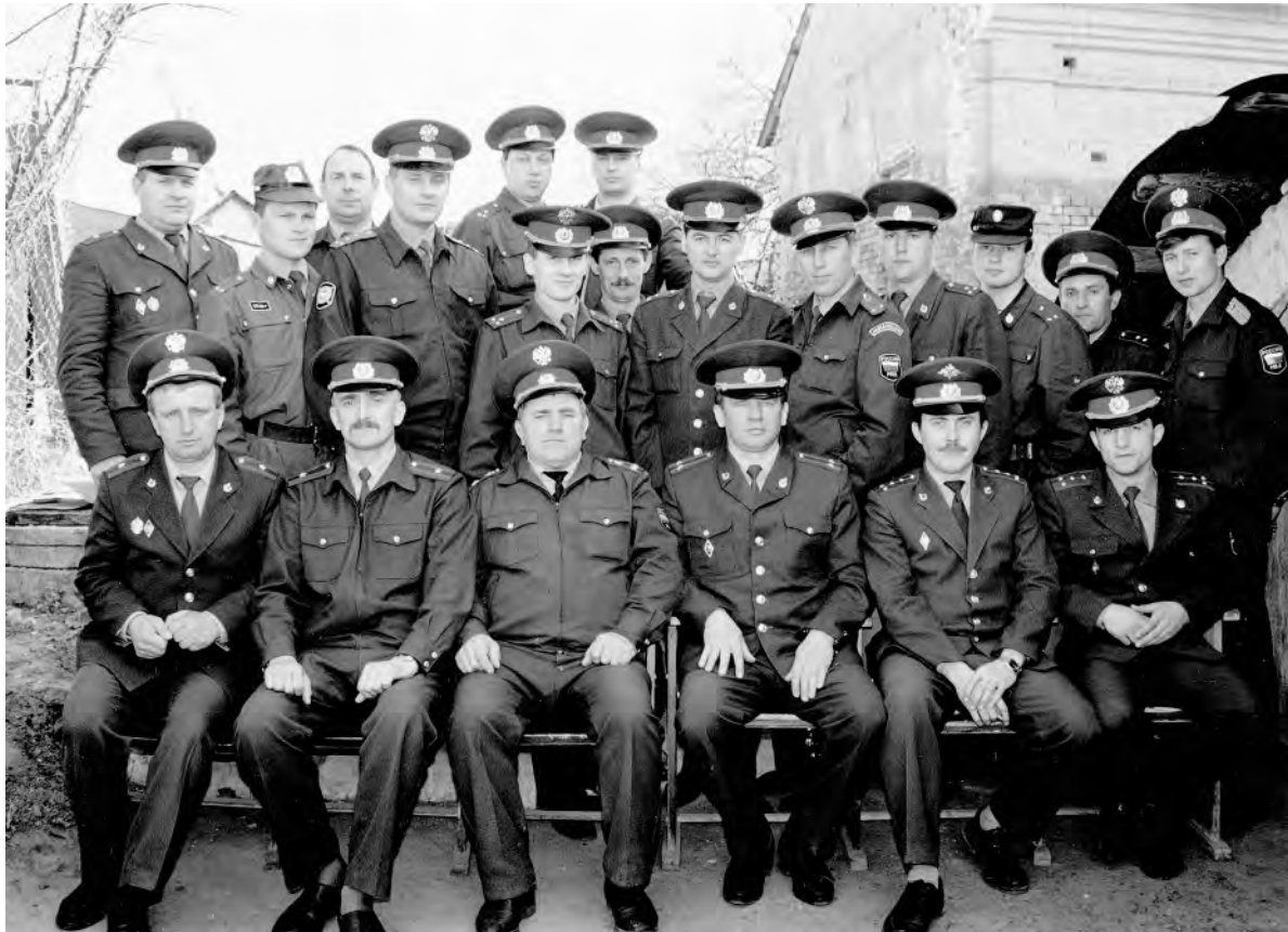
Коллектив участковых инспекторов Алексеевского ОВД, 1997 г.

Автор этих строк (третий справа в нижнем ряду) начал свою службу в должности участкового инспектора в далёкие 70-е годы прошлого столетия. В то время в штатном расписании Алексеевского ОВД было 12 участковых