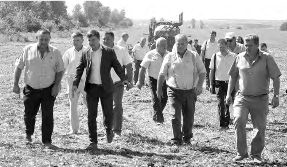
Участники семинара знакомятся с участком, удобренным животноводческими стоками.

в районе составляет более 220 гектаров. При необходимости проводилось восстановление изреженного травостоя, по мере выявления новых промоек их засевали травами. В результате последовательного претворения в жизнь таких мер в нынешнем году не составлено ни одного акта смыва плодородного слоя, тогда как два года назад их оформлено было 29.