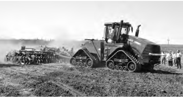
Демонстрируется работа трактора «Квадтрак» и дисковой мульчирующей бороны «Доминанта».