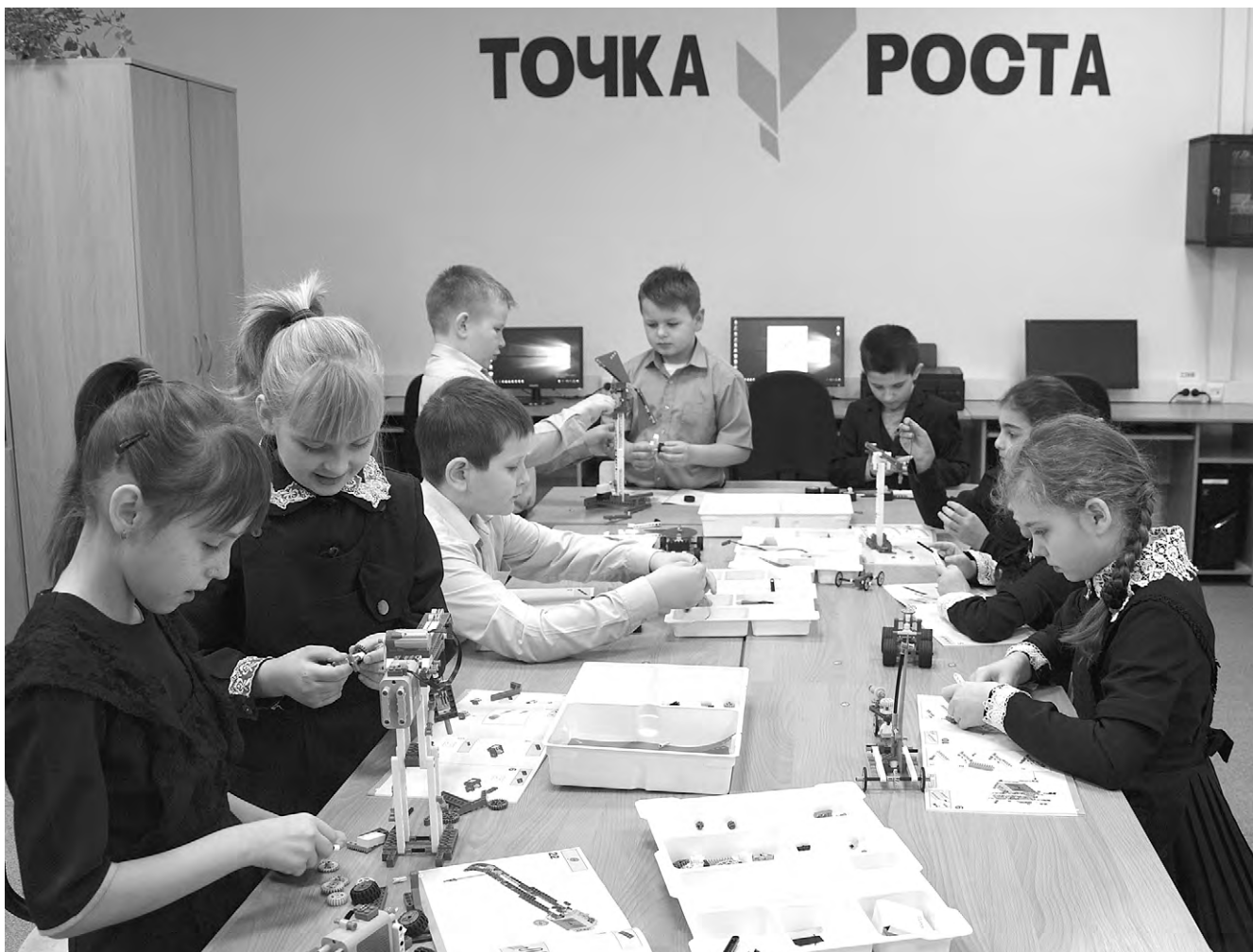
В «Точке роста» школьникам нравится учиться новому, конструировать и мастерить.