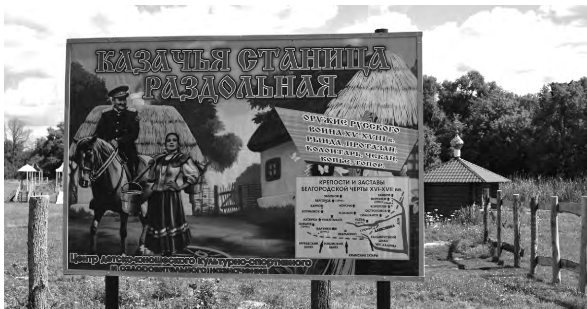
Реконструкция: вход в казачью слободу.