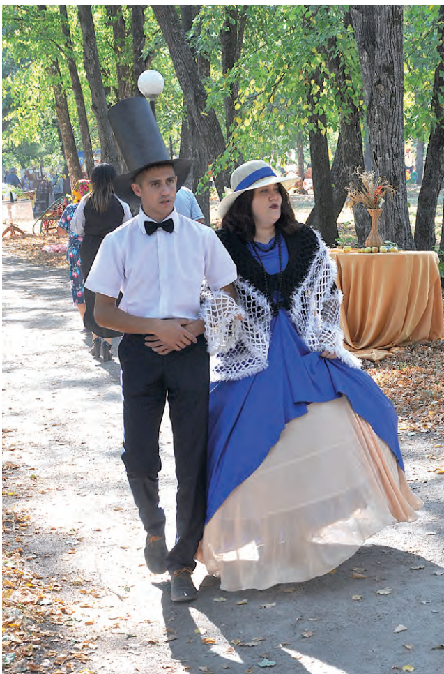
«Парочка дворян» прогуливается по липовой аллее.