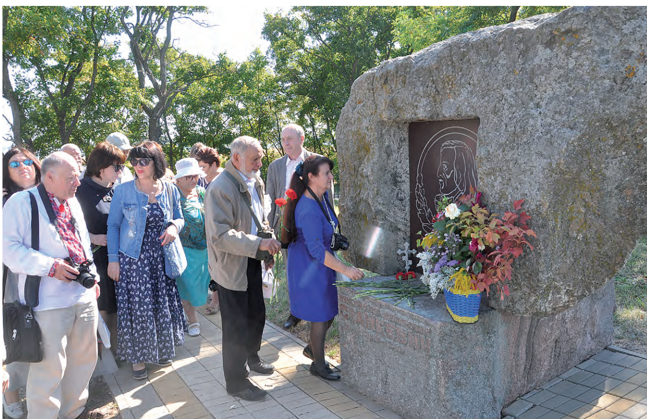
Возложение цветов к надгробью Николая Владимирович Станкевича.