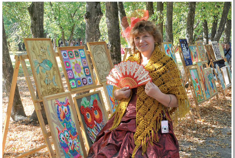
Наряд XIX века демонстрируется на фоне работ народных умельцев.