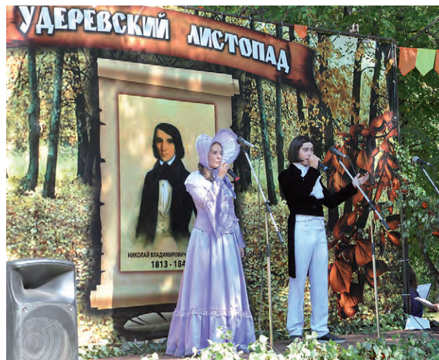
Инсценировка на главной сценической площадке.