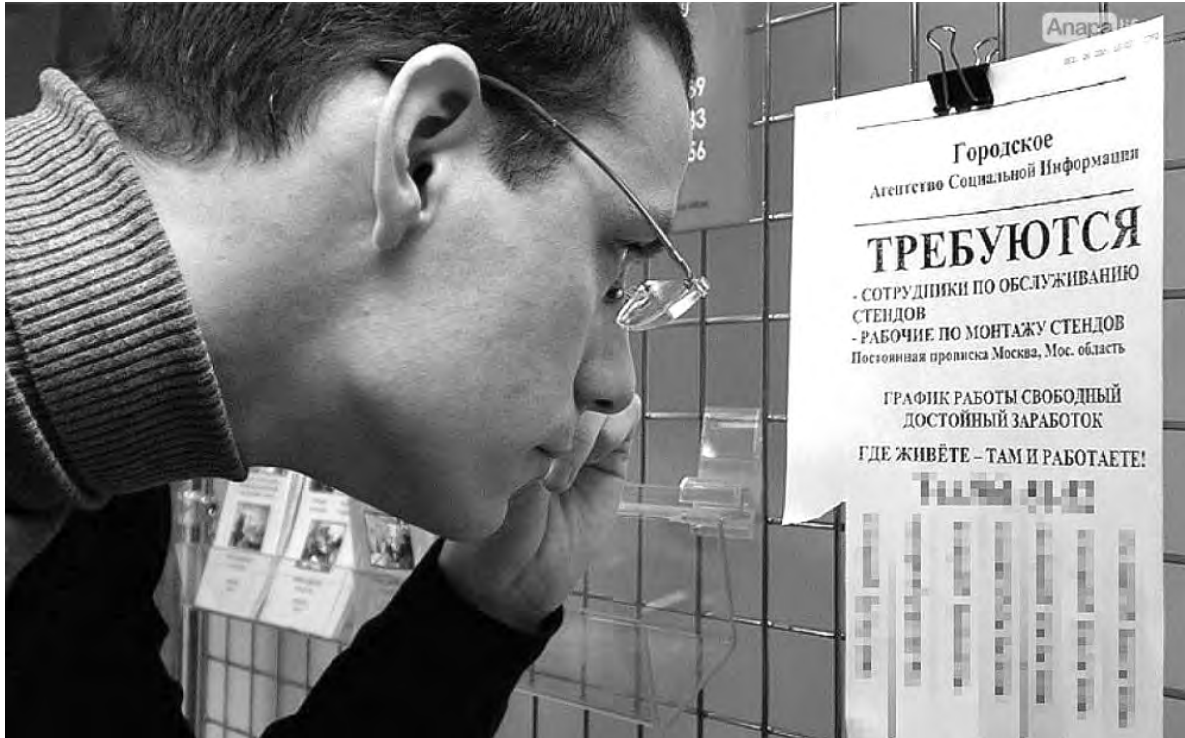
Трудоустройство — тема, которая волновала людей всегда.

Какие праздники были в пору моих детства и юности? Новый год, 23 Февраля, 8 Марта, 1 Мая, 9 Мая, 7 Ноября. Ну, и ещё несколько сугубо профессиональных. Теперь каких только нет! Вы слышали про Дни доброты, объятий, поцелуев, чая, блондинок, брюнеток, зеленоглазых, лентя и много других? Захотелось праздника — вот он! Празднуй хоть каждый день. В обычном календаре этого перечня, правда, не увидишь, но те, кто пользуется Интернетом, наверняка охотно принимают поздравительные открытки и сами отправляют их своим друзьям и знакомым, благо, поводов хватает.