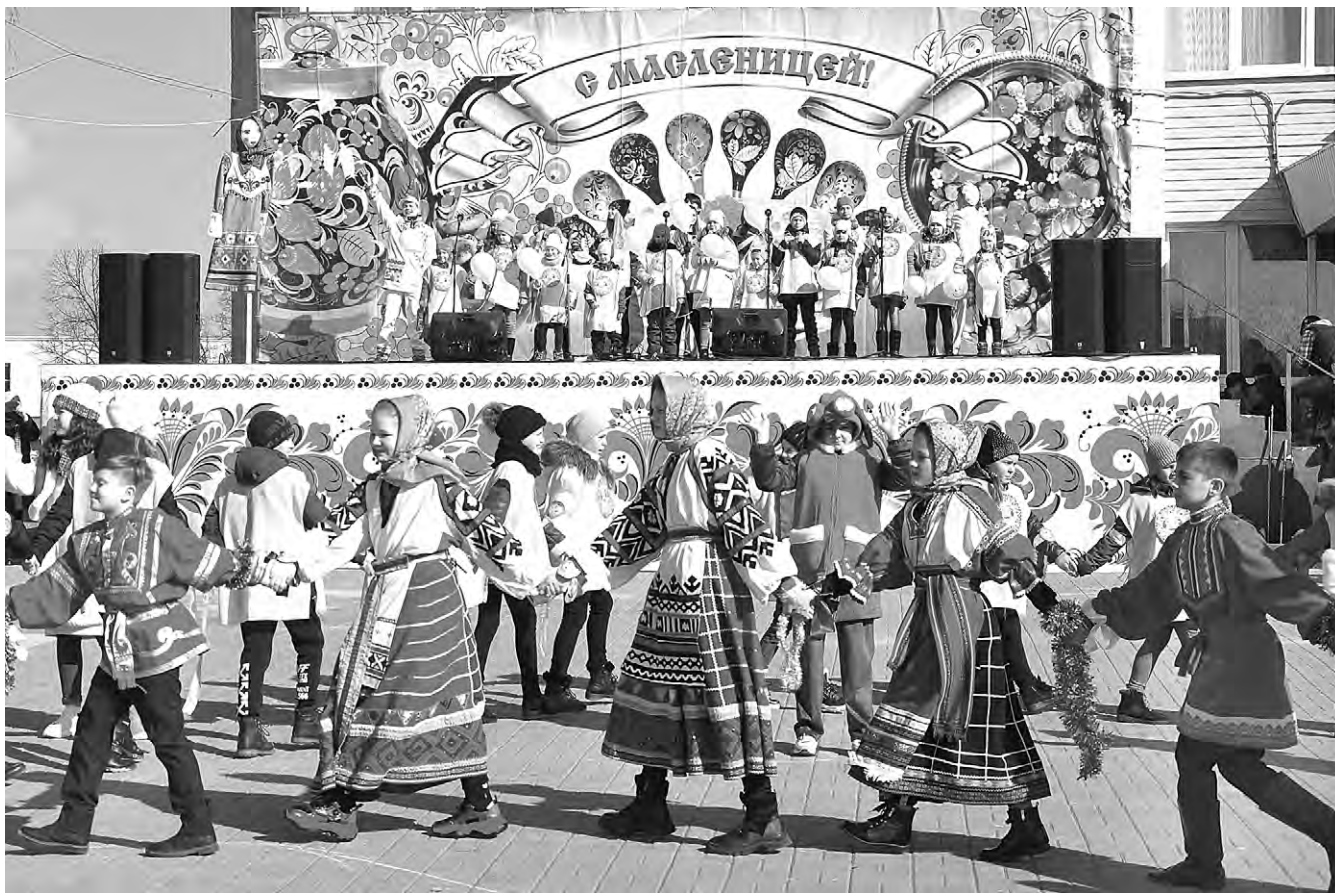
Массовая Масленица на сцене и возле неё на Центральной площади в Алексеевке.