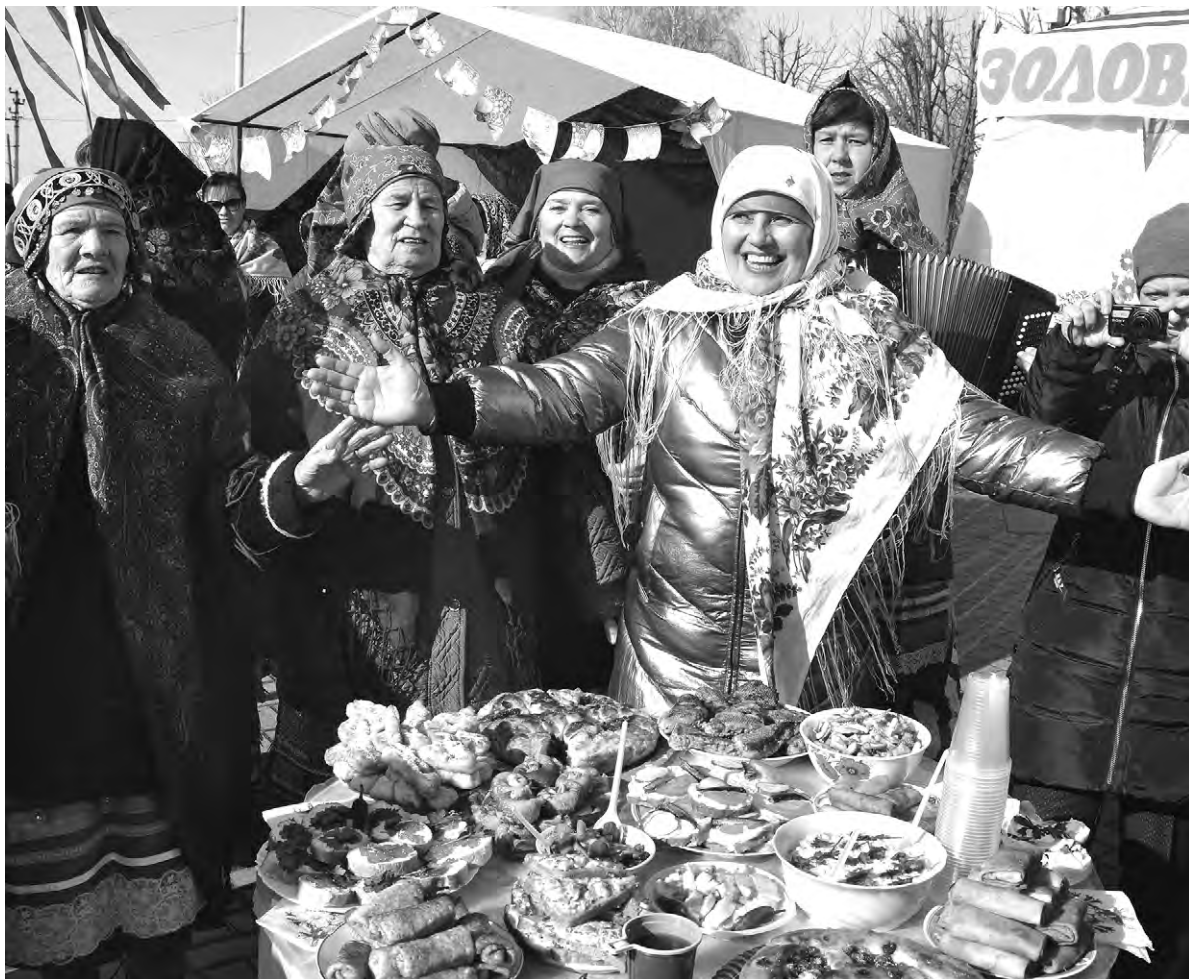
Лесноуколовские культработники зазывали гостей к щедрому столу.