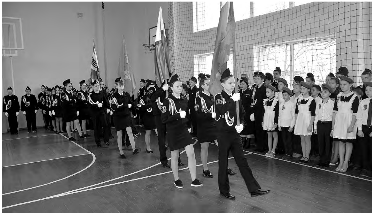
Строевая подготовка юнармейцев укрепляет дисциплину и развивает внимательность.