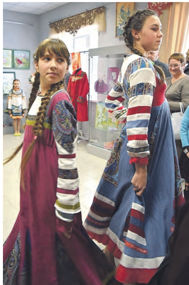
Воспитанницы студии моды «Узоречье» демонстрируют творенье рук Анны Алексеевны Кременец.

Т. КОТОЛЕВСКАЯ.