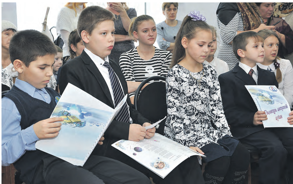
Авторы произведений, представленных в сборнике, готовятся прочитать их зрителям.

Губернатор Белгородской области объявил 2018-й год Годом детского чтения. Сотрудники центральной районной детской библиотеки разработали проект по созданию литературного сборника творческих работ детей Алексеевского района. Увидеть своё произведение опубликованным — очень важно для молодых дарований. Во-первых, это признание таланта, во-вторых, стимул для дальнейшего творчества, в-третьих, это зримое воплощение