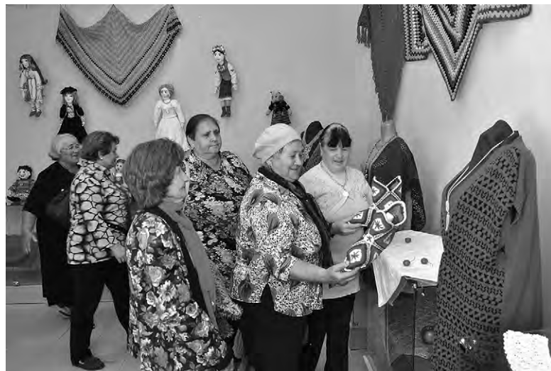
Что ни вещь — то эксклюзив!

ЮЛИЯ ДОЛИНИНА.