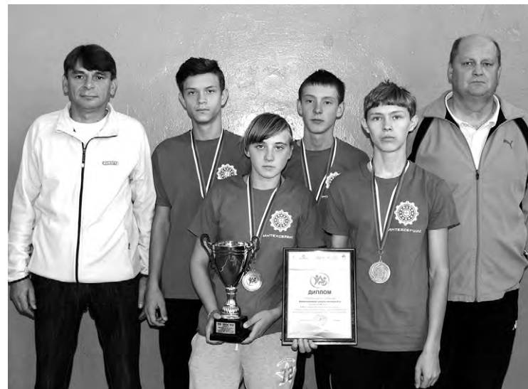
Представители алексеевской команды с наградами за третье место.