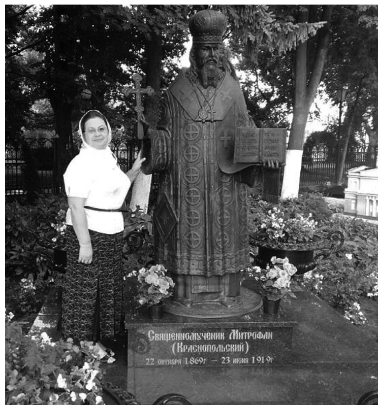
Автор публикации у памятника владыке Митрофану.

Заря Учредители: департамент внутренней и кадровой политики Белгородской области; администрация Красненского городского округа, администрация Красненского района, Совет депутатов Алексеевского городского округа Белгородской области, муниципальный совет муниципального района «Красненский район», АНО «Редакция газеты «Заря».