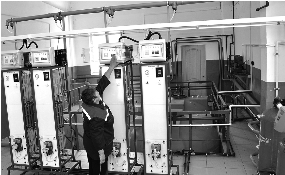
В новом цехе обеззараживания.