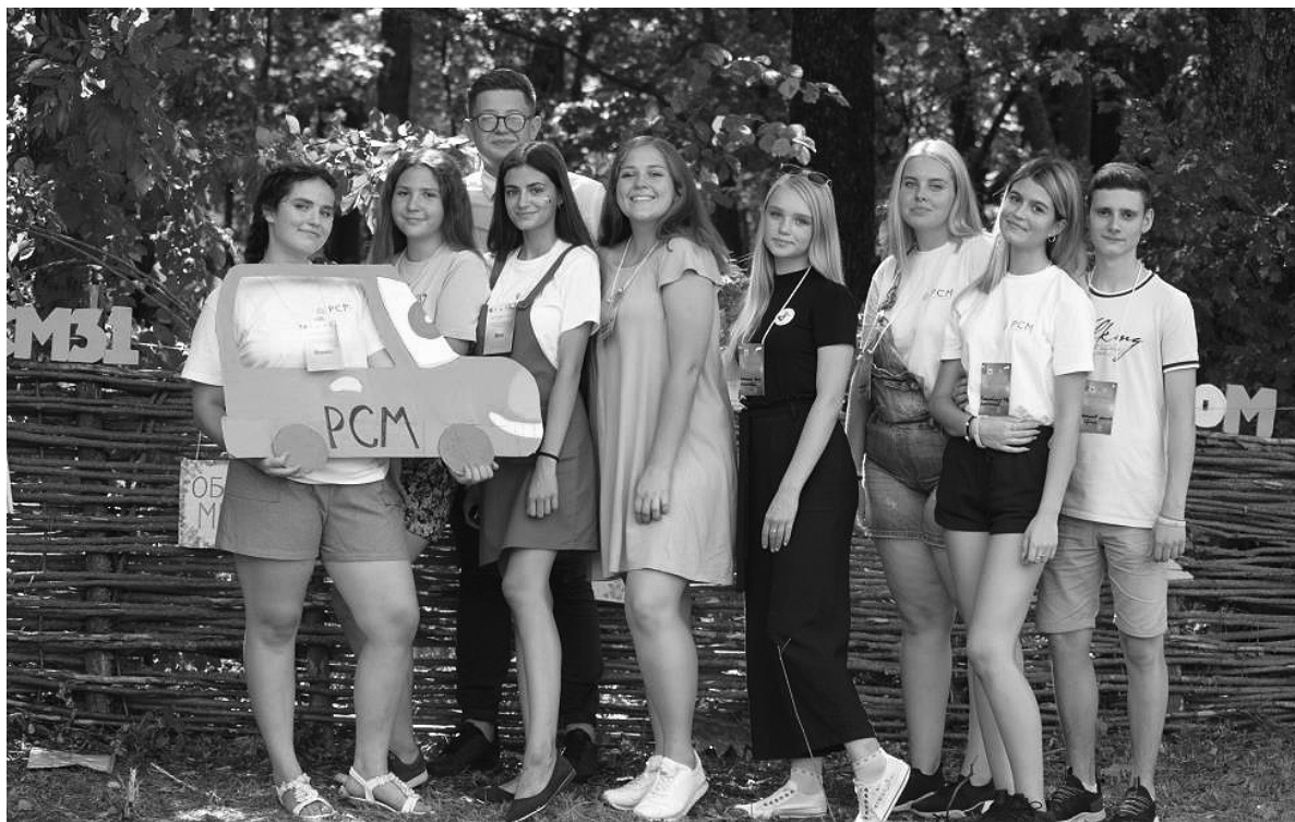
Слёт объединил ребят из разных районов области.

Пришла пора посвятить новых членов в ряды РСМ. Под де-