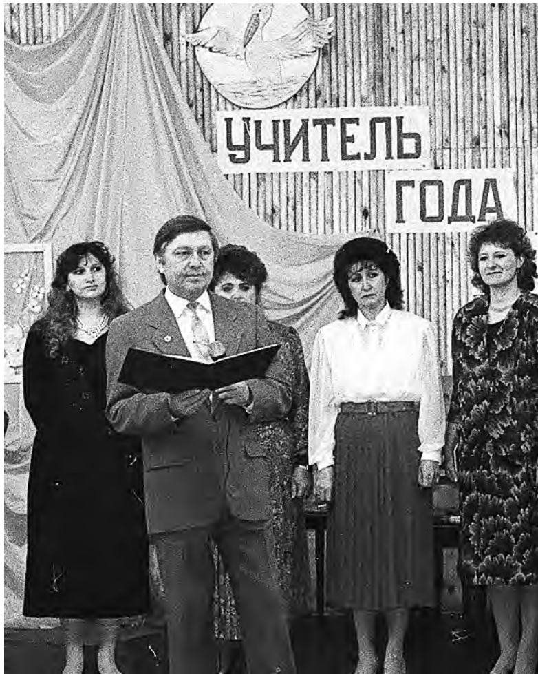
Автор статьи — единственный участник-мужчина и победитель конкурса (1994 г.).

В 1984 году меня назначили директором вечерней средней общеобразовательной школы работающей молодёжи № 1.