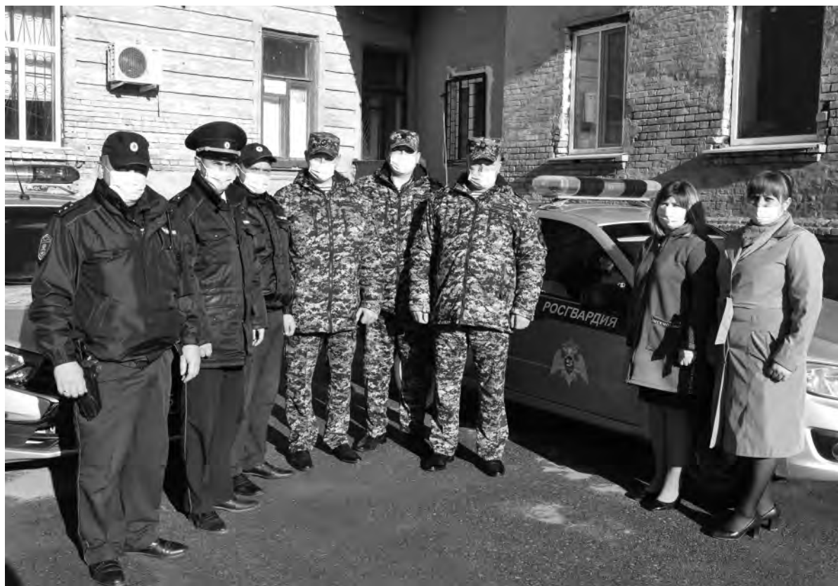
Сотрудники росгвардии всегда готовы прийти на помощь.