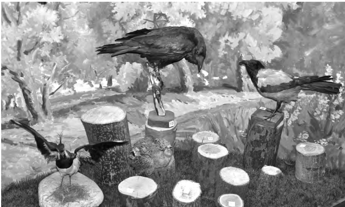
Чучела птиц «присели» на спиленные деревья.