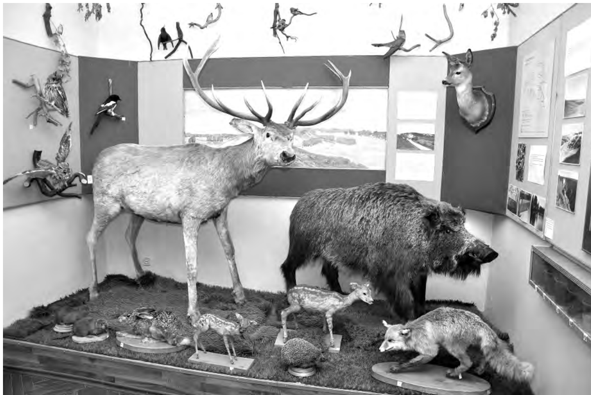
Один из уголков зала природы.

Своеобразие флоры, если можно так сказать, оживляют натуры фауны. В экспозиции представлены чучела оленя и дикого