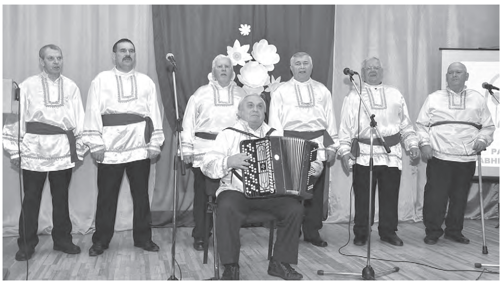
Зрителей порадовало выступление мужской части хора «Калина».

В районах прошли праздники, посвящённые Дню инвалидов