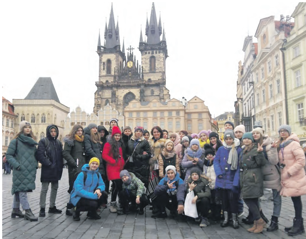
Для алексеевских ребят поездка в Чехию оказалась триумфальной.