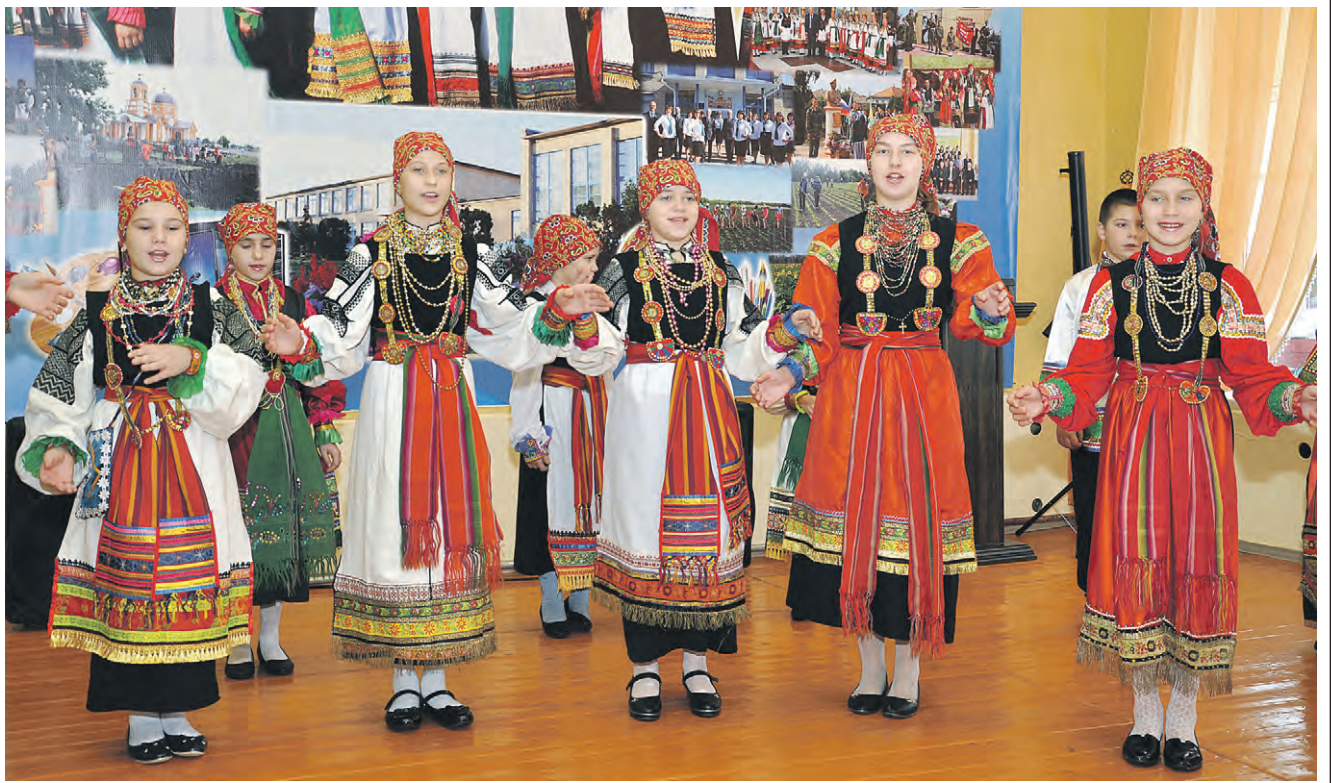
На сцене — участники детского фольклорного ансамбля «Тетёра».