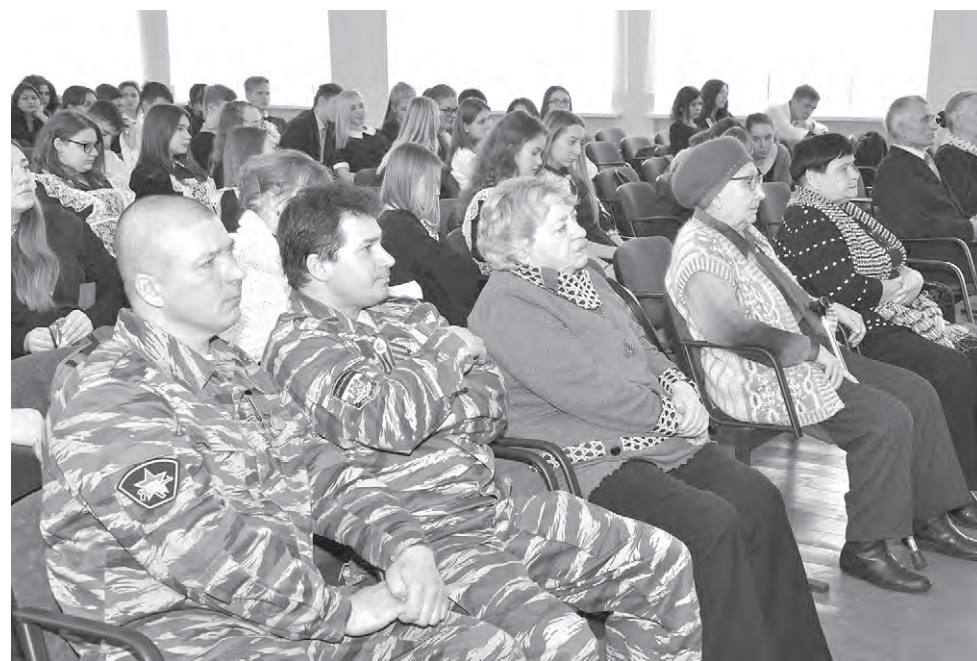
Собравшиеся в зале школы № 1 прониклись историями участников военных действий.