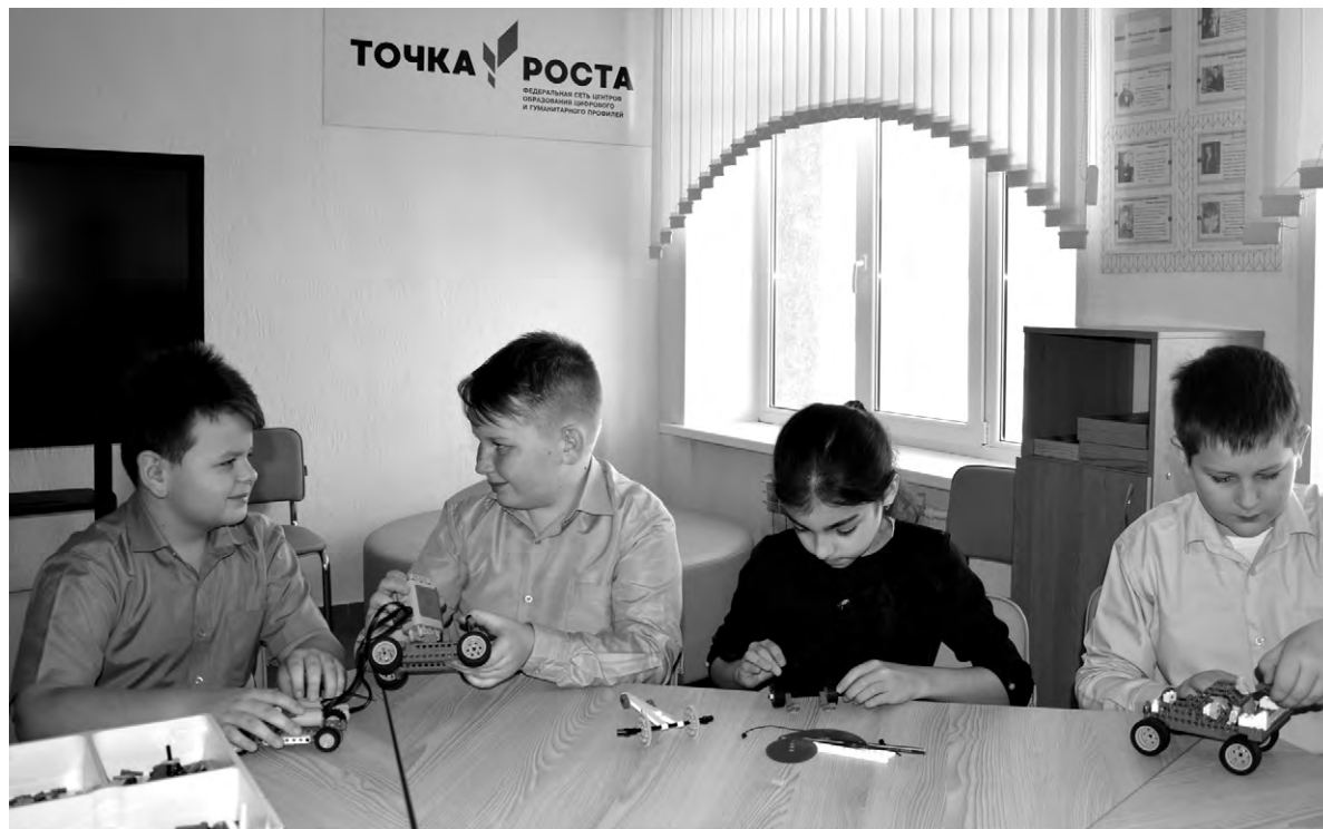
Благодаря «Точке роста», у школьников формируются современные технологические и гуманитарные навыки.

На новый уровень вышли и уроки технологии. Юные исследователи познают основы робототехники, изучают устройство и принципы работы механических моделей различной степени сложности. Наряду с этим, ребята осваивают электронный штан-