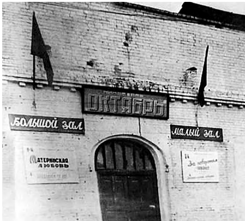
Кинотеатр на улице Чернышевского в 1960-е годы.