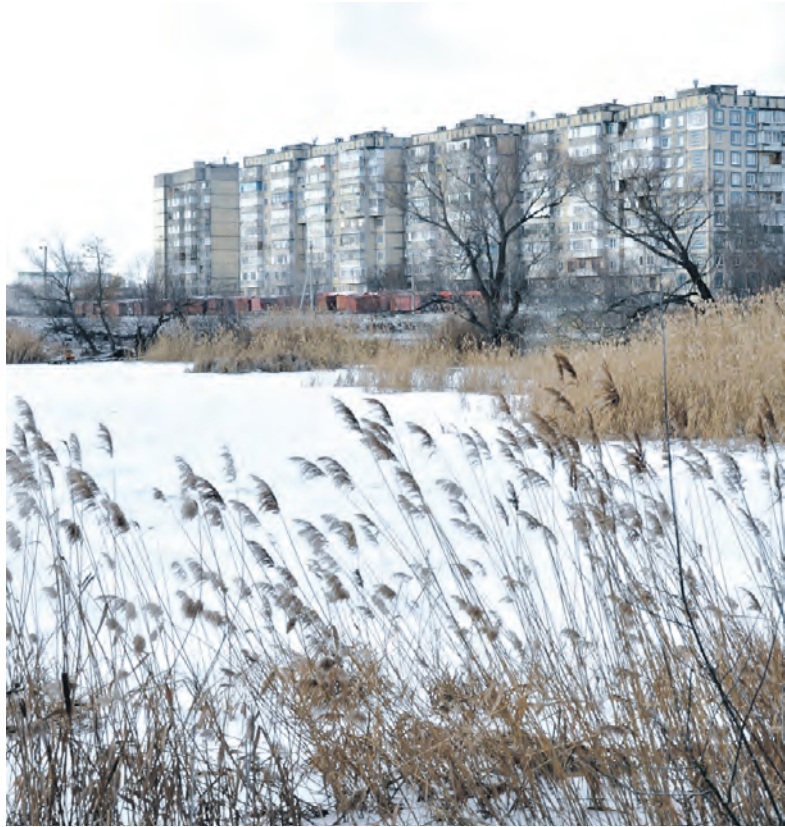
Микрорайон девятиэтажек накануне календарной весны.

У зимы сюрпризов, как всегда, хватает: То мороз зарядит, а то всё растает... Речку льдом сковало — тут тебе раздолье! А в местах проталин — диким уткам воля... Пусть февраль лютует — в нём уже усталость, До весны-красавицы чуточку осталось. Хоть ночами холод, зато днём — капели! Март уж на пороге, птицы вновь запели... Анна СПЕСИВЦЕВА.