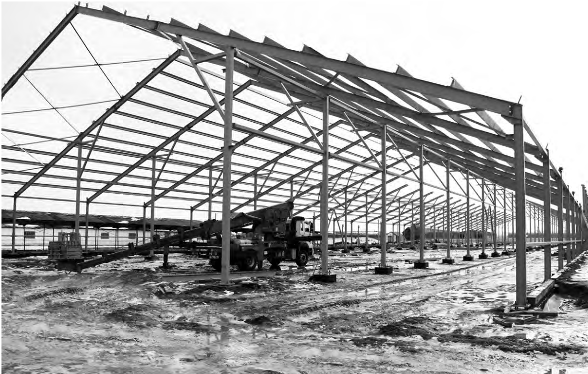
Комплекс ООО "Советское" рассчитан на 420 фуражных коров.