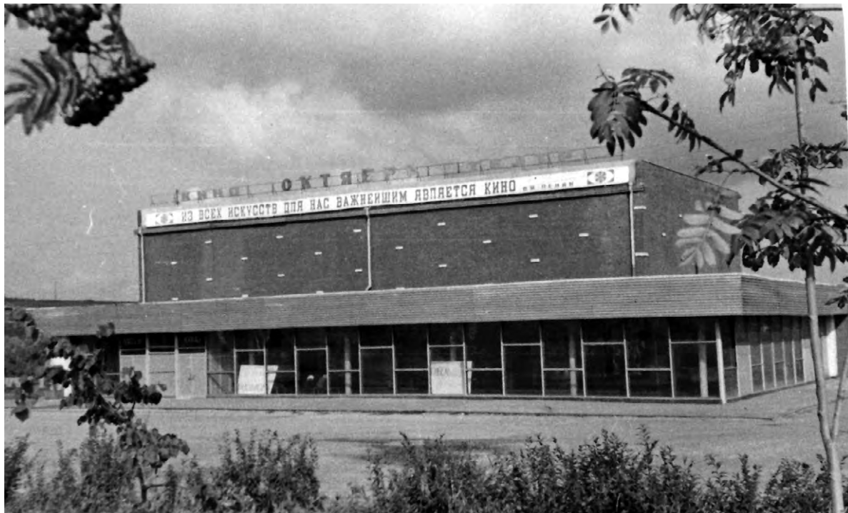
Кинотеатр «Октябрь» в 1980-е годы.