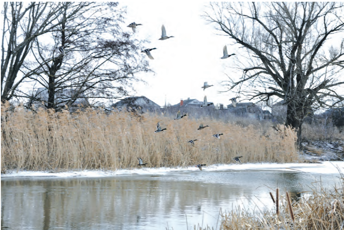
Дикие утки над Тихой Сосной.