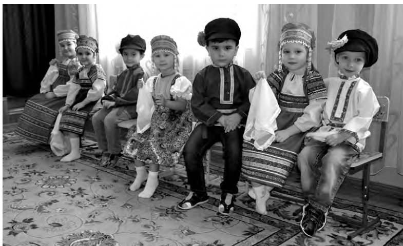
Воспитанники детского сада «Солнышко» любят участвовать в концертных программах.

Ещё один чудесный уголок — ботанический заказник «Балка Хвощевая», где произрастает около 80 видов реликтовых растений. Особенно красиво здесь ранней весной. На склонах можно встретить первоцвет весенний, тимьян меловой, солнцезвезд манетolistный, горицвет, гусиный лук, лапчатку и другие редкие экспонаты живой природы.