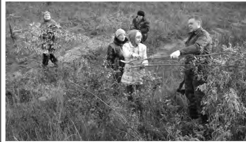
Вырубка сорной растительности вдоль дорожного полотна.

Самые масштабные работы в день акции велись на участке автодороги Красное-Лесное Уколово. Здесь активисты вырубали сорную растительность и убирали бытовой мусор. Трудились дружно и слаженно, а главное — результативно.