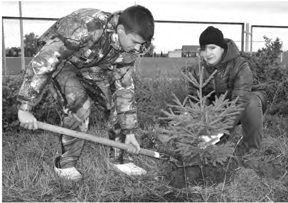
Работники ЗАГС на закладке ёлочной аллеи.

В райцентре возле центрального стадиона была заложена еловая аллея, посвящённая 100-летию ор-