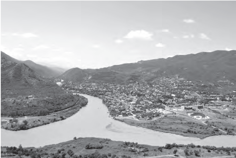
Слияние двух рек. Куры и Арагви. Мцхета.

Я вспомнил раньше... Обливаясь потом, карабкаюсь вверх, забыв о приступах романтизма, хотелось лишь