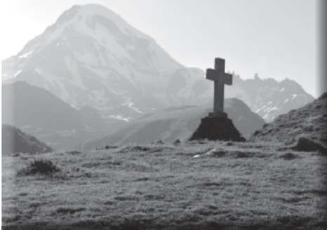
Казбек. (Вид на гору).

могут подвезти на внедорожнике. Цена вопроса — 20 лари в обе стороны (около 500 рублей) с человека. Эту услугу активно предлагают стоящие на обочине люди. Вежливо отказываемся: