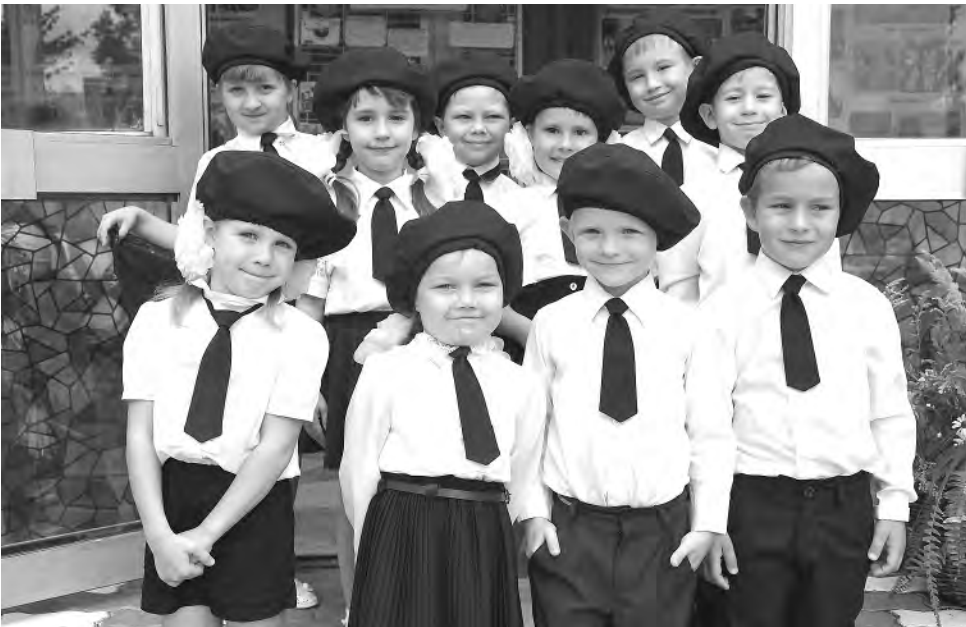
Мы теперь кадеты.