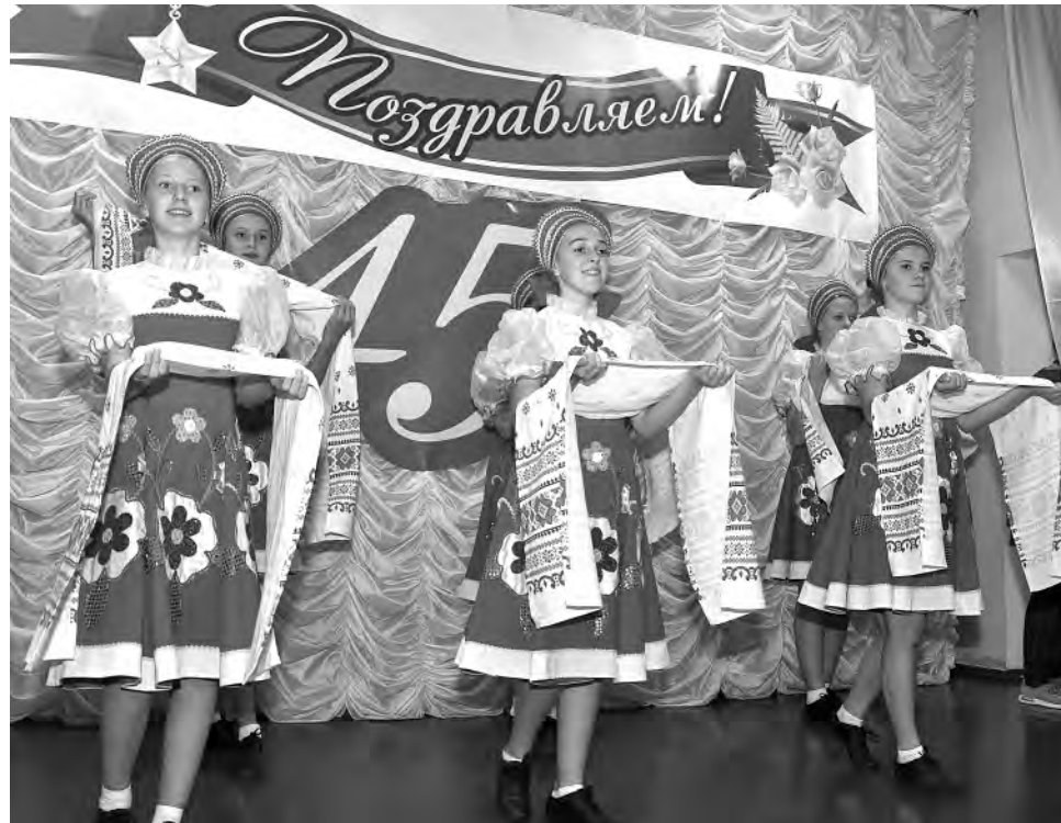
Глуховские школьники чествовали знаменитую юбиляру.