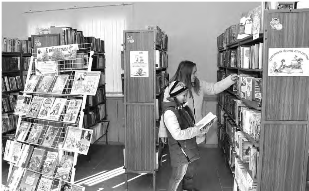
Книги — в свободном доступе.