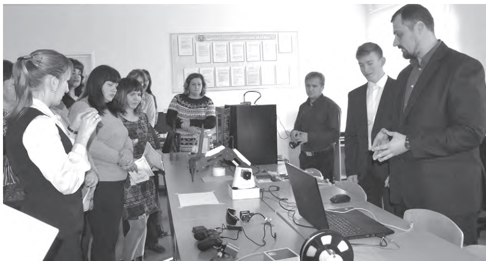
Родители увидели возможности современного компьютерного класса.