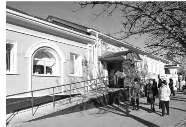
Так выглядит обновлённое здание библиотеки.

Участники торжества, а это были в основном библиотекари и юные читатели, вошли внутрь и убедились, что все помещения соответствуют требованиям, предъявляемым современному детскому учреждению культуры. Каждый читатель найдёт здесь занятие по душе. Вместе с абонементом и читальным залом в библиотеке появился зал сказок с элементами экозоны, территория для занятий