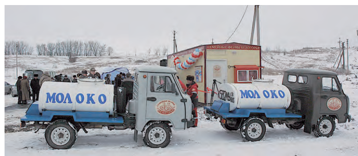
Так десять лет назад выглядел приёмный пункт.