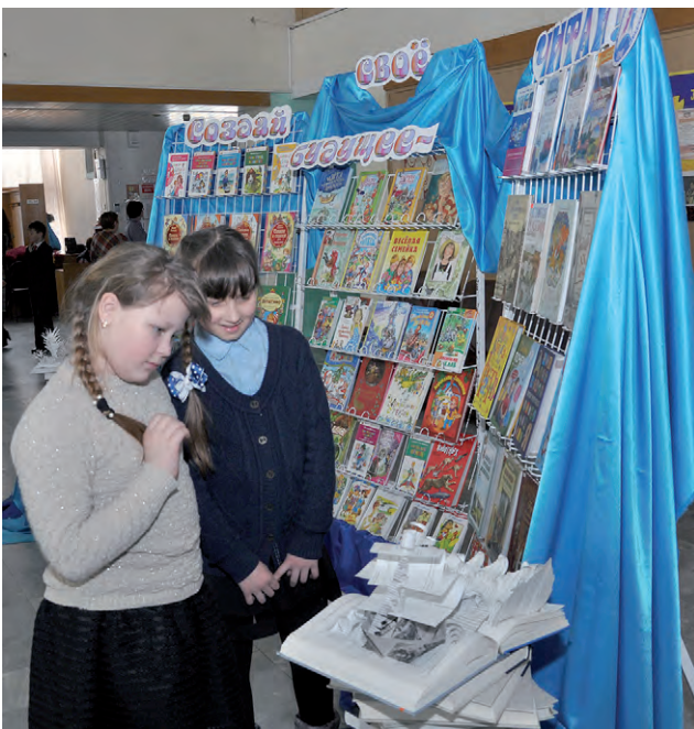
Книжная выставка в фойе заинтересовала гостей праздника.

Н. САПРЫКИНА, ведущий методист по работе с читателями-детьми.