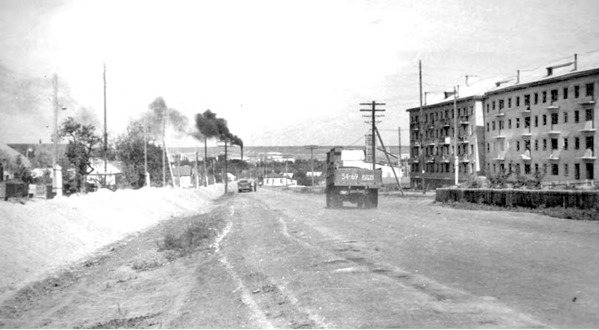
Ул. Мостовая (К. Маркса), 1970-е годы.