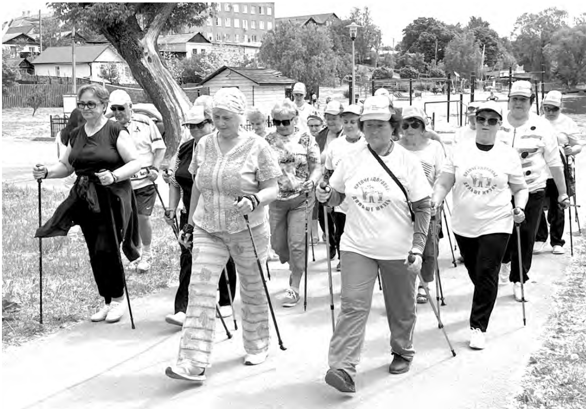
Алексеевские пенсионеры знают о пользе скандинавской ходьбы.