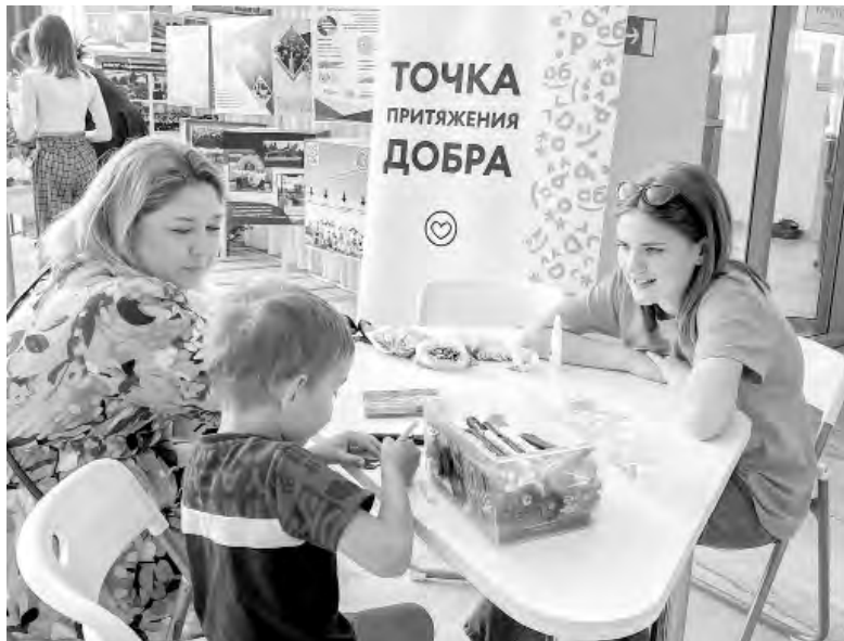
Алексеевские волонтеры ДоброЦентра провели мастер-класс по изготовлению тематических значков.

Сотрудники Алексеевского краеведческого музея провели для детей развлекательную программу «Солнечные зайчики». Маленькие виновники торжества участвовали в конкурсах, от-