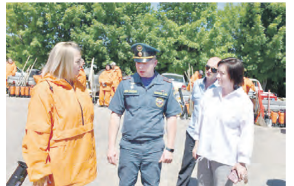
Соб. инф.

Традиционно мероприятие проходит каждый год. В этот раз в смотре приняли участие 20 пожарных дружин, по одной от каждой сельской территории.