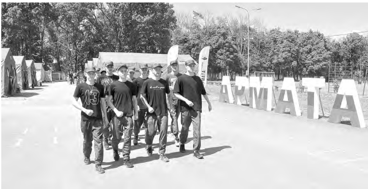
Кто шагает дружно в ряд? Сильные, смелые, ловкие, умелые участники первой смены.

На днях палаточный лагерь посетил губернатор Вячеслав Гладков. Он отметил, что необходима доработка в проектом решении. В частности, надо увеличивать площадь жилых корпусов. Должны быть костровые, чтобы ребята почувствовали себя в приравненных условиях начальной военной подготовки. Предложение предстоит доработать руководству лагеря совместно с руководством горокруга.