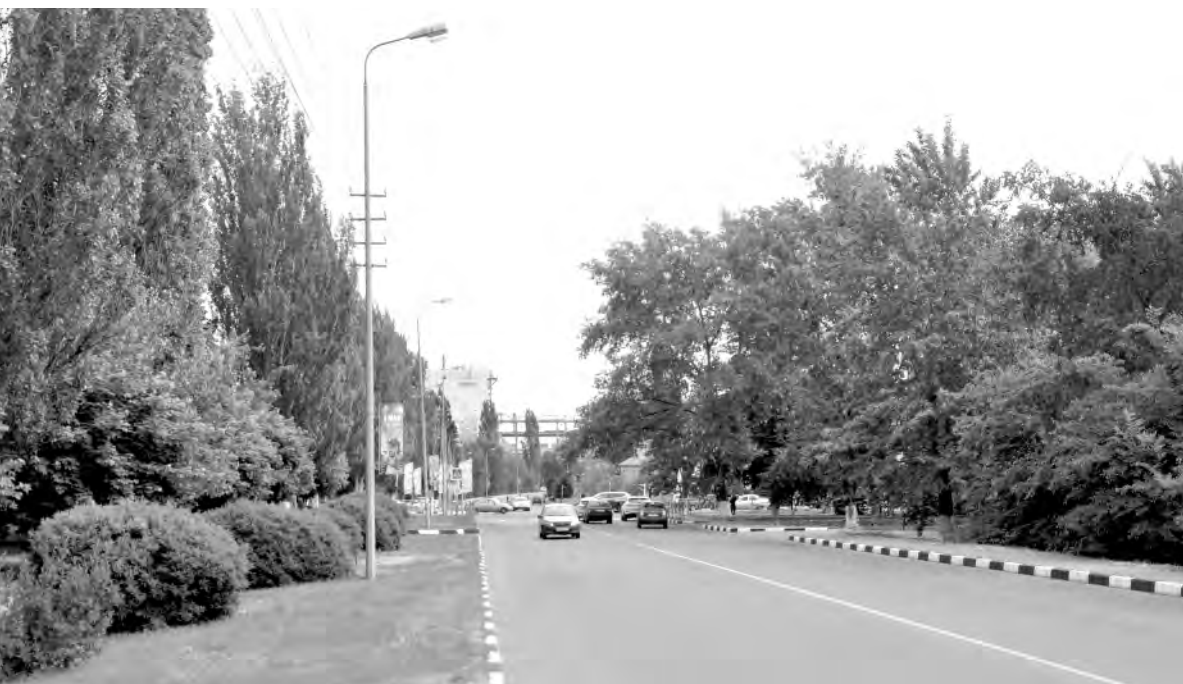
Это же место в наши дни.