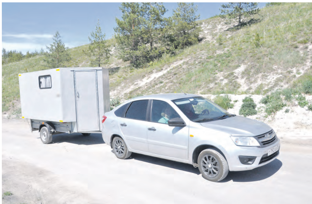
«Лада-Гранта» с жилым модулем.

Заря Учредители: министерство общественных коммуникаций Белгородской области; администрация Алексеевского городского округа, администрация Красненского района Белгородской области, Совет депутатов Алексеевского городского округа Белгородской области, муниципальной совет муниципального района «Красненский район», АНО «Редакция газеты «Заря».