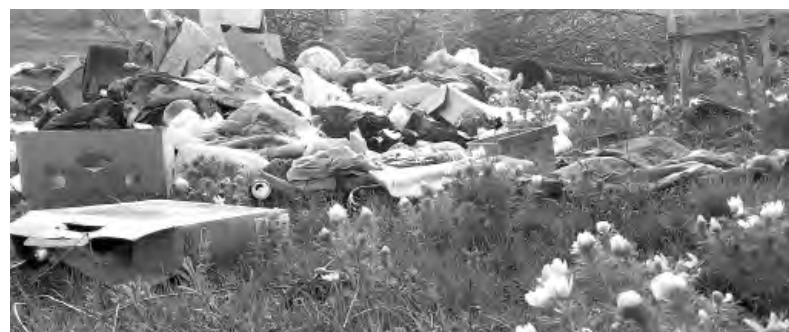
Человек вторгся в природу. Его сюда не звали. Что будет с нашей планетой, если мы продолжим так жить?

Правда, кое-кто даже до контейнеров не доходит. Спилит дерево около дома, тут же сбросит ветки, у других и вовсе строительный мусор лежит возле двора. Главное, чтобы на территории домовладения был порядок, а обстановка за его