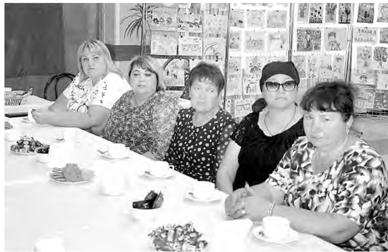
Многие родные участников СВО нашли поддержку в филиале фонда «Защитники Отечества».

— Фонд может помочь в адаптации жилья для ветеранов с инвалидностью, в приобретении современных протезов и других средств реабилитации. У наших