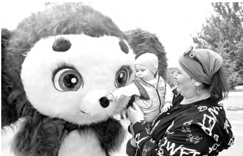
Ростовая кукла Чебурашка приглянулась и детям, и взрослым.