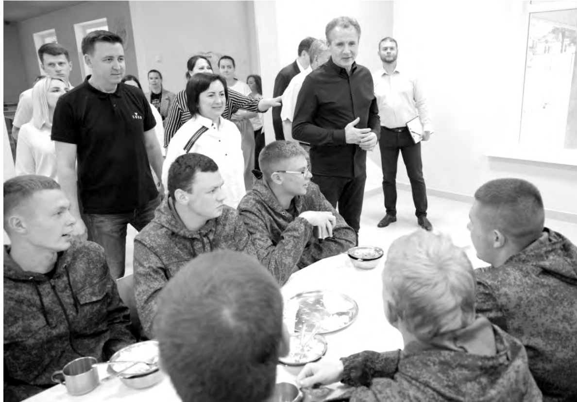
В минувшую пятницу в «АРМАТЕ» побывал Вячеслав Гладков.

Слева от полосы препятствий планируется создать взводный опорный пункт, как на передовой, рассказывает Юрий Васильевич. Рыть окопы и строить блиндаж будут сами ребята. Мы идём вглубь лагеря. Начальник смены подробно рассказывает о каждом объекте на территории — вот штабная палатка, изолятор, в который помещают приболевшего участника, с последующим отправлением в больницу или домой, здесь медпункт, где в случае необходимости оказывается первая помощь, палатки, оборудованные двуспальными кроватями, в которых живут ребята. Обращаю внимание на парня, который стоит около одной из них. Интересуюсь, чем он занят. Студент второго курса