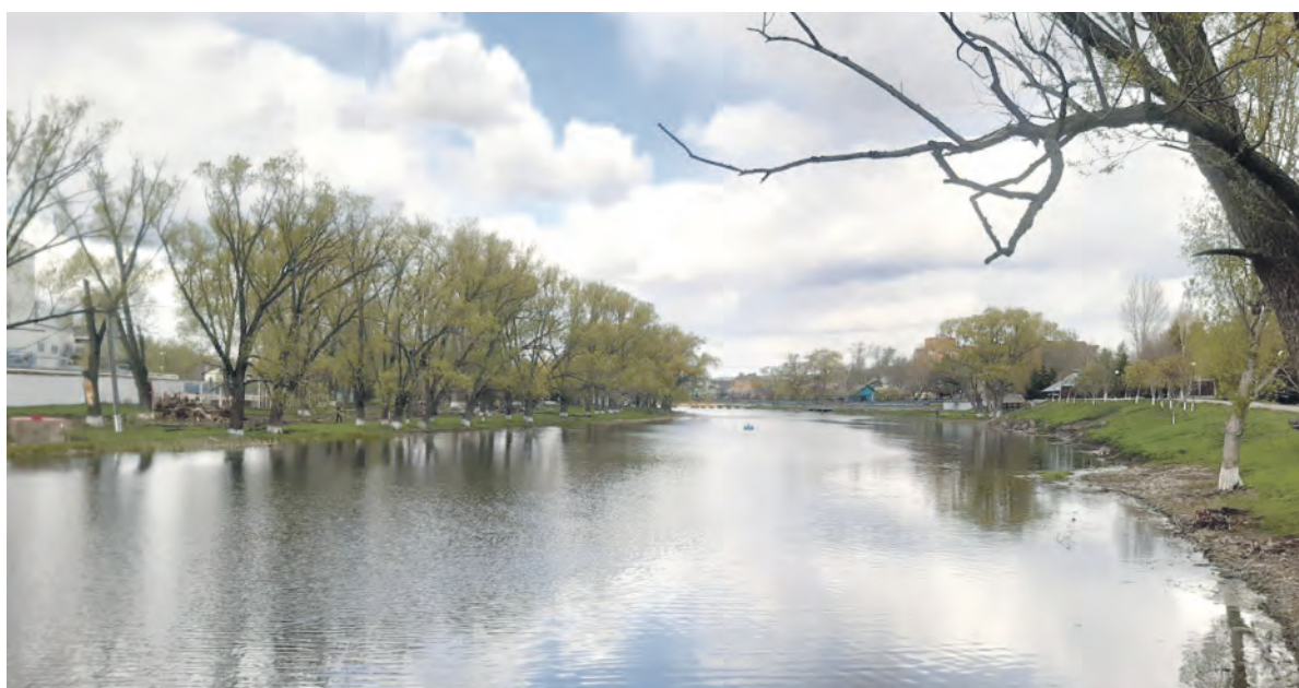
Река Тихая Сосна в городской черте.

Заря Учредители: министерство общественных коммуникаций Белгородской области; администрация Алексеевского городского округа, администрация Красненского района Белгородской области, Совет депутатов Алексеевского городского округа Белгородской области, муниципальной совет муниципального района «Красненский район», АНО «Редакция газеты «Заря».