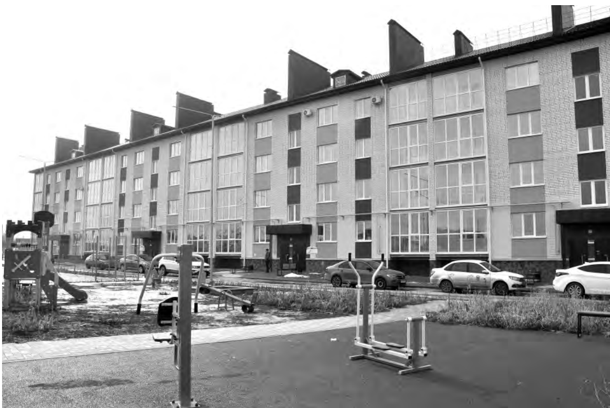
Новый дом по улице Льва Толстого.