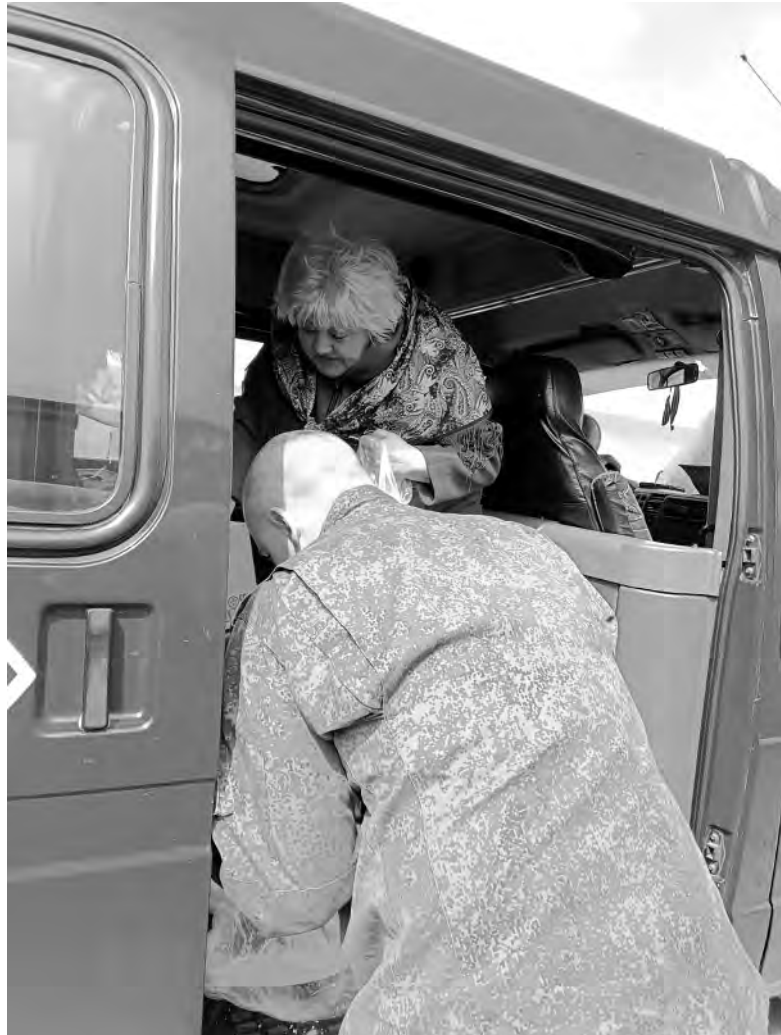
Военные очень ценят любую поддержку.

Госпиталь, развёрнутый в полевых условиях, представляет собой палаточный городок. Здесь, как положено, имеются реанимационное отделение, перевязочные и опера-