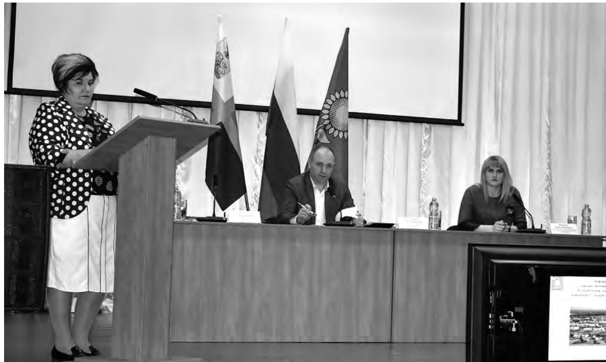
Президиум рабочей встречи во время доклада о социально-экономическом развитии территории.

Вячеслав ГЛАДКОВ, губернатор Белгородской области.