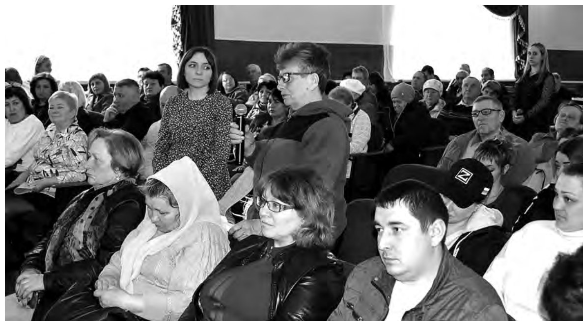
Один из вопросов, заданных местными жителями, касался необходимого ремонта школы в Мухоудеровке.