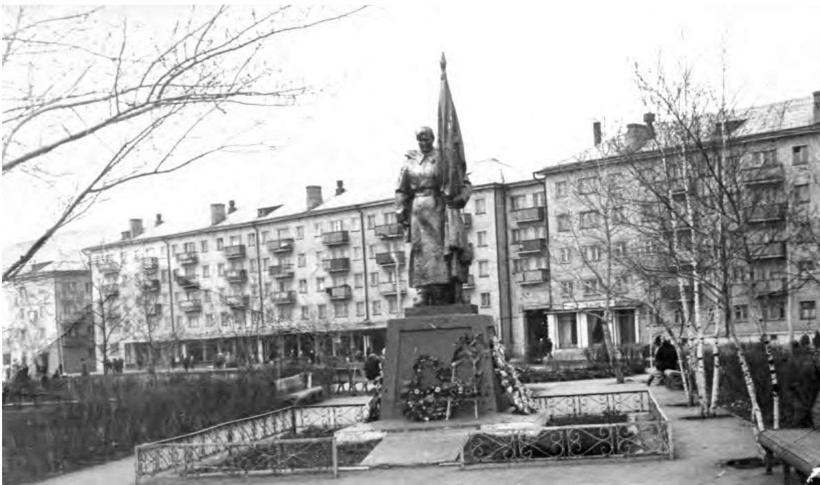
Улица Гагарина в 1970-е годы.