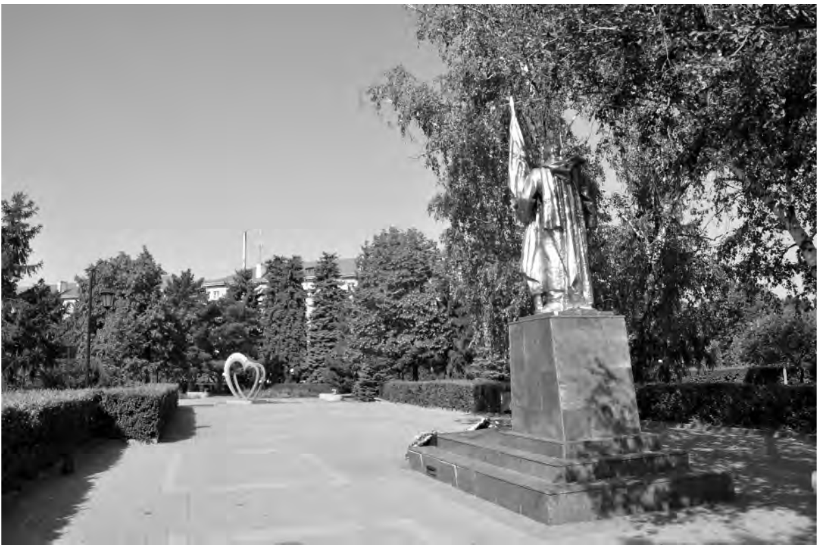
Это же место сейчас.