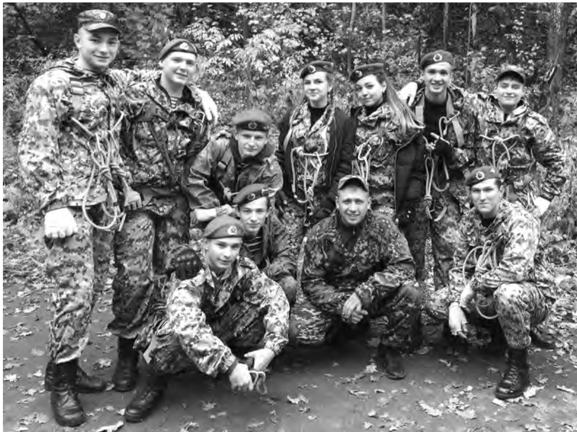
Члены клуба «Кобра» на полевых занятиях.

— Была мечта, — сказал он, — я её реализовал. Сам служил в воздушно-десантных войсках, преподавал ребятам рукопашный бой. Теперь, когда «Кобра» находится у нас, хочется, чтобы в клубе занималось как можно больше ребят. Военно-патриотическое воспитание сейчас очень актуально. Да и в обычной жизни полученные знания могут пригодиться, так как тут учат, как защититься от холодного оружия, как вести себя в различных ситуациях, в том числе стрессовых, и многому другому. Кстати, записаться могут все желающие по телефону