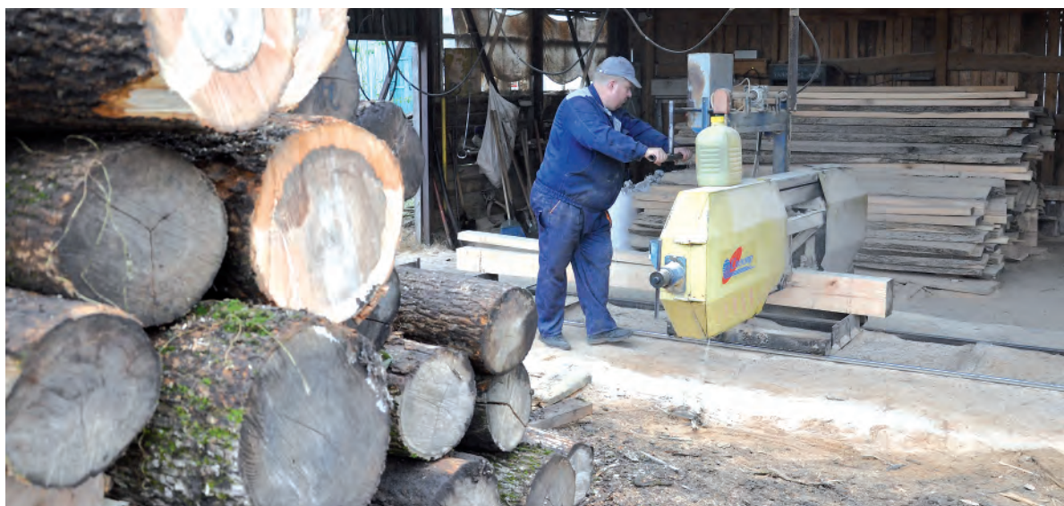
Обработка древесины на пилораме.