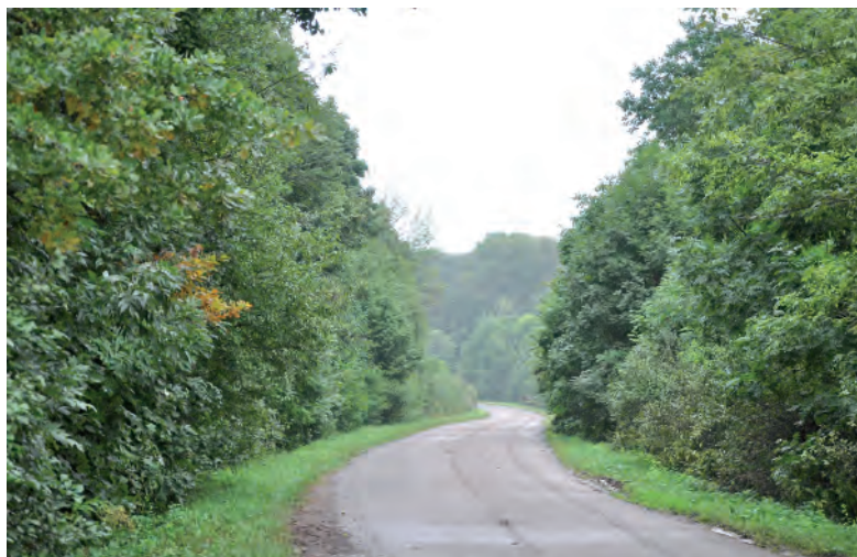
Дорога на Городище через дубраву.