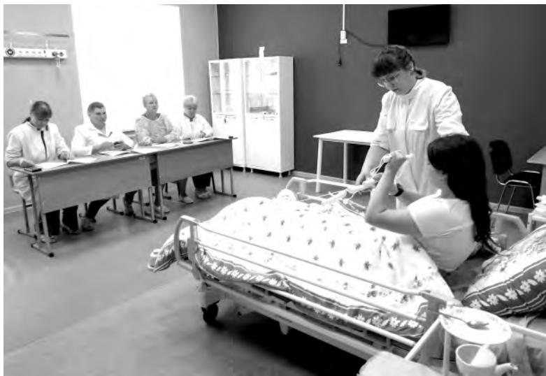
Момент обучения красненских соцработников.

Для предоставления возможности проживания в домашних условиях гражданам, которые по состоянию здоровья нуждаются в постоянном постороннем уходе, а также оказания помощи семьям с тяжело и длительно болеющими родственниками, с прошлого года в Комплексном центре социального обслуживания населения Красненского района внедрена новая стационарозаме-