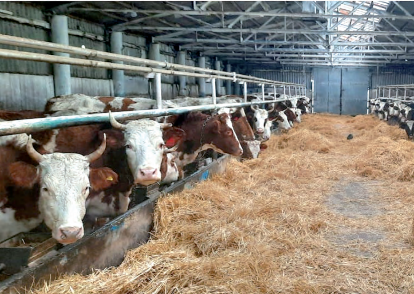
Сытое хозяйство — залог высокой продуктивности.