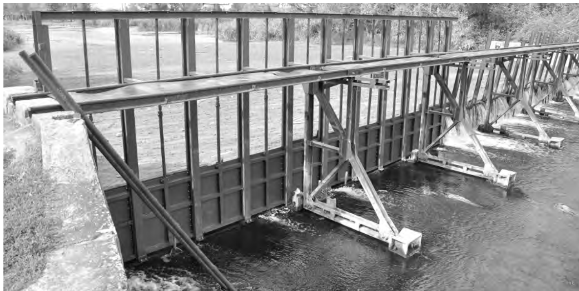
На плотине уже действуют десять новых металлических затворов.

Анатолий МАКСИМОВ.