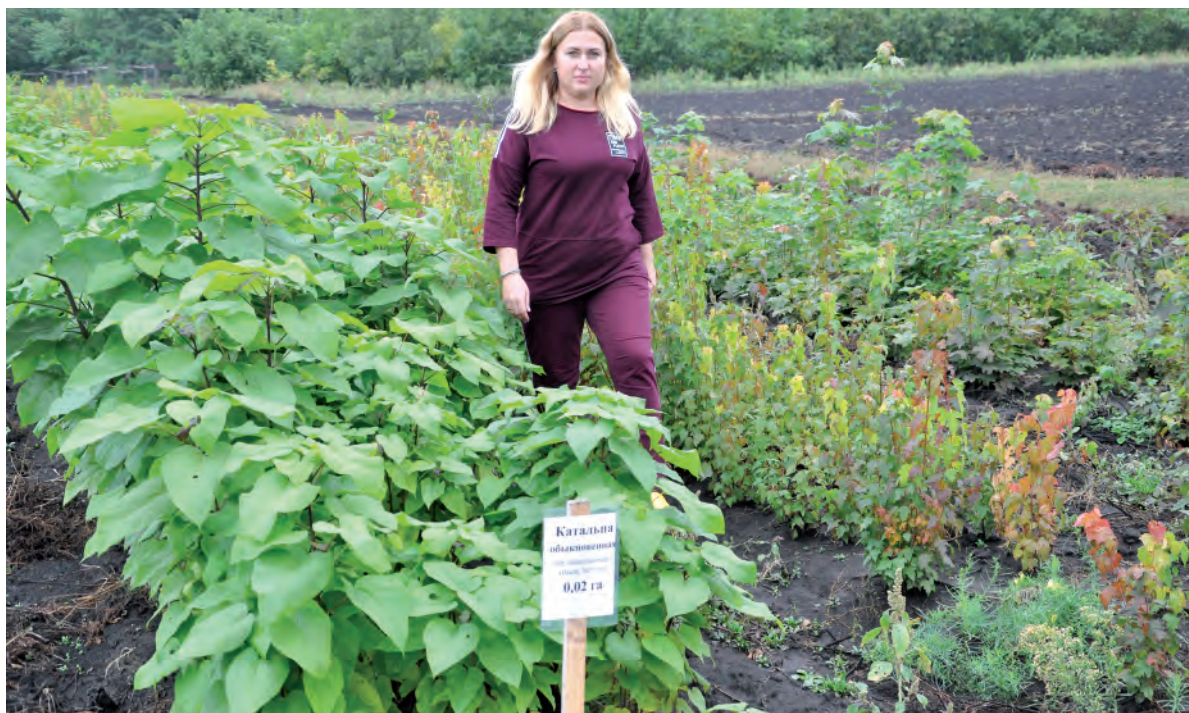
В питомнике подрастают саженцы.