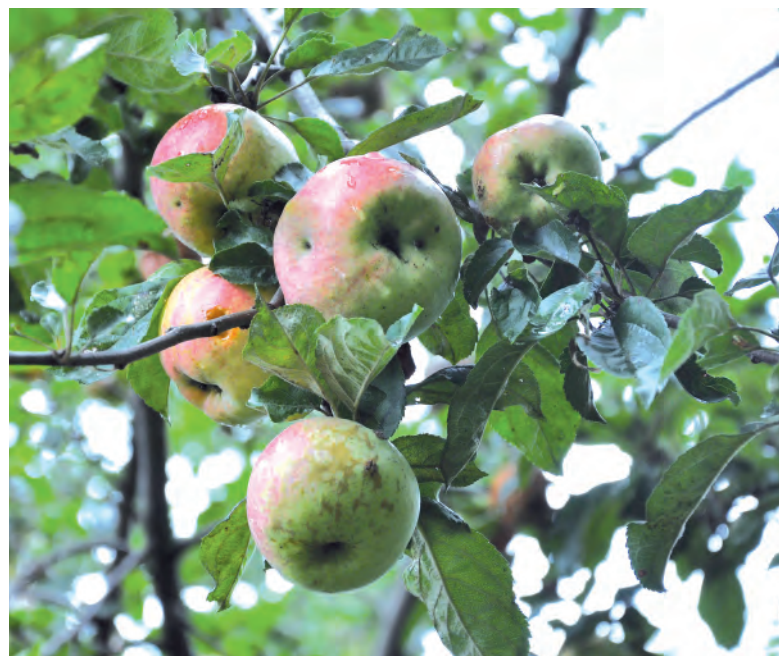
Обильный урожай яблок в саду Городища.