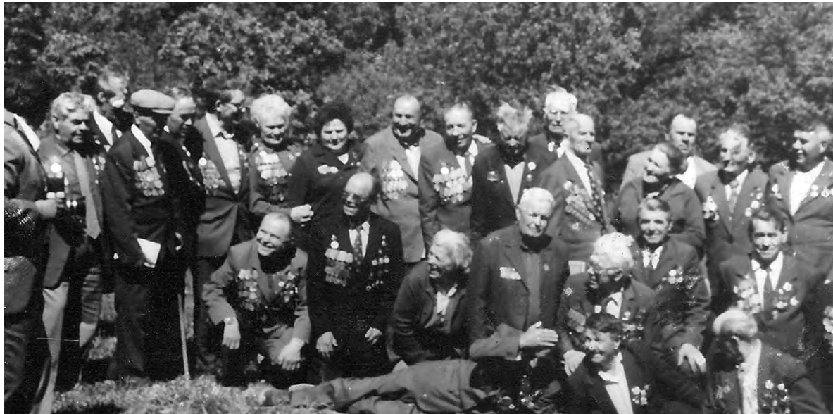
Встреча ветеранов 48-й гвардейской стрелковой дивизии в Варваровке. 1980 год.

В 8 часов 20 января группа противника силой до двух батальонов и 300 всадников вышла из Кривой Березы в район высоты 207,0, где завязался бой