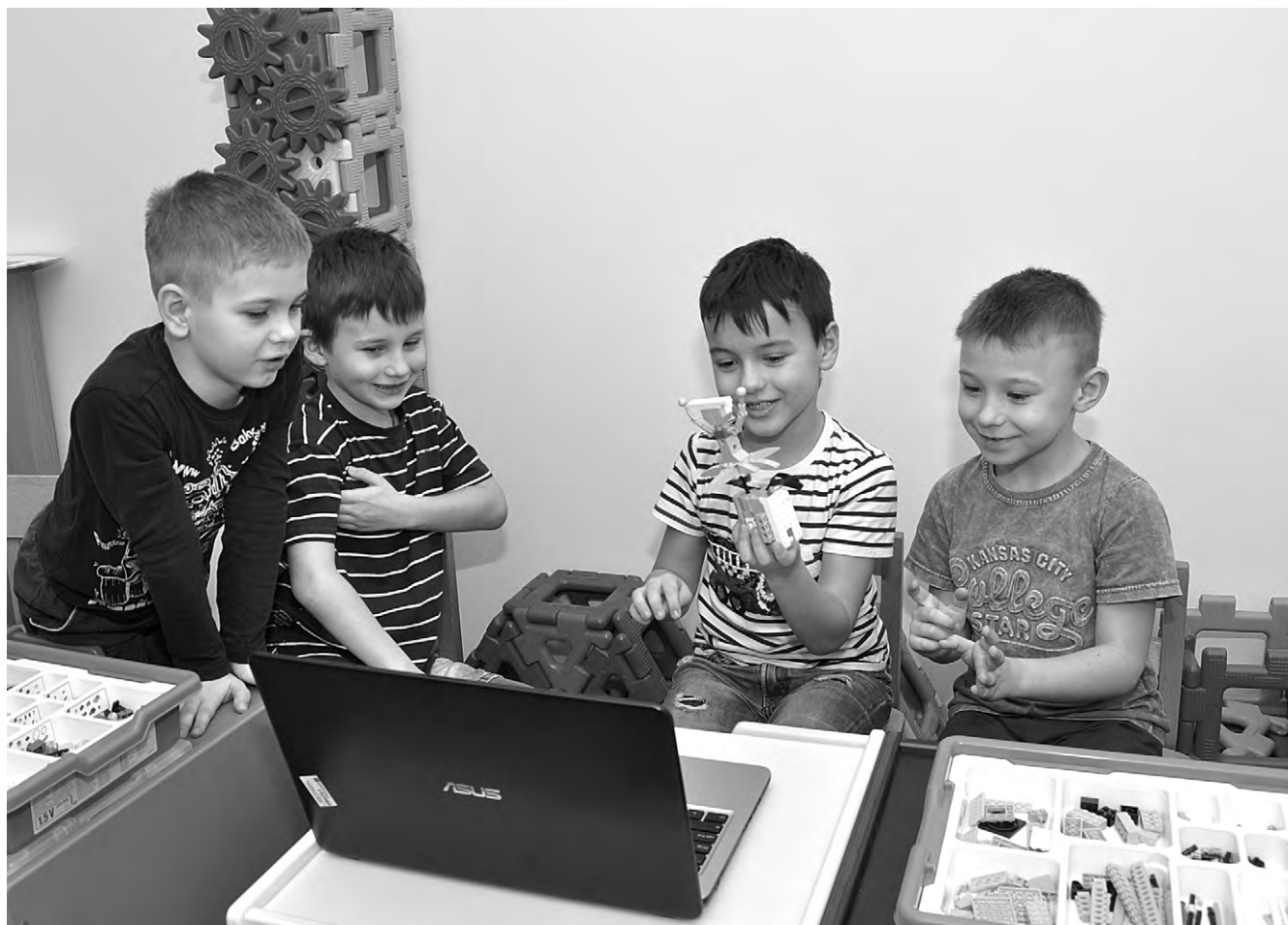
Воспитанники логопедической группы с удовольствием осваивают робототехнику.