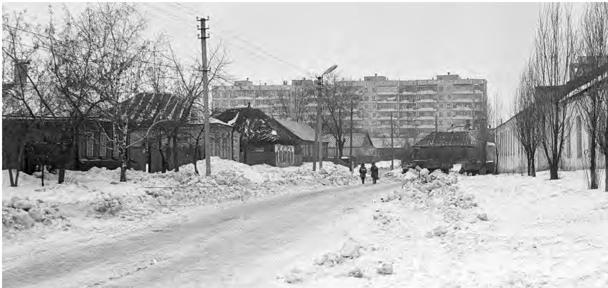
Улица Республиканская. 1990-е гг.