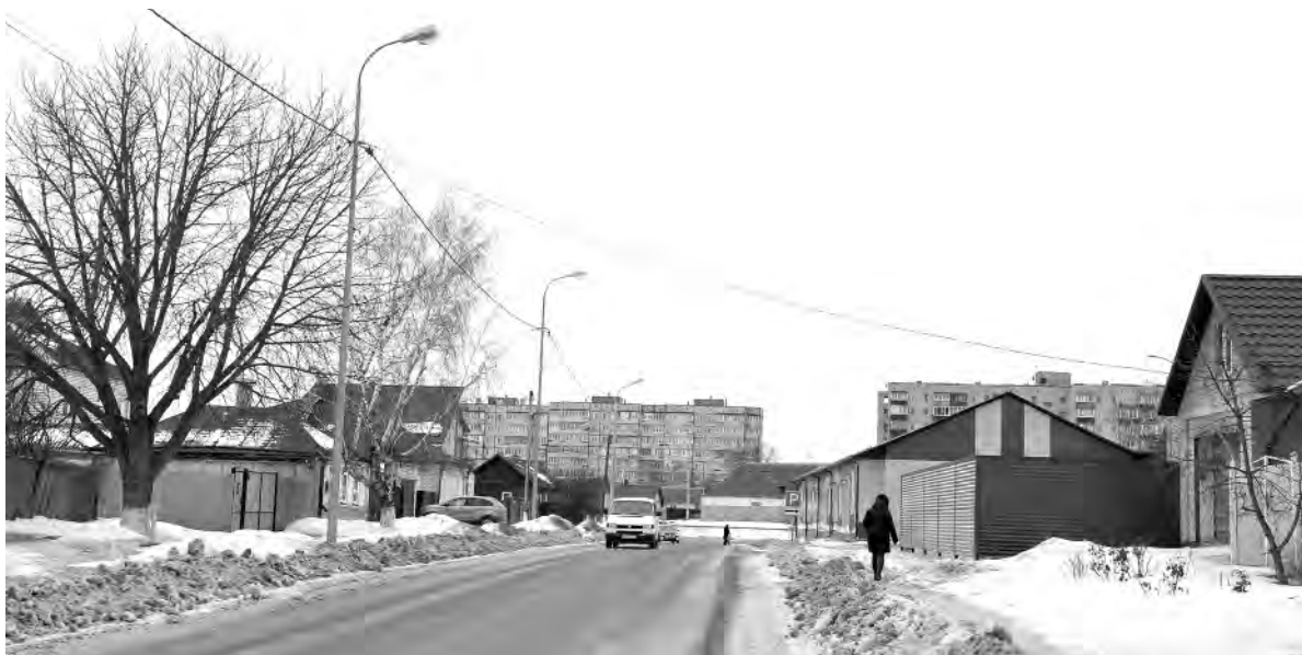
Это же место. Наши дни.