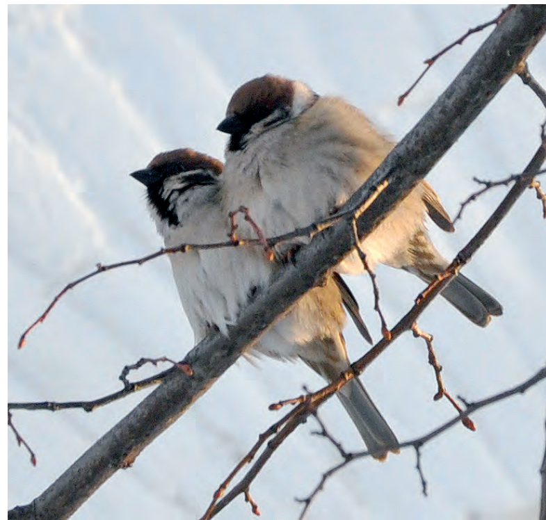
Наохлившись, птички плотно прижимаются друг к другу и ждут «загулявшую» весну.

Татьяна ДЕВИЦЫНА.