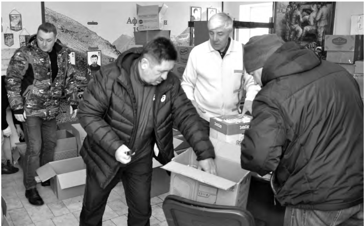
В пункте сбора помощи «кипит работа».