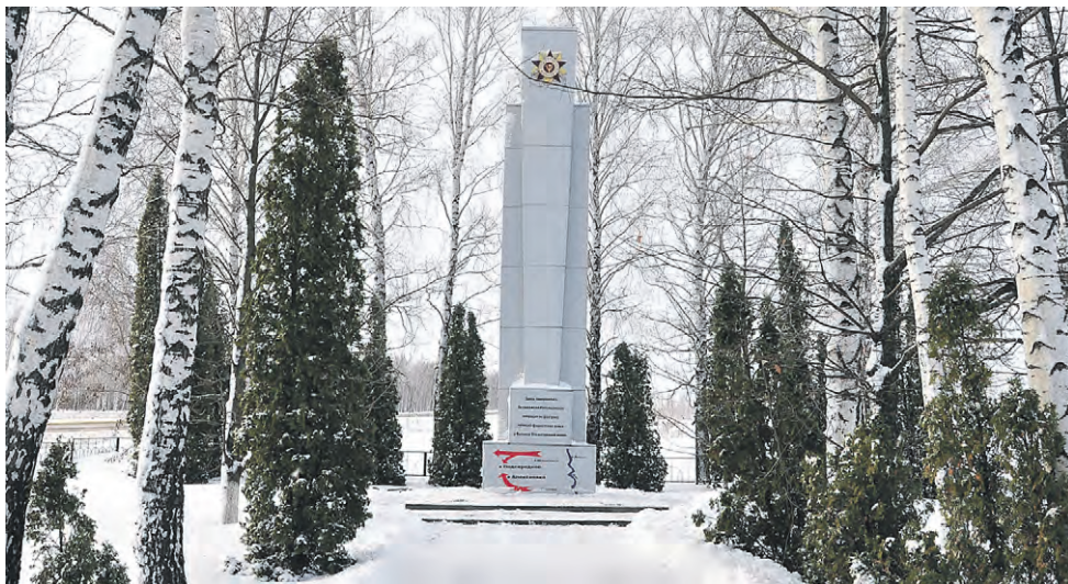
Стела на окраине Подсереднего, на месте завершения Острогожско-Россошанской операции.