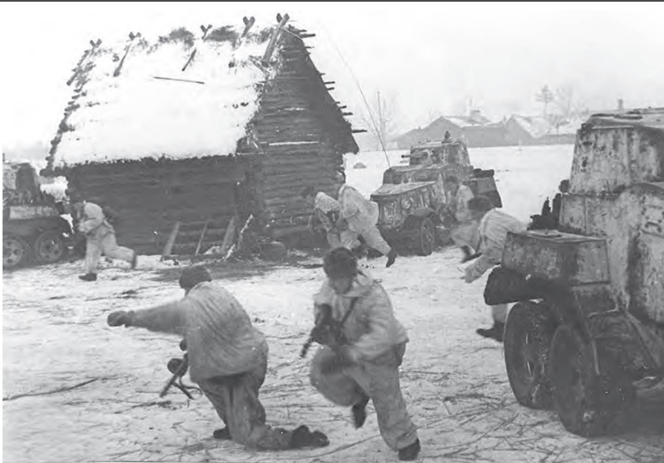
Боевые эпизоды во время Острогожско-Россошанской операции.