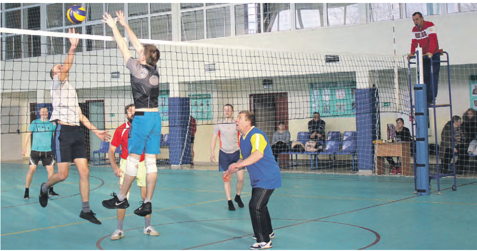
Острый момент финальной игры.

сельских территорий. В итоге первое место заняла команда из Лесного Уколова, второе — из Камызина, третье — из Сетище. Победители и призёры награждены кубком, медалями и грамотами. М. КУЗНЕЦОВА, специалист Красненского центра молодёжных инициатив.