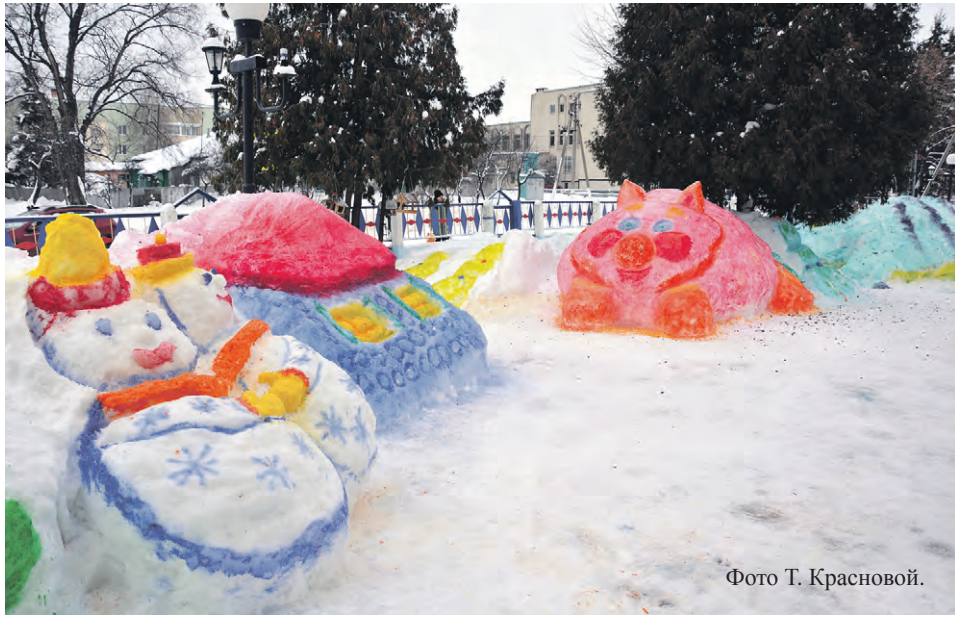
Беспрерывным снегопадом Затянулся небосвод. Во дворе детского сада Развернулся хоровод: