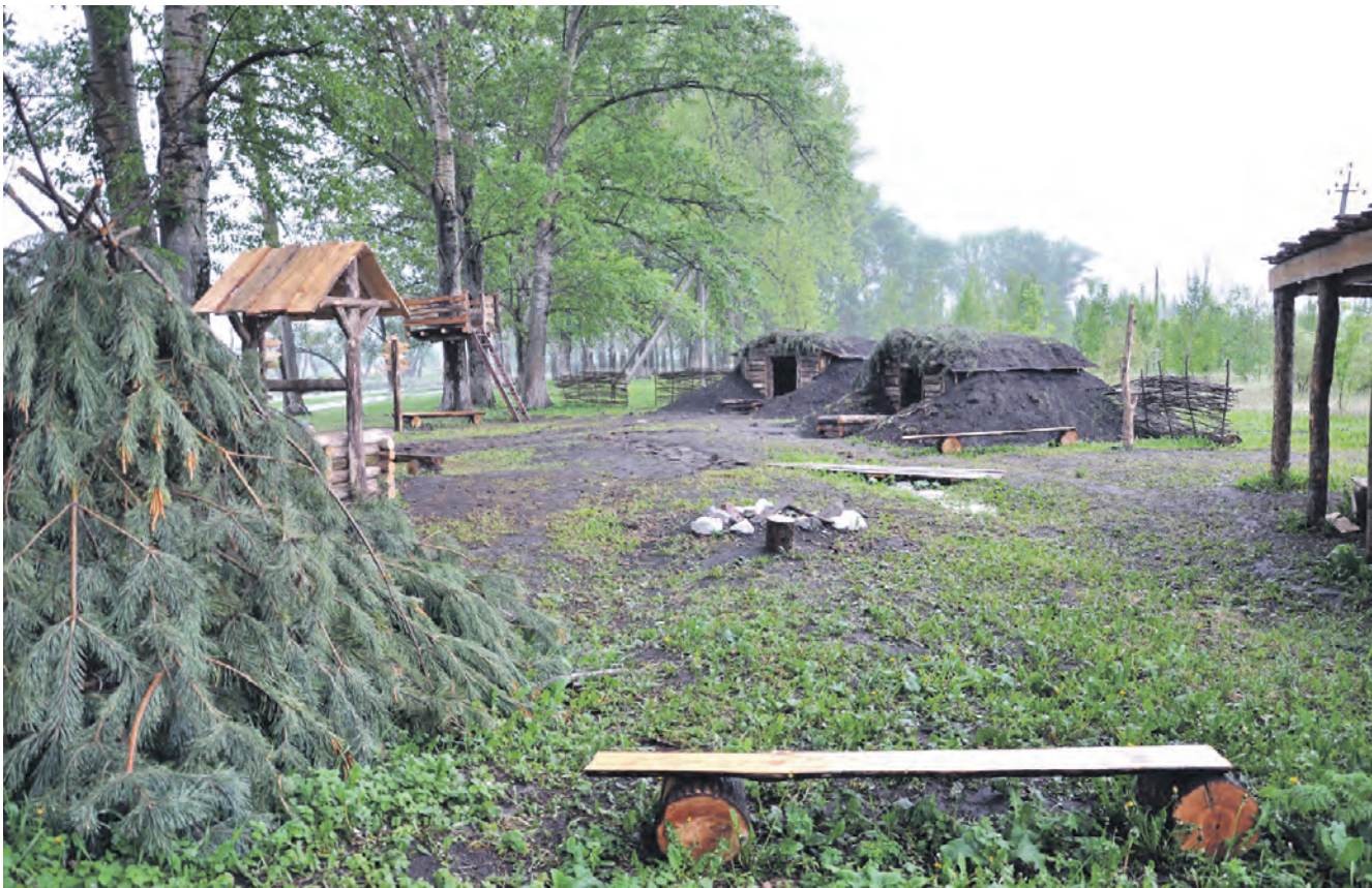
«Партизанская деревня» привлекает алексеевцев своей реальностью.