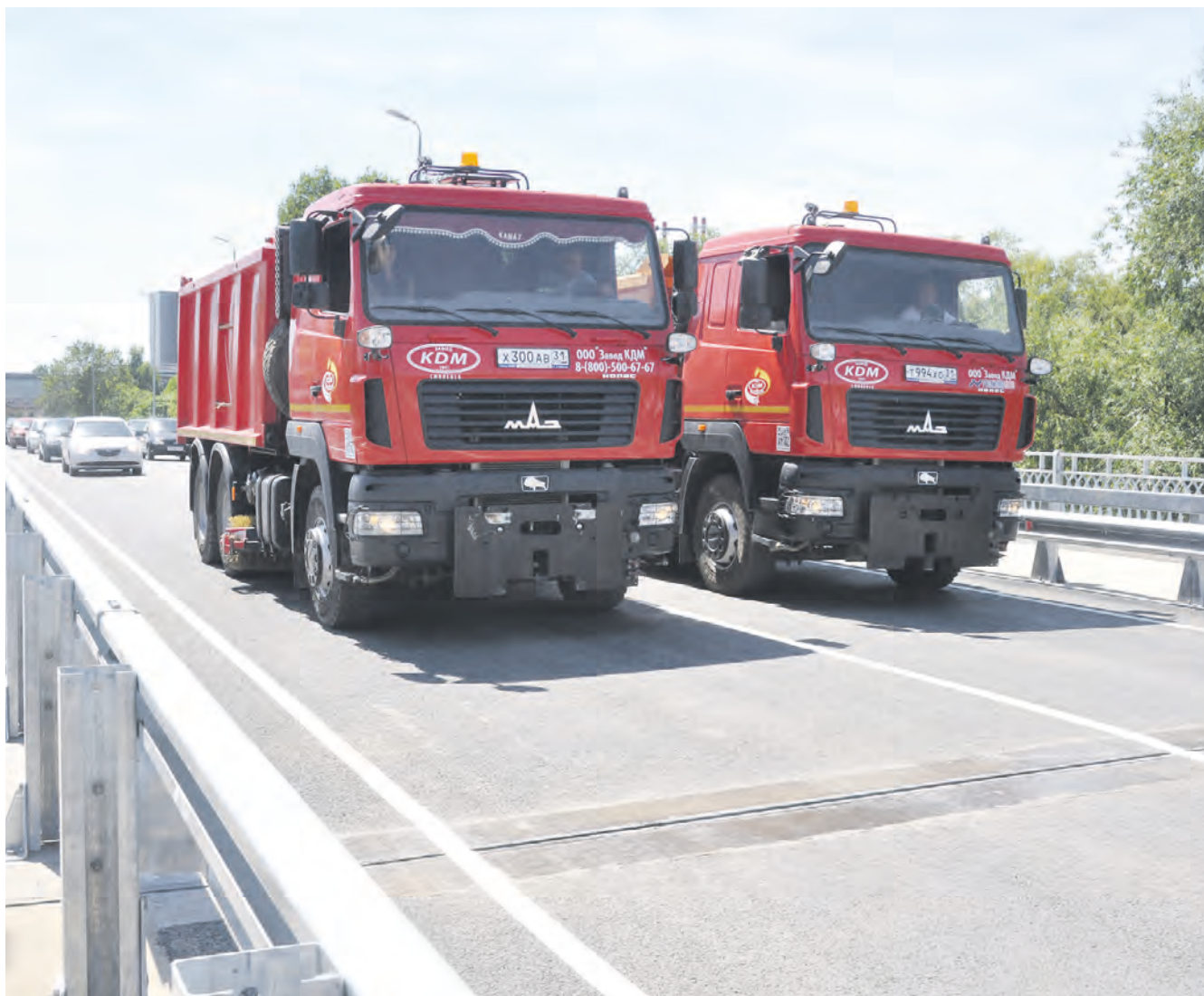
Так было открыто движение по Центральному мосту после его капитального ремонта.