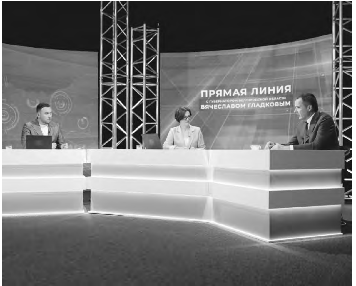
Во время прямой линии с губернатором Вячеславом Гладковым.

вреждено 729 объектов, которые подлежат восстановлению. Из них 183 — это многоквартирные дома. По состоянию на 4 июля, работы ведутся на 142 объектах. Тепловой контур сейчас закрыт на 98 объектах.