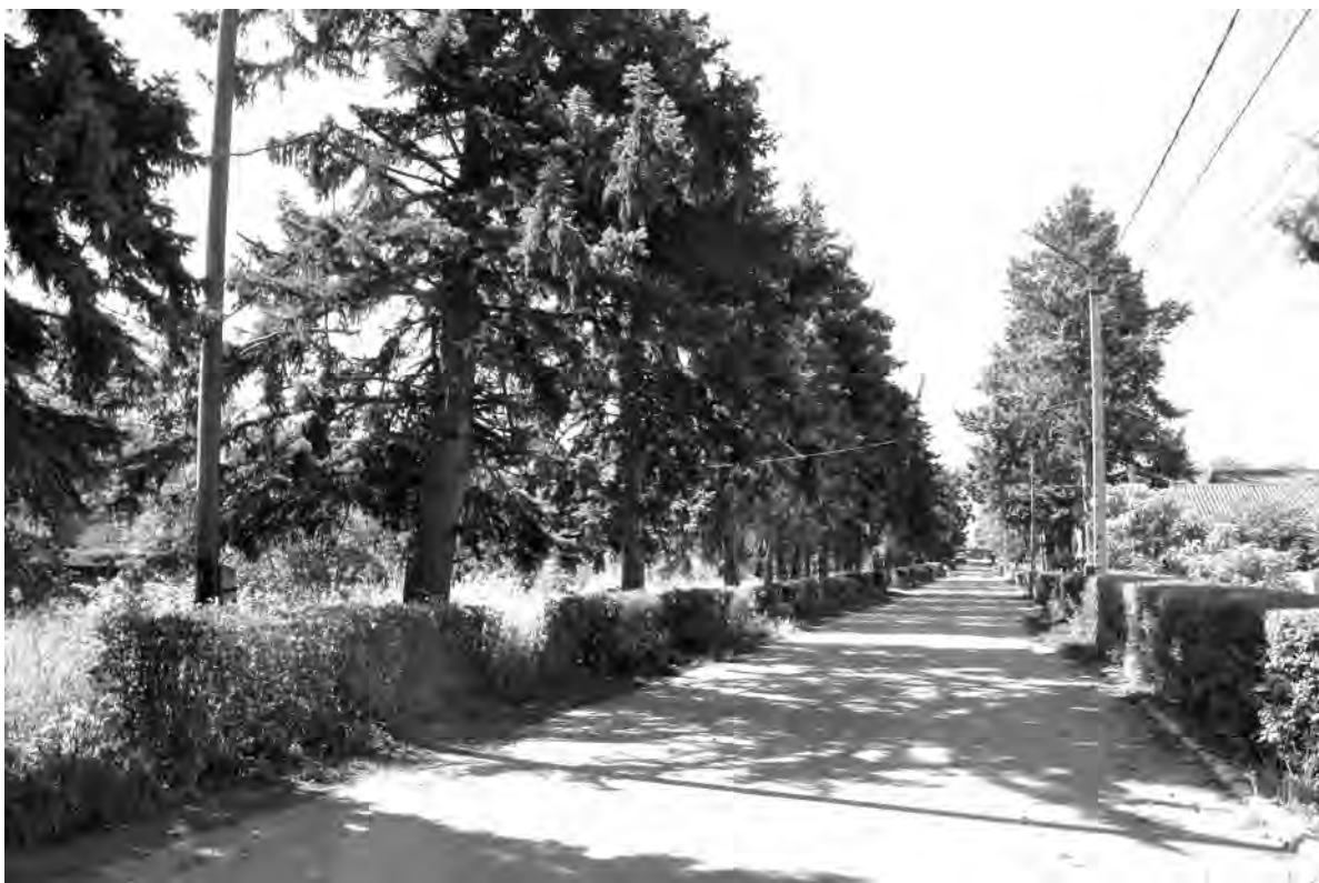
Это же место сейчас.