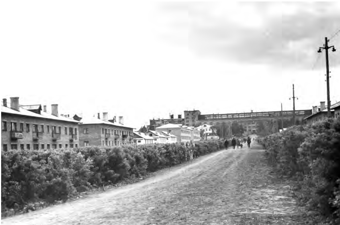
Посёлок сахарного завода в 1970-е гг.