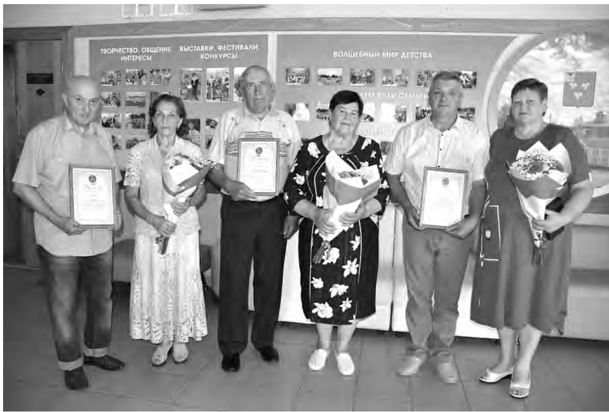
Супруги, награждённые медалями в День семьи, любви и верности.

работать и растить детей. Они ведут активную общественную деятельность на своей сельской территории, принимали участие в конкурсе «Ветеранское подворье» и пользуются уважением среди односельчан.