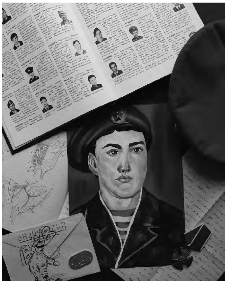
Память о павшем воине.

Анастасия БОРИСОВА.