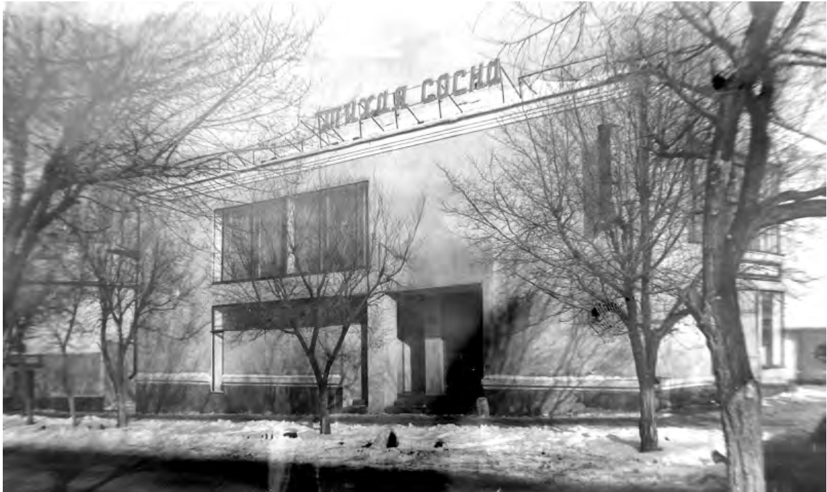
Ул. Мостовая (К. Маркса), ресторан «Тихая Сосна». 1970-е годы.