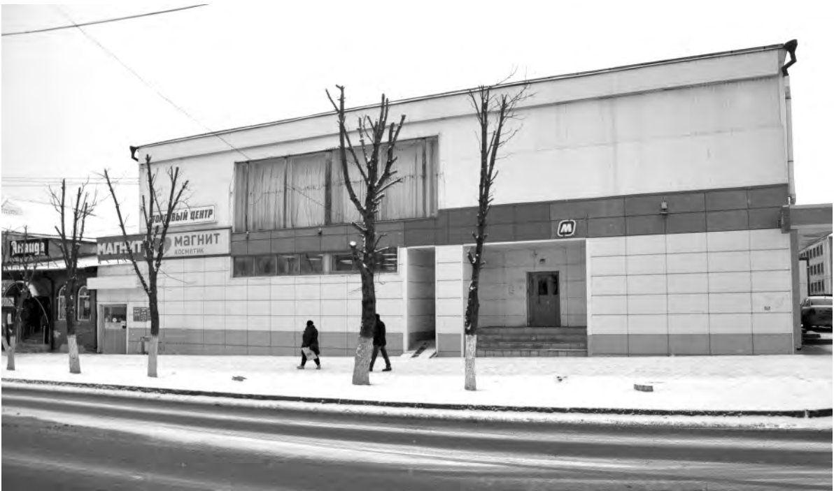
Это же место сейчас.