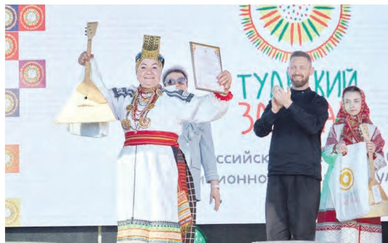
Заслуженные награды всероссийского фестиваля.