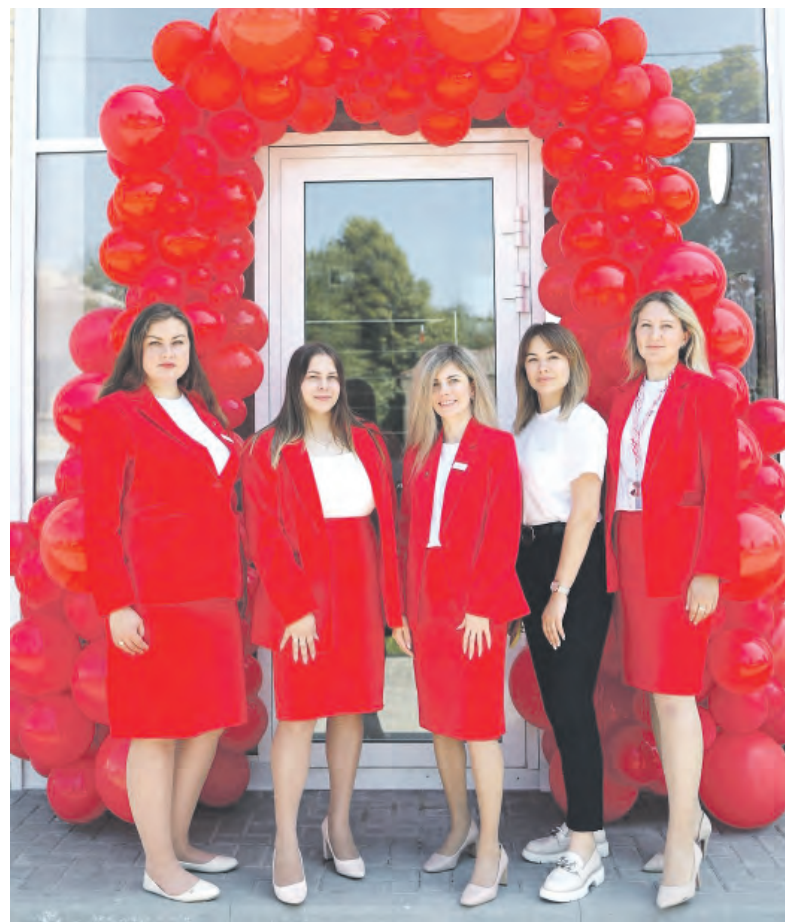
Алексеевские сотрудницы Альфа-Банка.

Генеральная лицензия Банка России № 1326 от 16 января 2015 г.