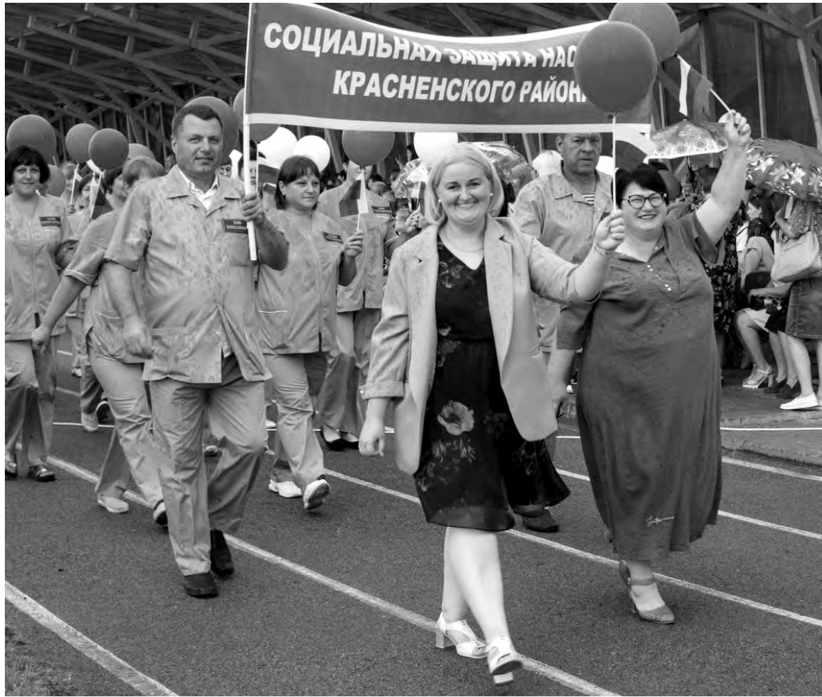
Сотрудники службы социальной защиты населения всегда приходят на помощь тем, кто в ней нуждается.