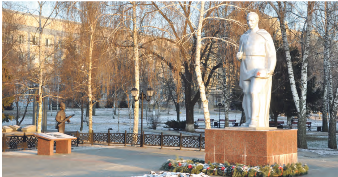
Мемориал на Никольской площади в Алексеевке, где захоронены более 700 воинов-освободителей Красной Армии.

Противник, будучи полуокружён, стремился во что бы то ни стало вывести в промежуток между Иловское и Алексеевкой 26-ю и 168-ю немецкие пехотные и 1-ю венгерскую танковую дивизию, а также собираемые