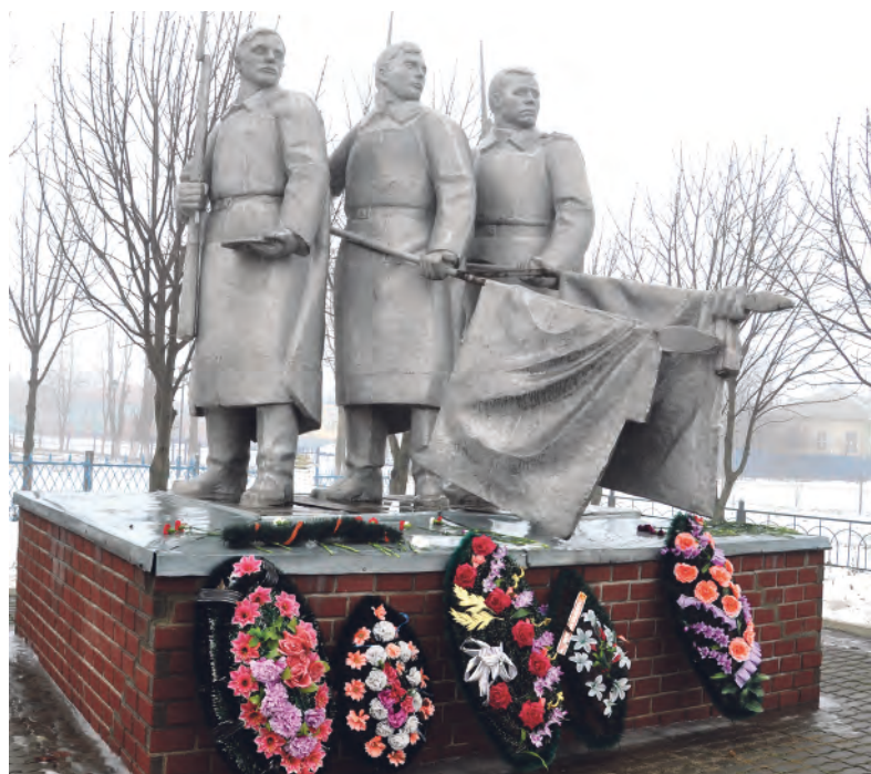
Памятник на братской могиле в Подсереднем, где завершилась Острогожско-Россошанская операция.