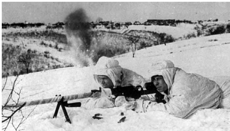
Бойцы отражают танковую атаку.