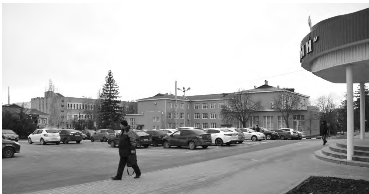
Это же место сейчас.