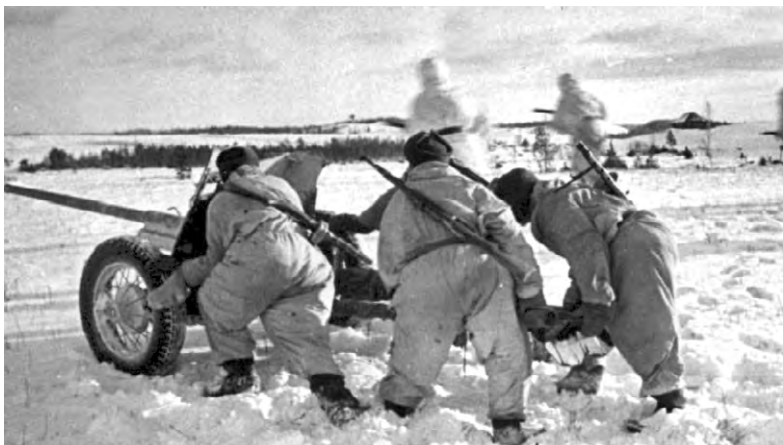
Артиллеристы на боевой позиции.