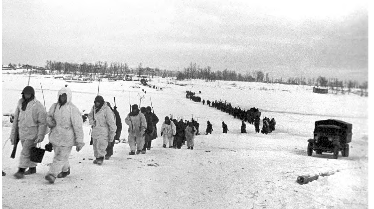
Наступающие подразделения Красной Армии в январе 1943 года.