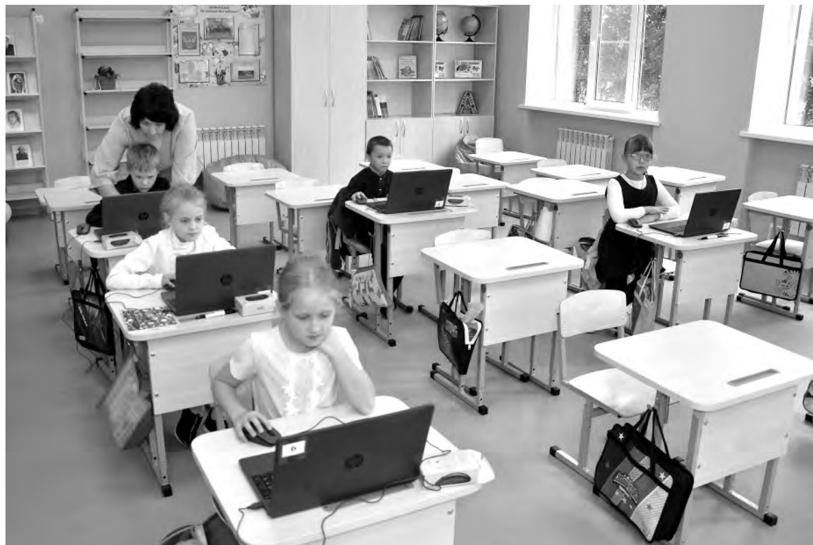
В обновлённой Ильинской школе парты для начальных классов по новому стандарту предназначены для одного ученика.