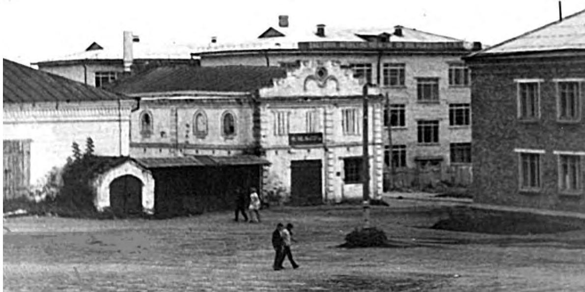
Площадь Победы. 1970-е годы.