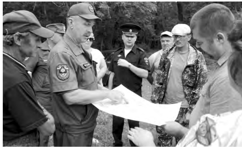
Практическая тренировка по обучению членов добровольных народных дружин.

Со всеми проведены обучающие мероприятия по порядку их действий при несении службы в различных ситуациях. Разъяснены полномочия.