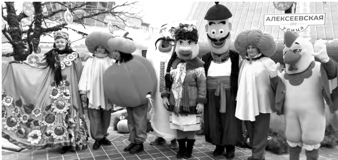
Стиль площадки, где презентовали вареники алексеевцы, поразил своей оригинальностью.