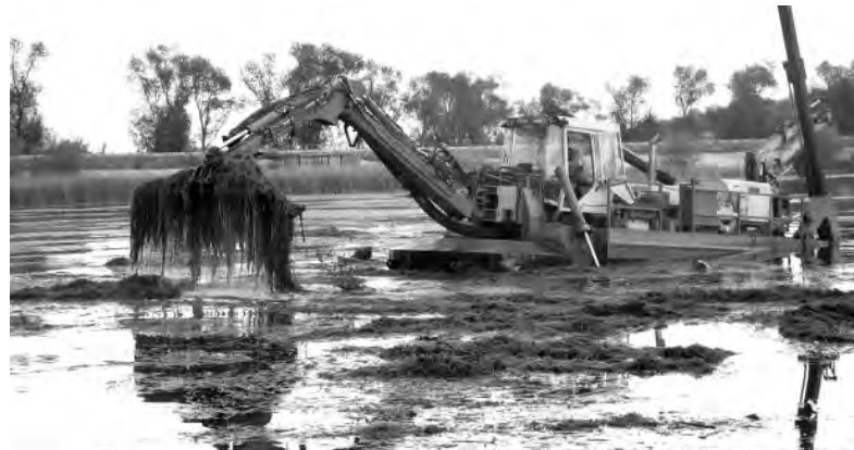
Плавучая очистительная техника успешно справилась с поставленной задачей.

работ, состоялась комиссия с участием населения, депутатов Земских собраний, активистов ТОС и представителей Белгородского водного хозяйства. Работы приняты.