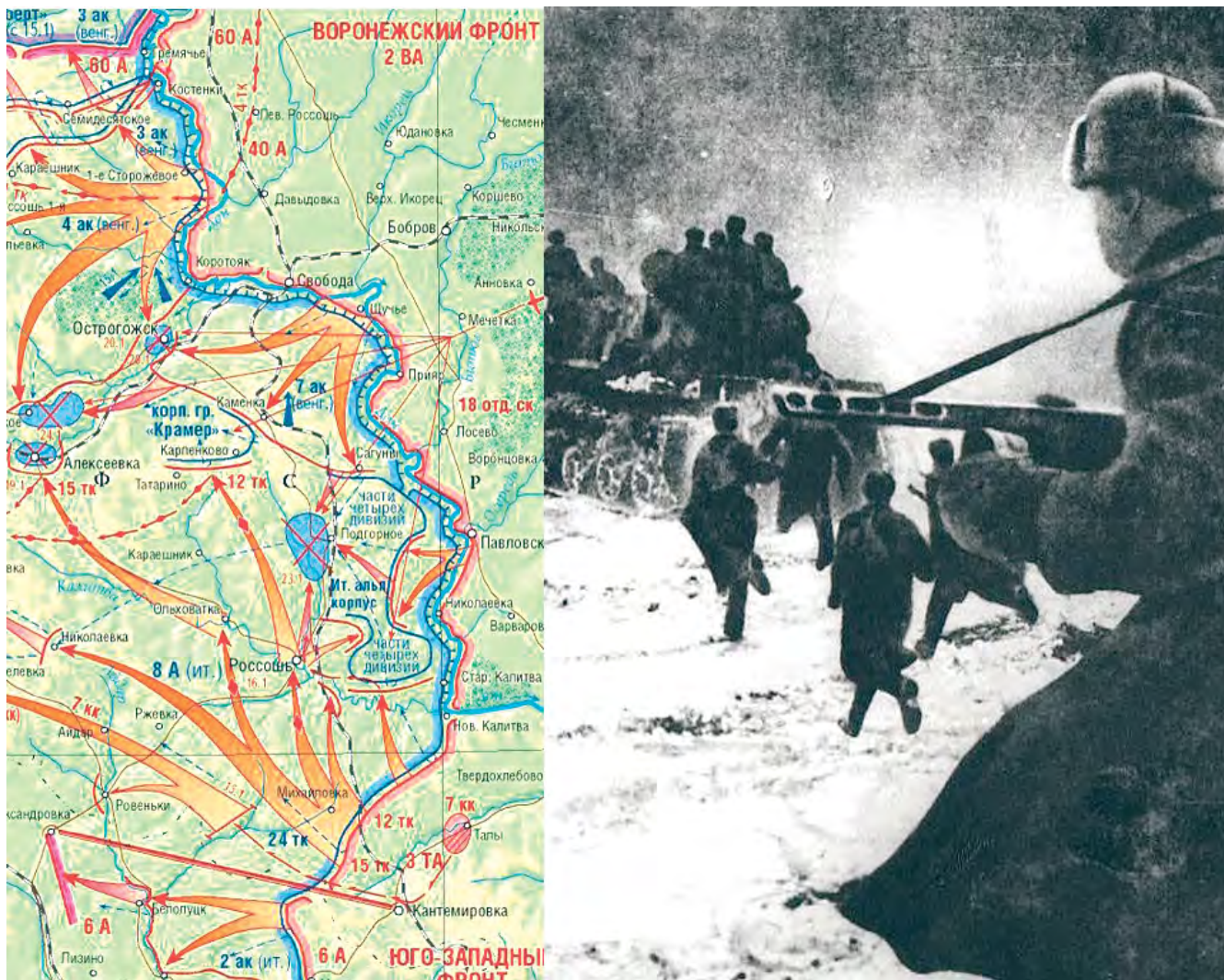
Карта Острогожско-Россошанской операции. Наступают воины Красной Армии в январе 1943 года.