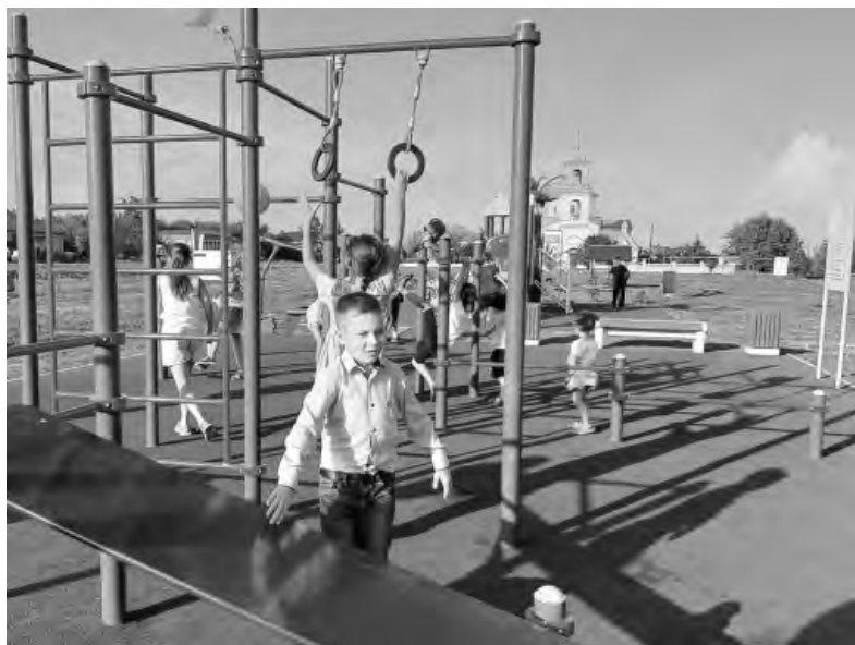
Счастливые лица староуколовских детей — лучшая награда для взрослых.